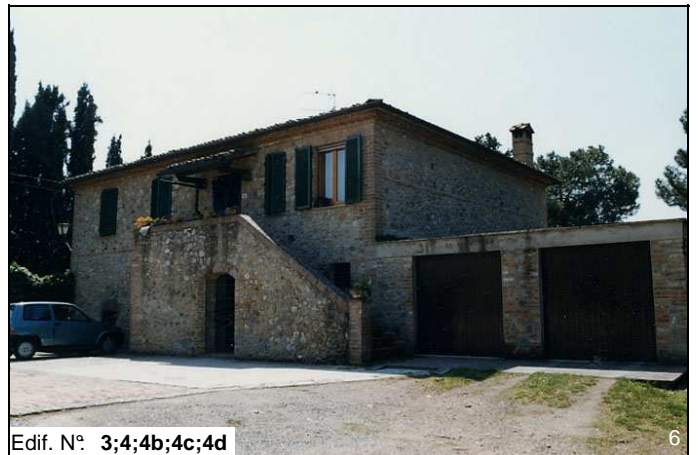
Edif. N° 3;4;4b;4c;4d