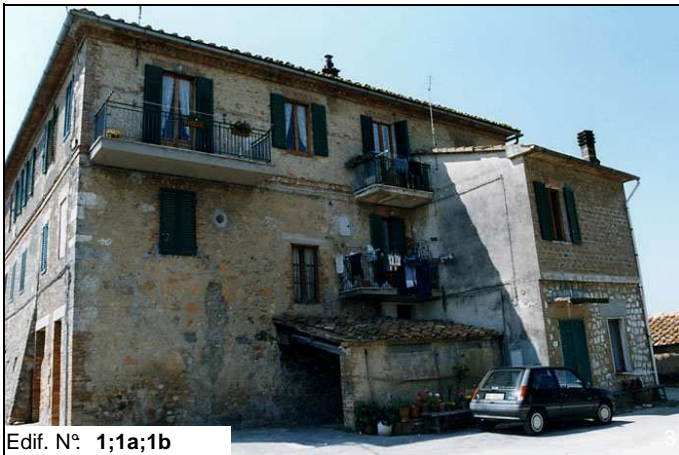
Edif. N° 1;1a;1b