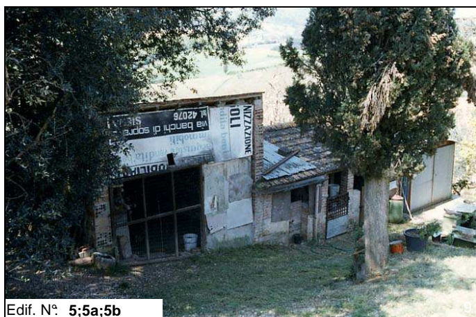
Edif. N° 5;5a;5b