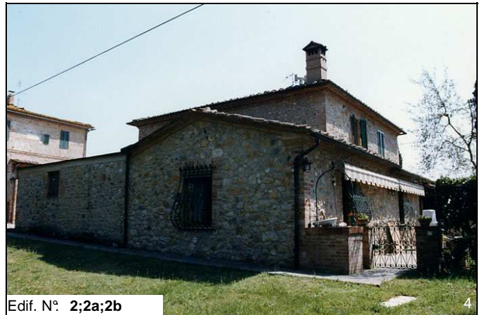
Edif. N° 2;2a;2b