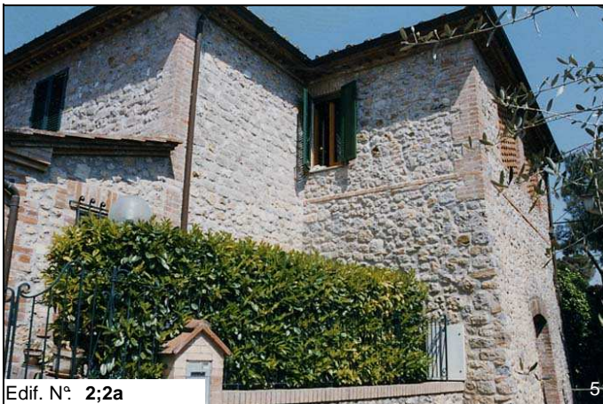
Edif. N° 2;2a