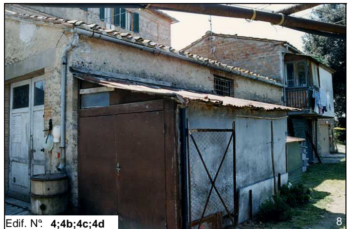
Edif. N° 4;4b;4c;4d