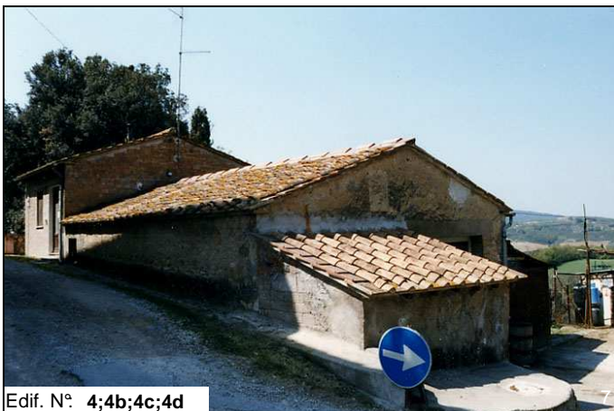
Edif. N° 4;4b;4c;4d