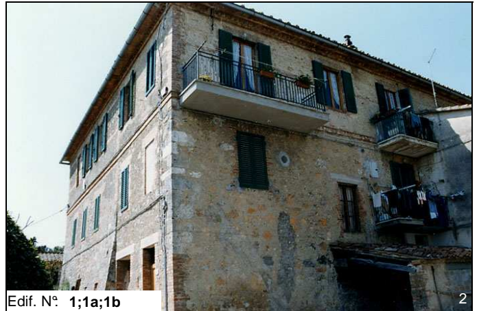
Edif. N° 1;1a;1b