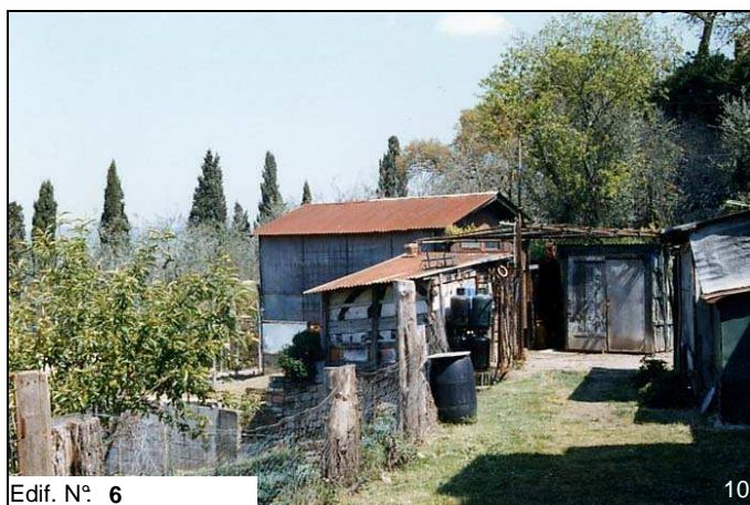
Edif. N° 6