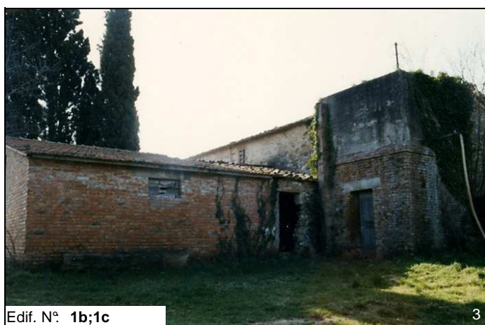
Edif. N° 1b;1c