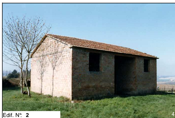
Edif. N° 2