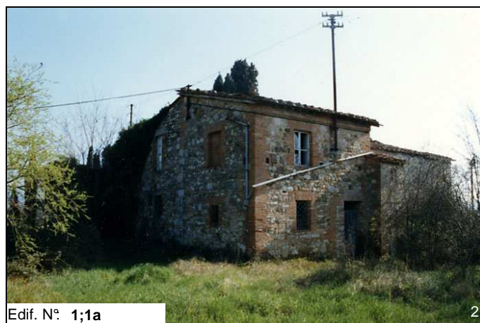
Edif. N° 1;1a