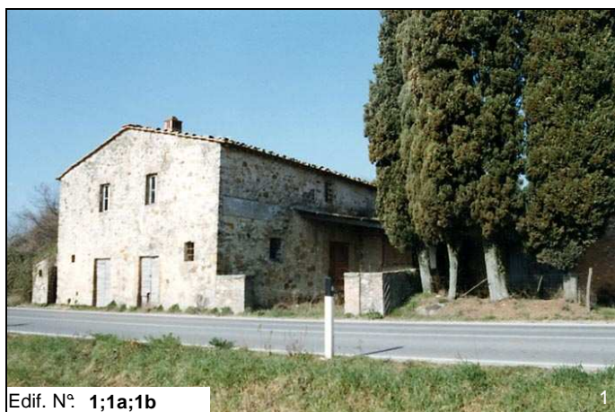
Edif. N° 1;1a;1b