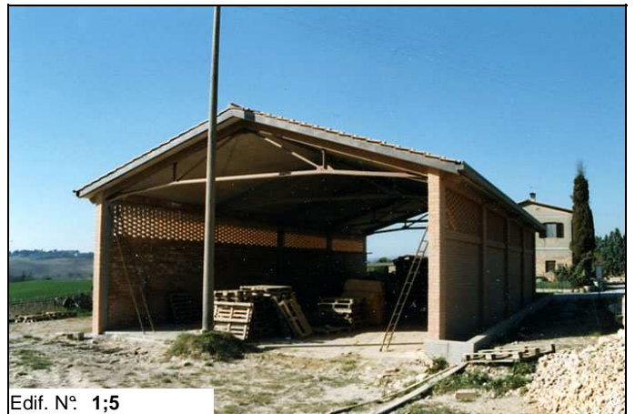
Edif. N° 1;5