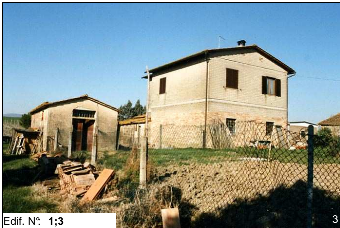
Edif. N° 1;3