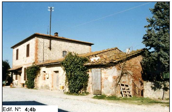
Edif. N° 4;4b