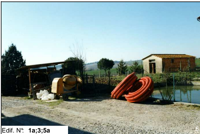
Edif. N° 1a;3;5a