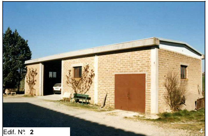
Edif. N° 2