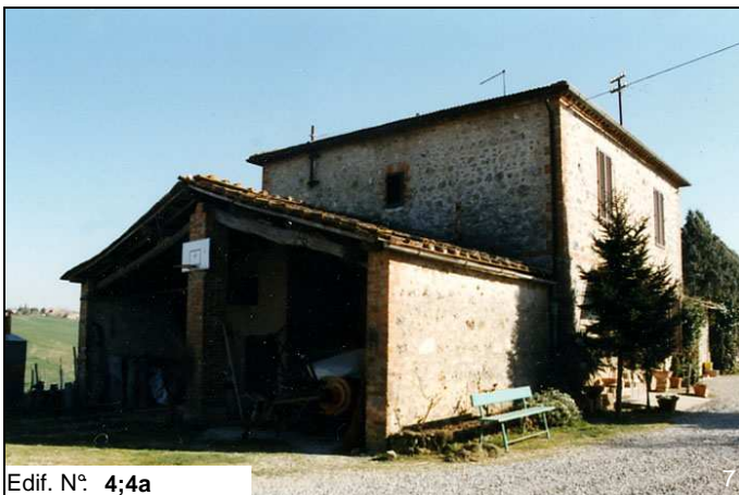
Edif. N° 4;4a