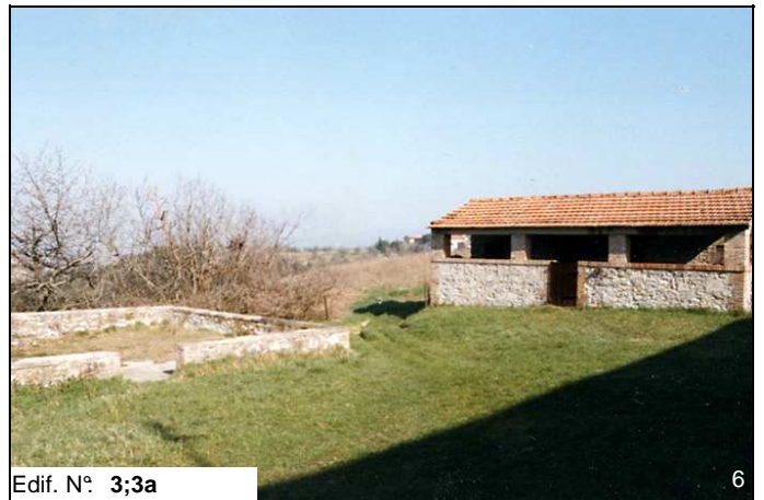
Edif. N° 3;3a