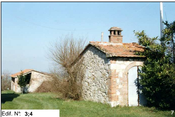
Edif. N° 3;4