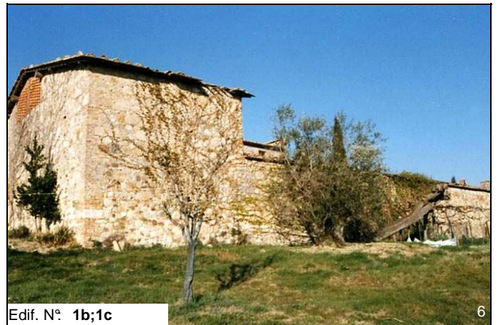
Edif. N° 1b;1c