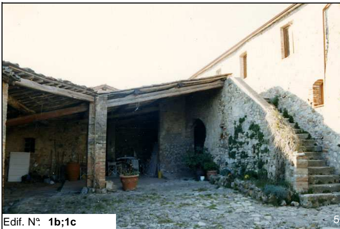
Edif. N° 1b;1c