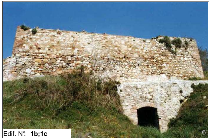
Edif. N° 1b;1c