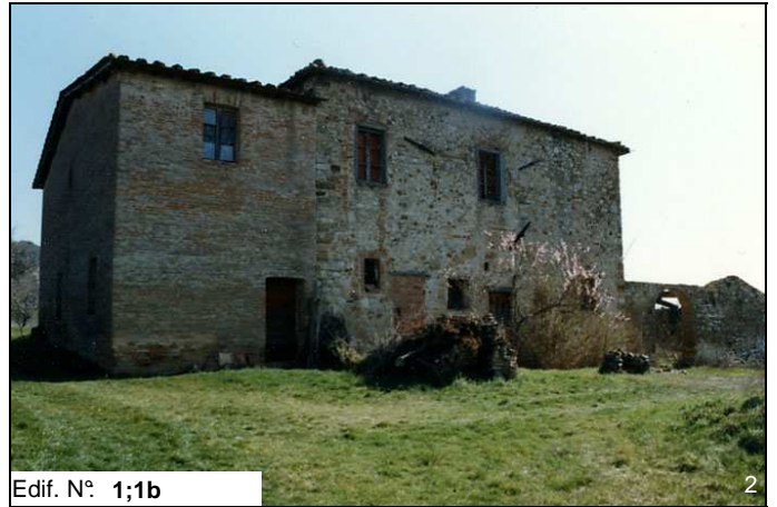
Edif. N° 1;1b