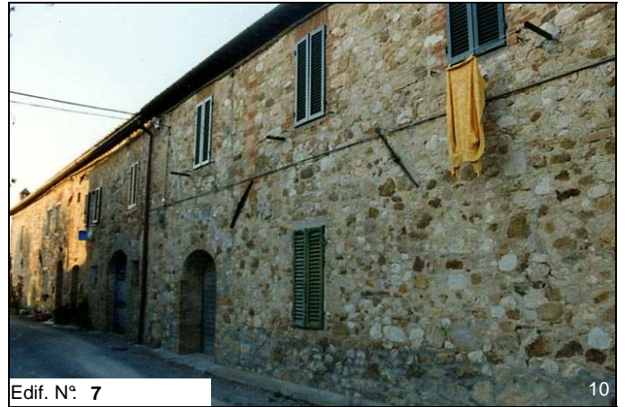
Edif. N° 7