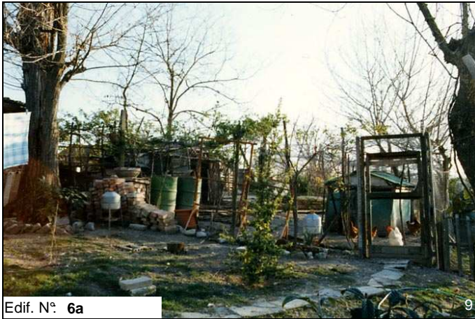
Edif. N° 6a