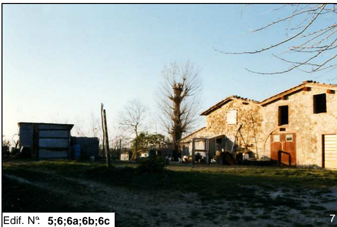
Edif. N° 5;6;6a;6b;6c