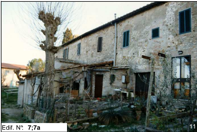
Edif. N° 7;7a