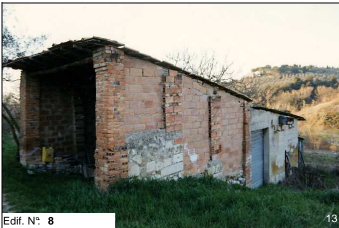
Edif. N° 8