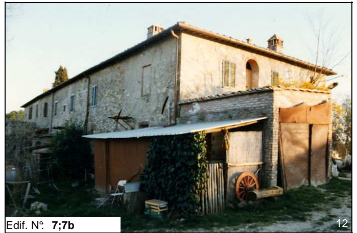
Edif. N° 7;7b