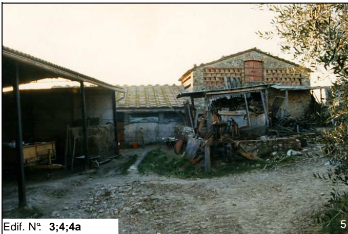
Edif. N° 3;4;4a