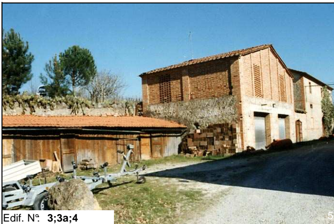
Edif. N° 3;3a;4