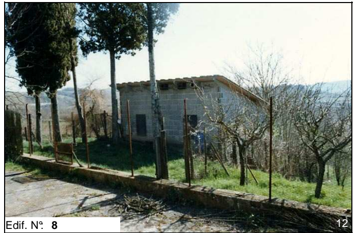
Edif. N° 8