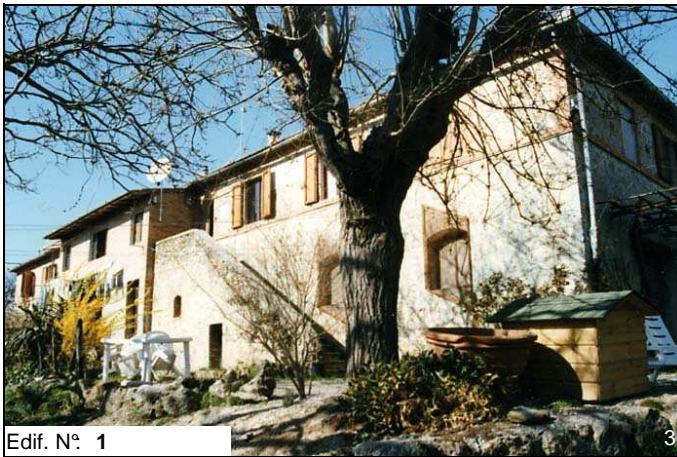
Edif. N° 1