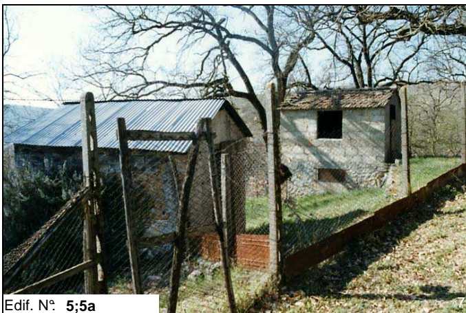
Edif. N° 5;5a