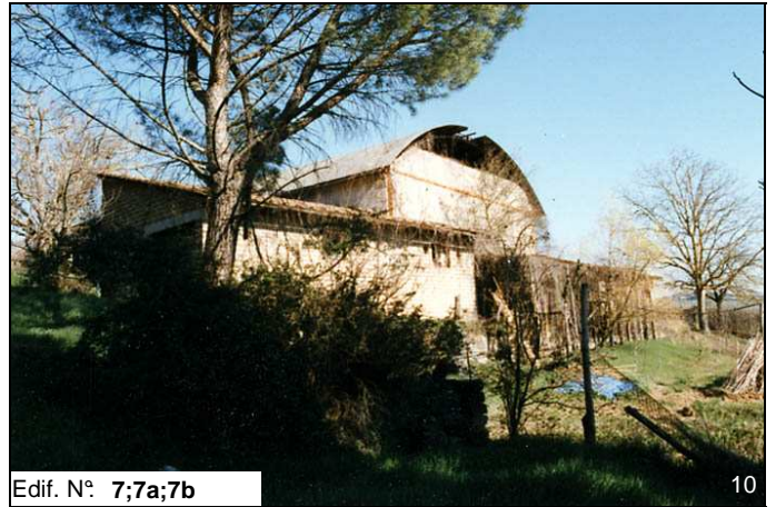
Edif. N° 7;7a;7b