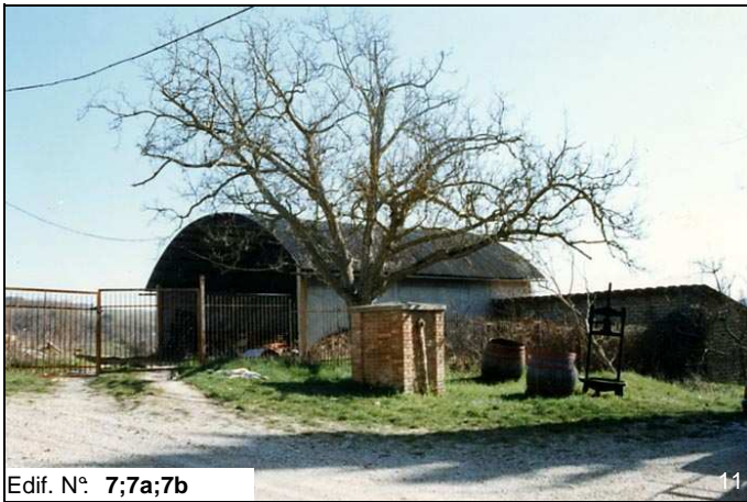
Edif. N° 7;7a;7b