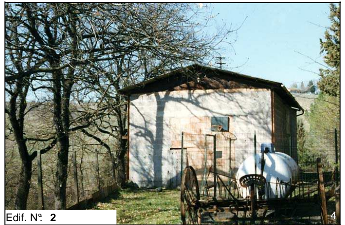
Edif. N° 2