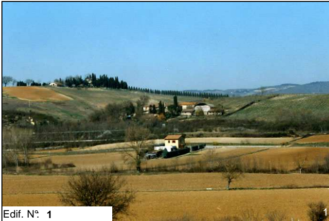
Edif. N° 1