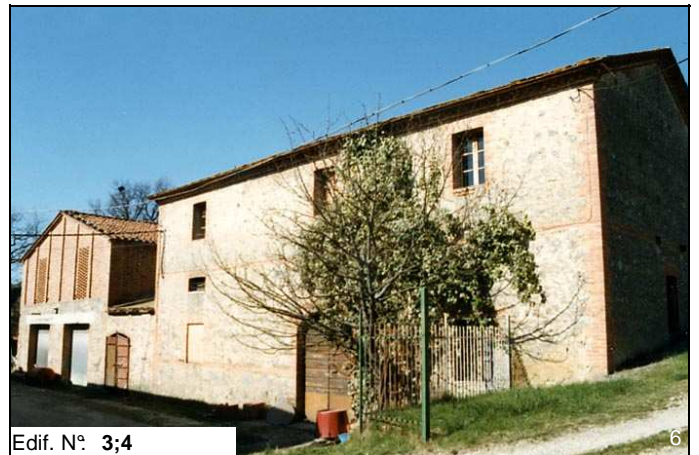
Edif. N° 3;4