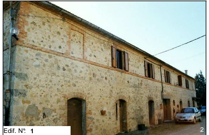
Edif. N° 1