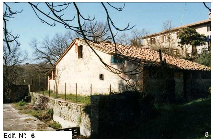
Edif. N° 6