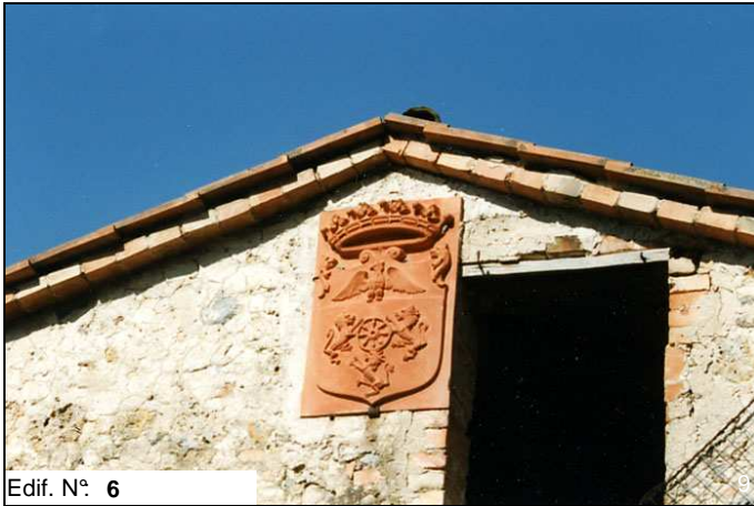
Edif. N° 6