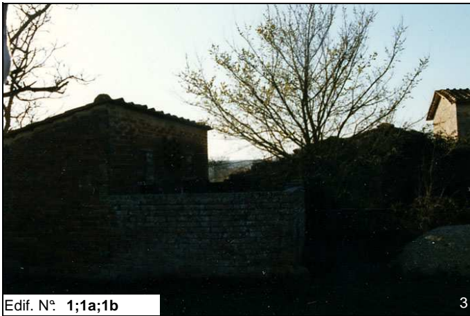
Edif. N° 1;1a;1b