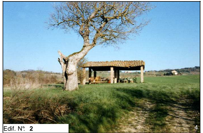
Edif. N° 2