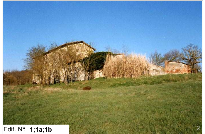
Edif. N° 1;1a;1b