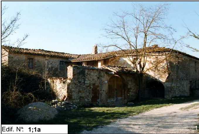
Edif. N° 1;1a