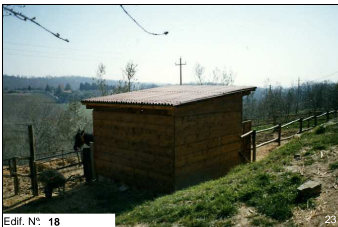
Edif. N° 18