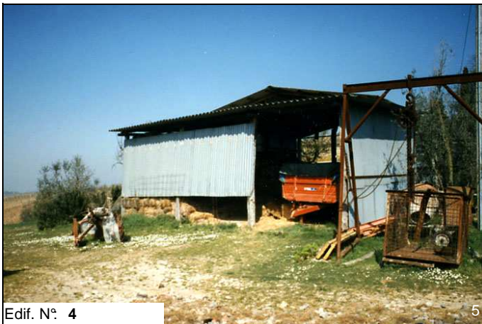
Edif. N° 4