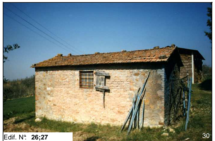
Edif. N° 26;27