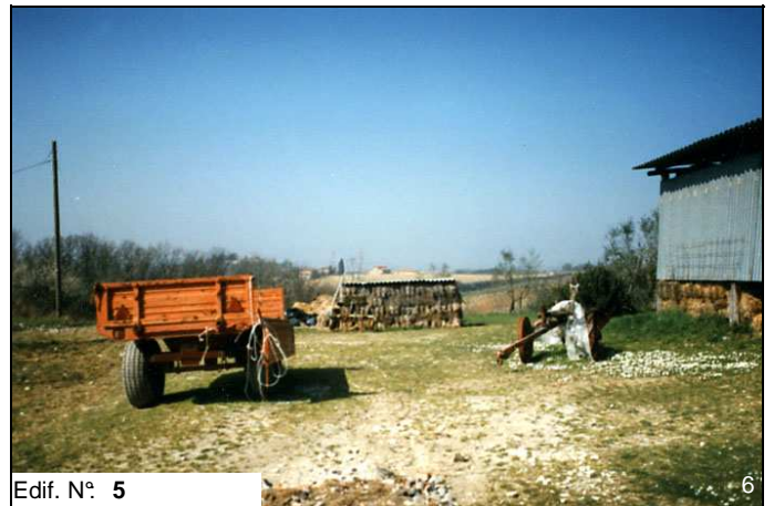
Edif. N° 5