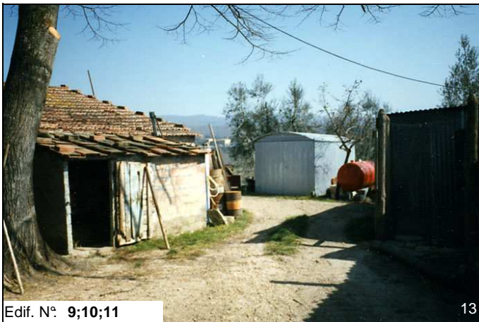
Edif. N° 9;10;11