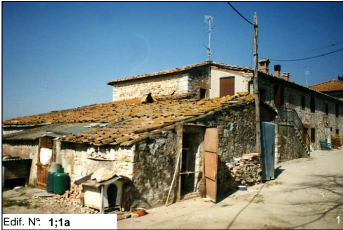
Edif. N° 1;1a