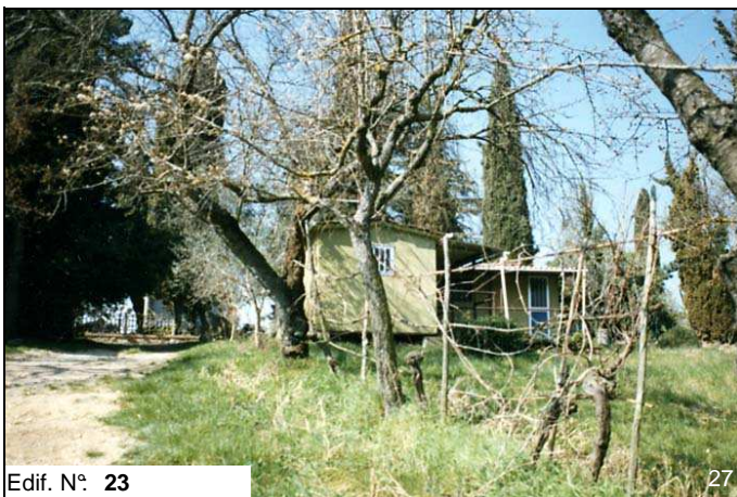
Edif. N° 23