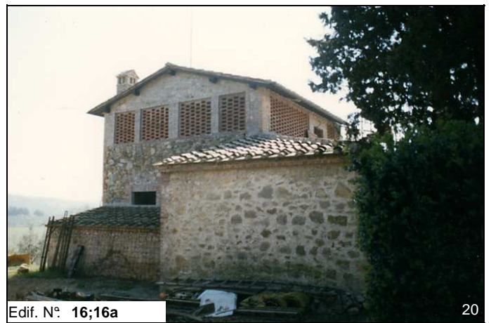
Edif. N° 16;16a