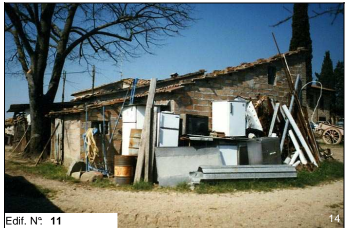
Edif. N° 11