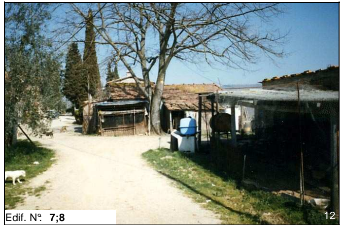
Edif. N° 7;8