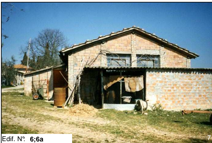
Edif. N° 6;6a