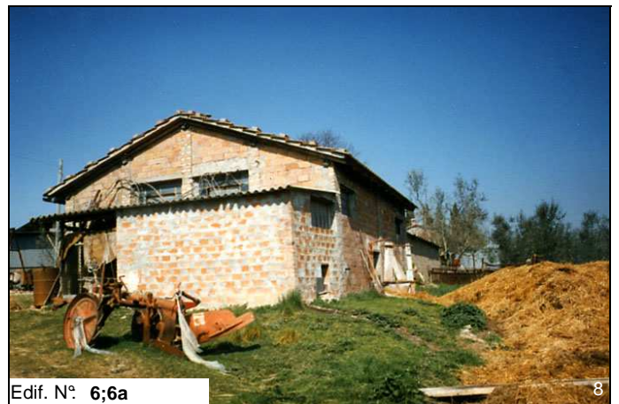
Edif. N° 6;6a