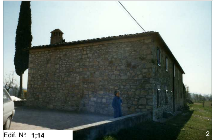
Edif. N° 1;14