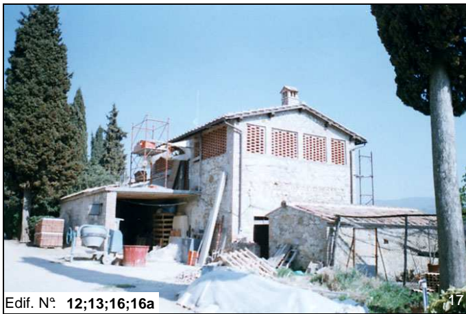
Edif. N° 12;13;16;16a