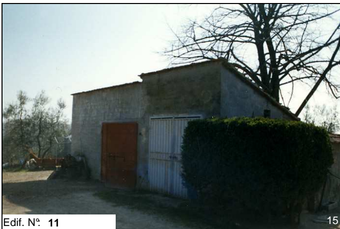
Edif. N° 11