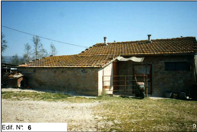
Edif. N° 6