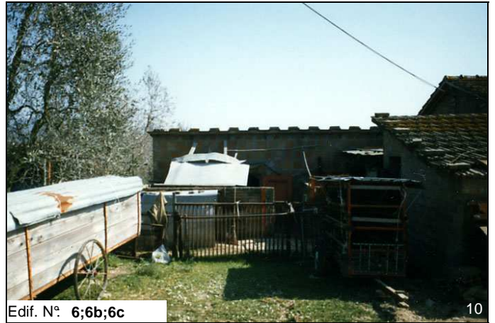
Edif. N° 6;6b;6c