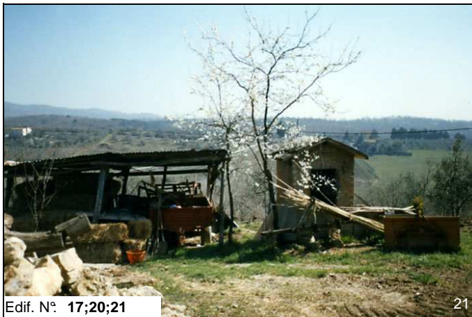
Edif. N° 17;20;21