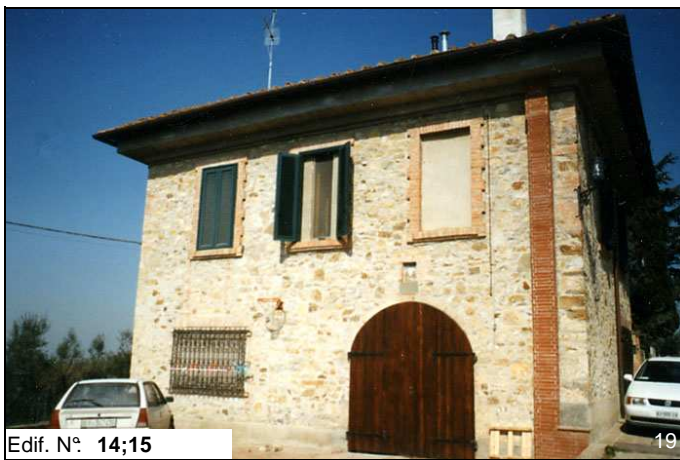
Edif. N° 14;15