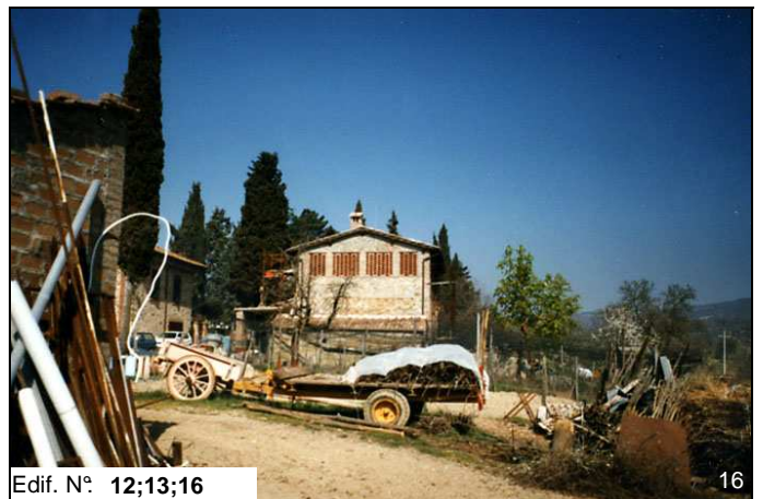
Edif. N° 12;13;16