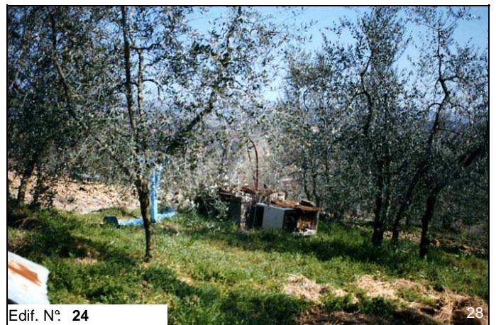
Edif. N° 24