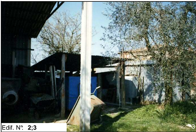
Edif. N° 2;3