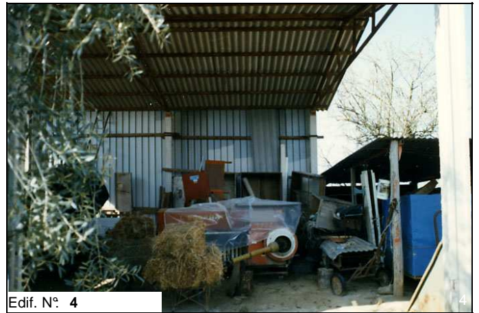
Edif. N° 4