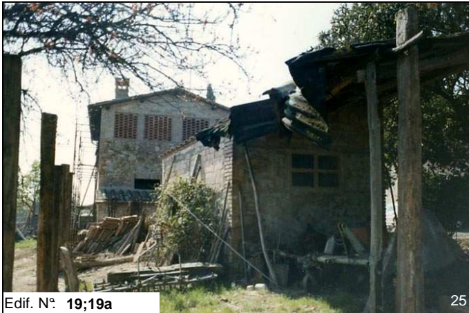
Edif. N° 19;19a