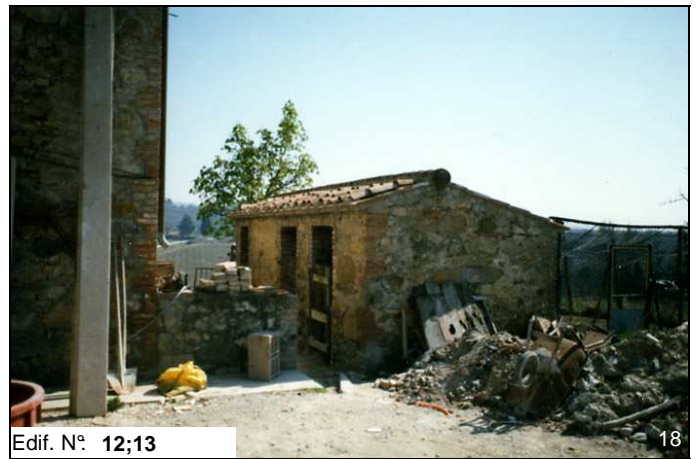
Edif. N° 12;13