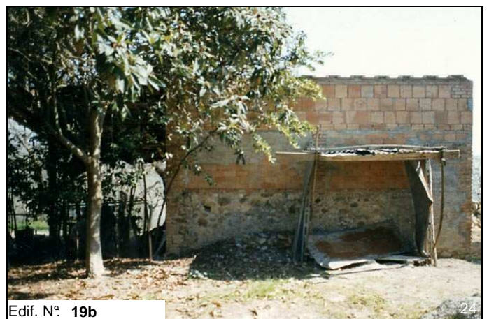
Edif. N° 19b