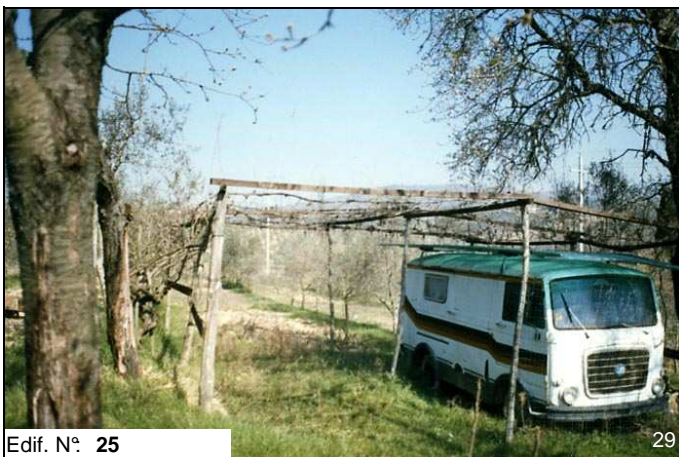
Edif. N° 25