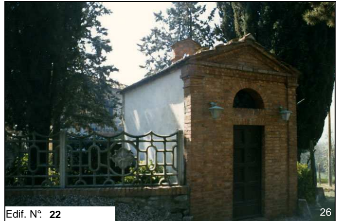
Edif. N° 22