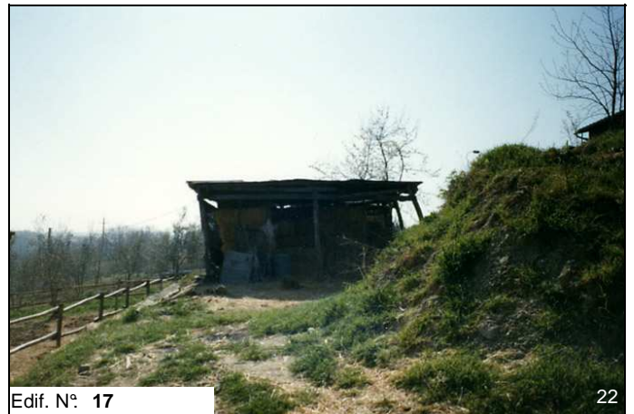
Edif. N° 17