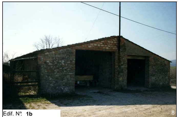
Edif. N° 1b