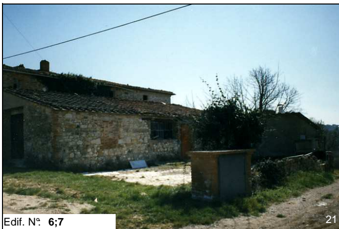
Edif. N° 6;7