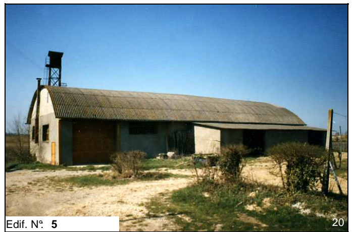
Edif. N° 5