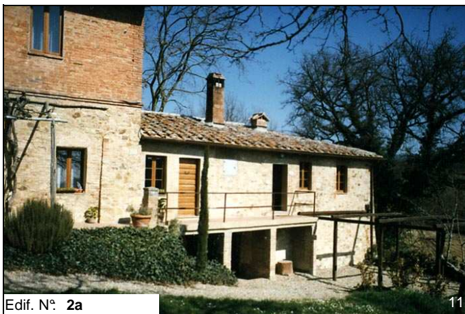
Edif. N° 2a