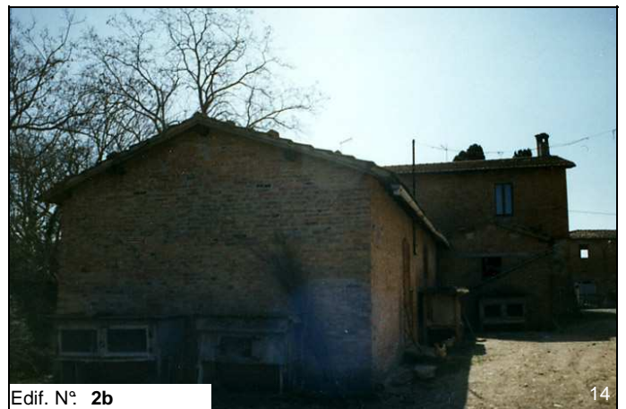
Edif. N° 2b