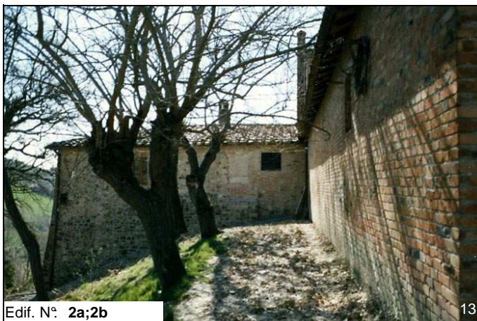
Edif. N° 2a;2b