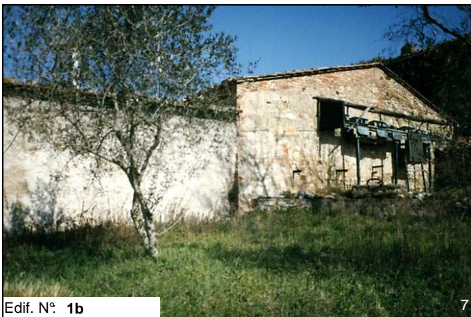
Edif. N° 1b