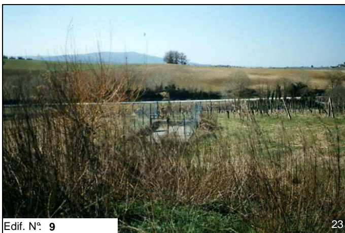
Edif. N° 9