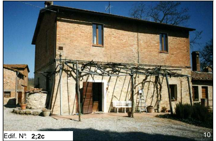
Edif. N° 2;2c