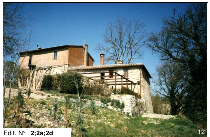
Edif. N° 2;2a;2d