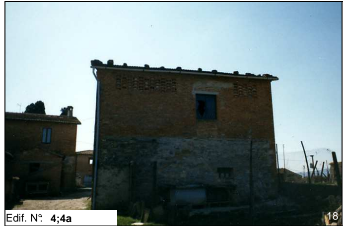
Edif. N° 4;4a