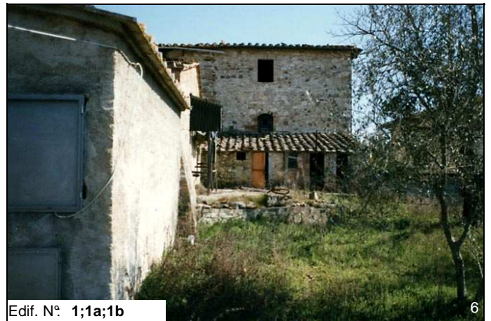
Edif. N° 1;1a;1b