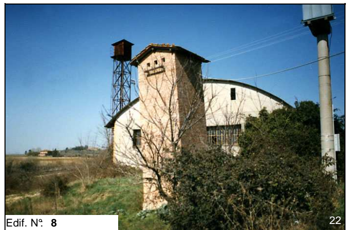
Edif. N° 8