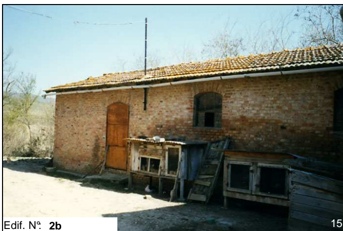
Edif. N° 2b