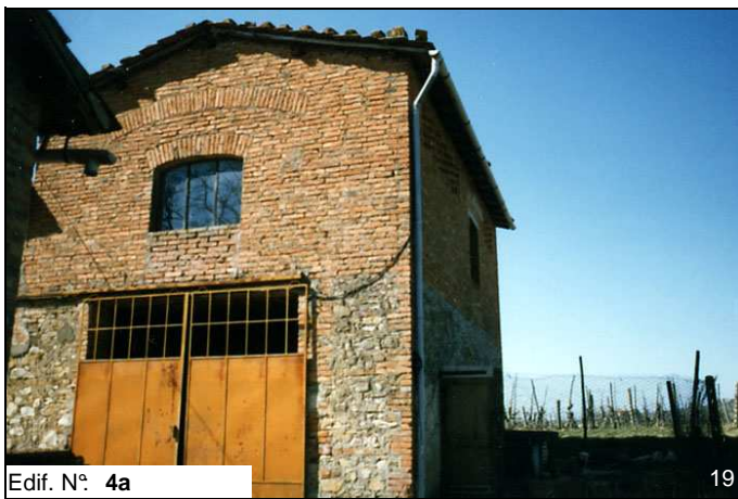
Edif. N° 4a