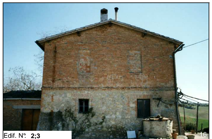
Edif. N° 2;3