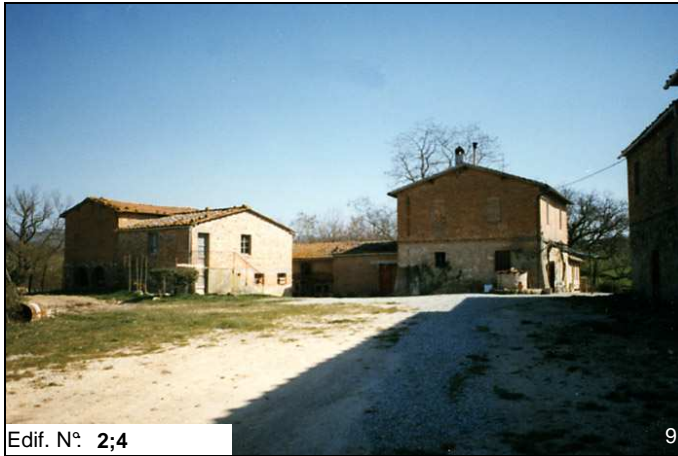
Edif. N° 2;4