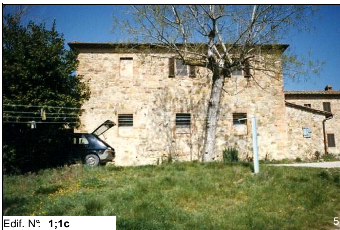
Edif. N° 1;1c