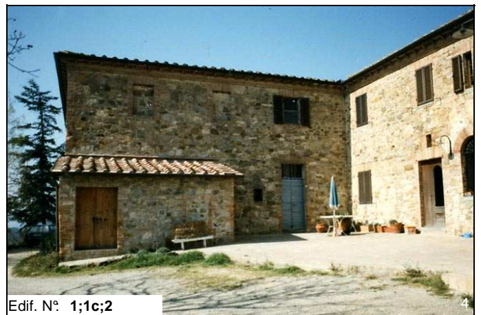
Edif. N° 1;1c;2