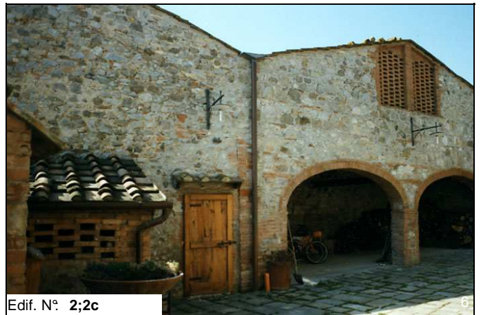
Edif. N° 2;2c