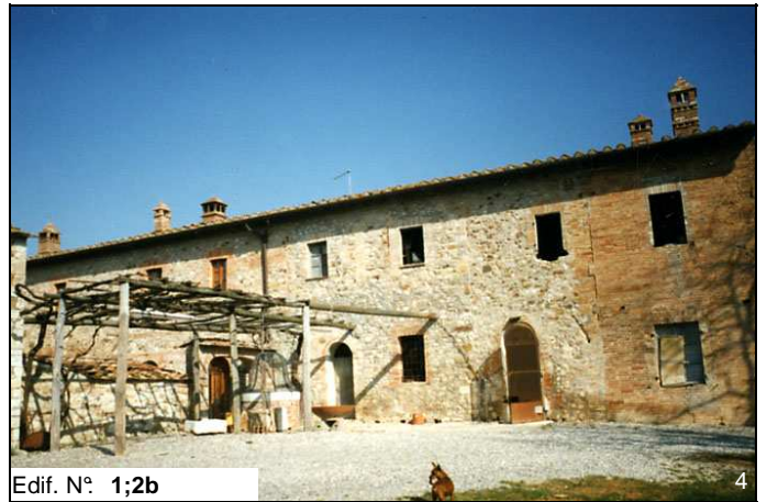
Edif. N° 1;2b