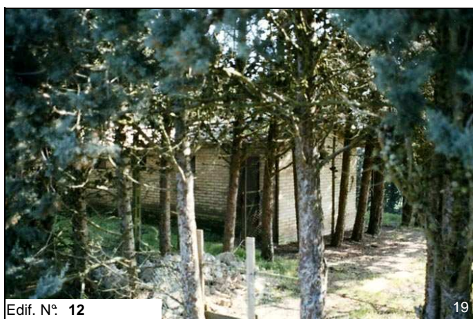
Edif. N° 12