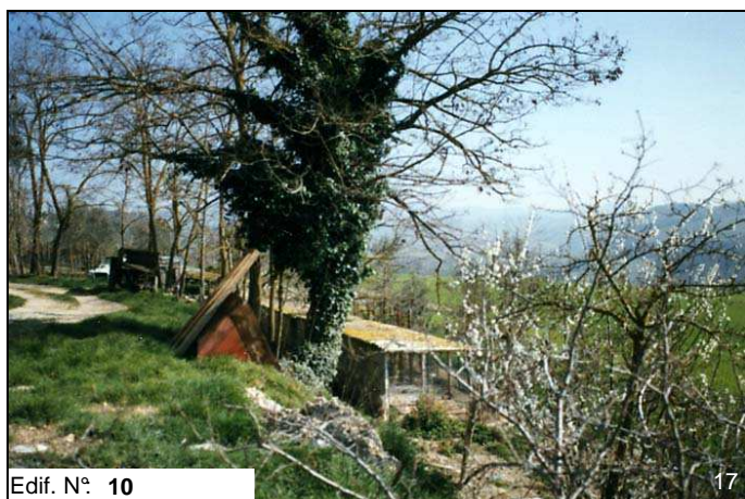
Edif. N° 10