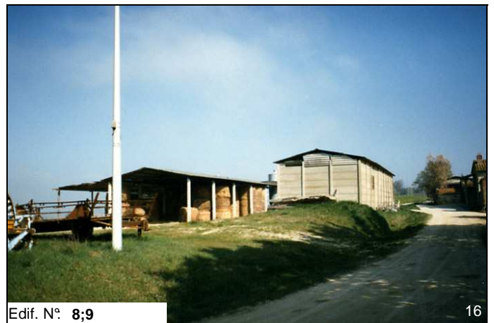
Edif. N° 8;9