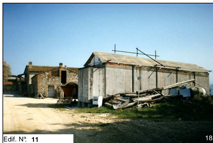
Edif. N° 11