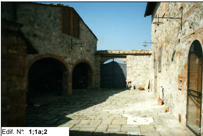
Edif. N° 1;1a;2