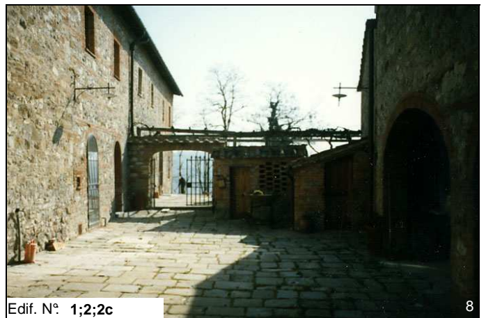
Edif. N° 1;2;2c