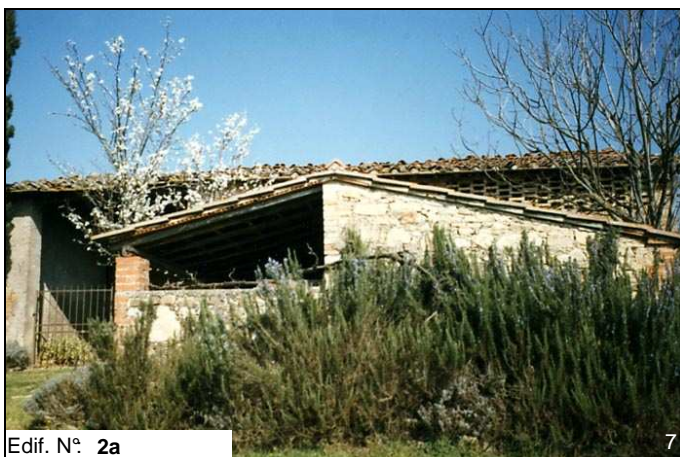
Edif. N° 2a