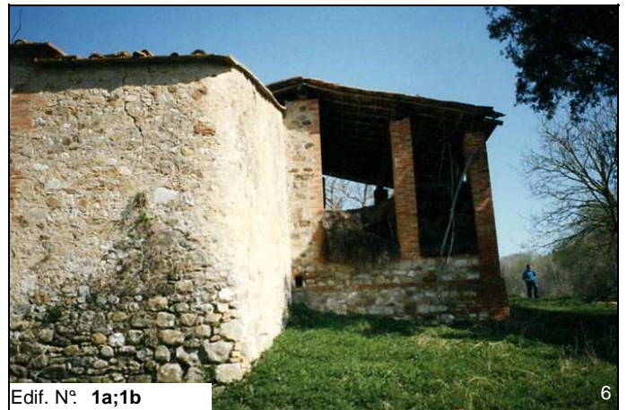
Edif. N° 1a;1b