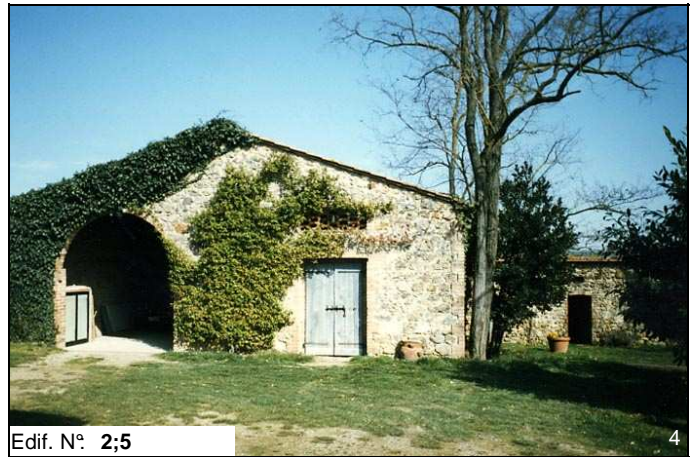
Edif. N° 2;5