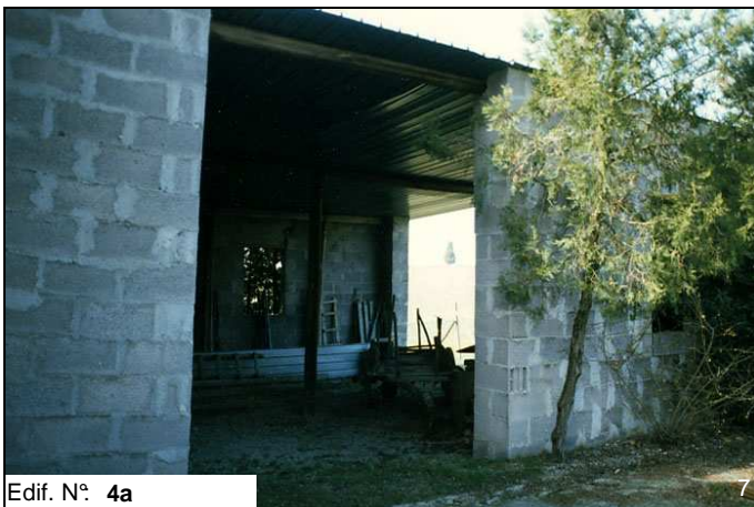
Edif. N° 4a