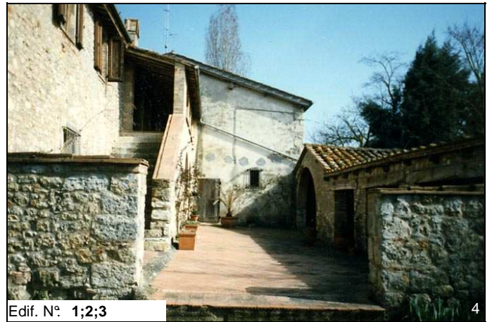
Edif. N° 1;2;3