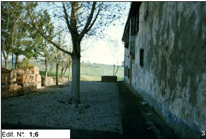
Edif. N° 1;6