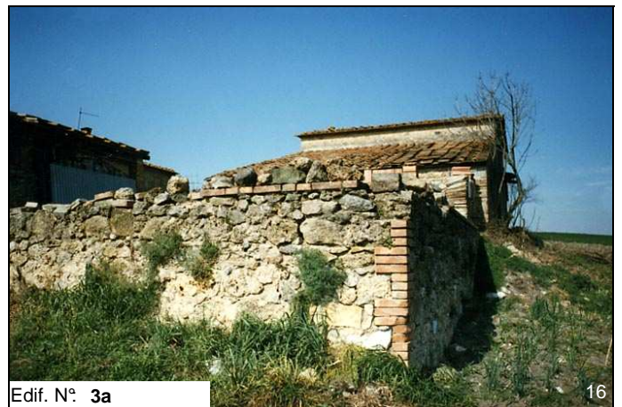
Edif. N° 3a