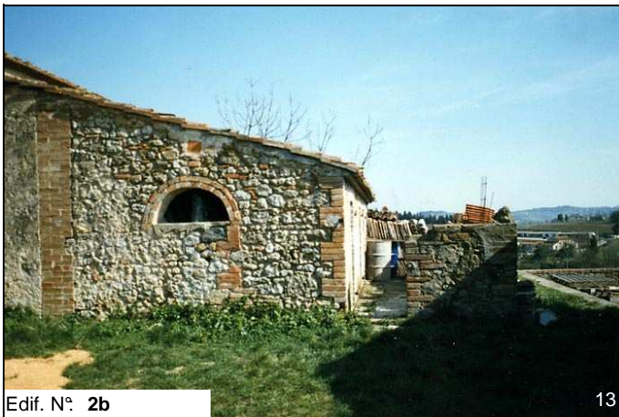
Edif. N° 2b