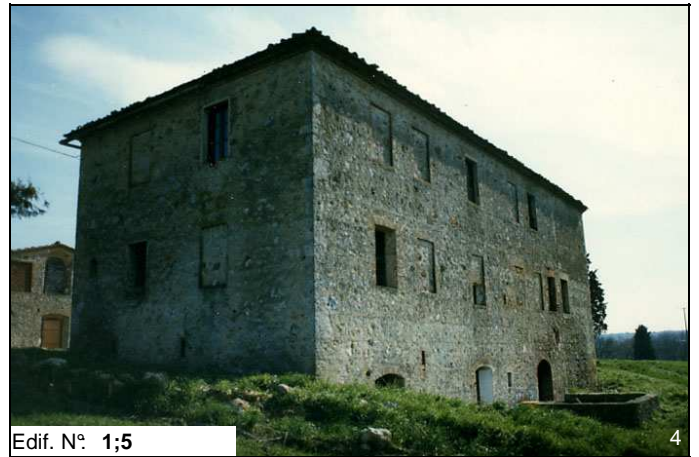
Edif. N° 1;5