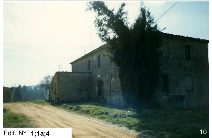
Edif. N° 1;1a;4