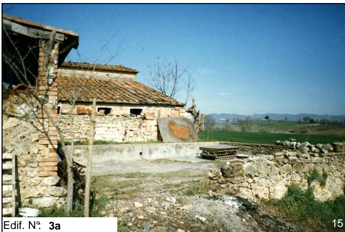
Edif. N° 3a