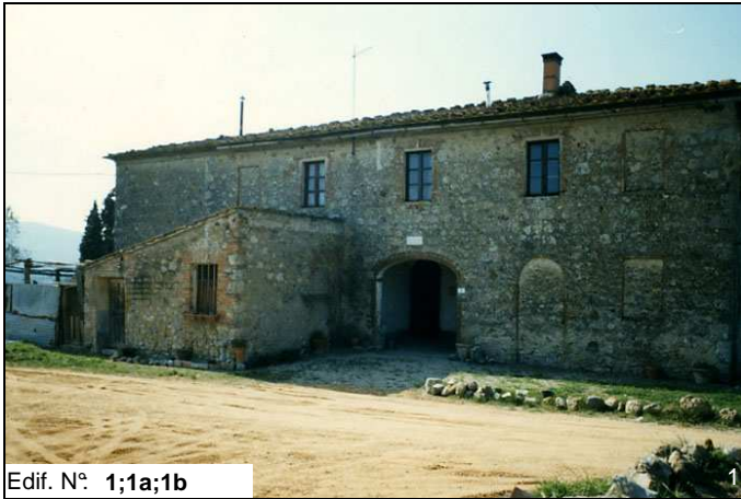
Edif. N° 1;1a;1b