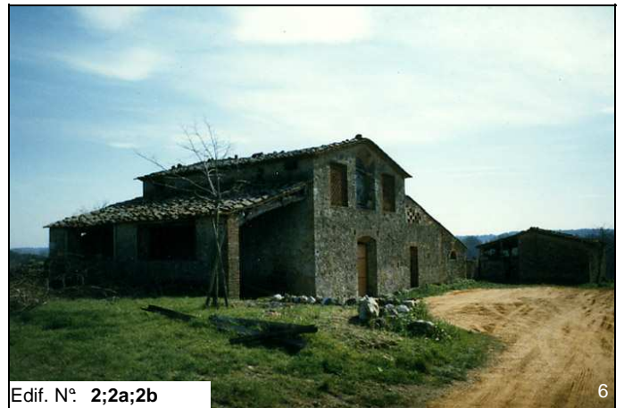
Edif. N° 2;2a;2b