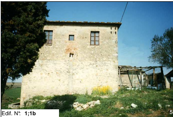
Edif. N° 1;1b