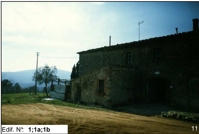
Edif. N° 1;1a;1b