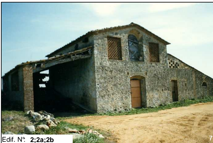
Edif. N° 2;2a;2b