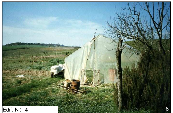
Edif. N° 4