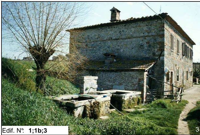
Edif. N° 1;1b;3