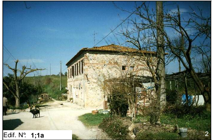
Edif. N° 1;1a