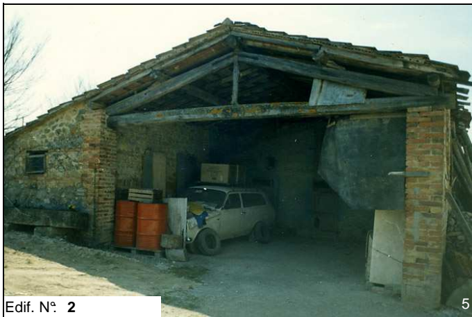
Edif. N° 2