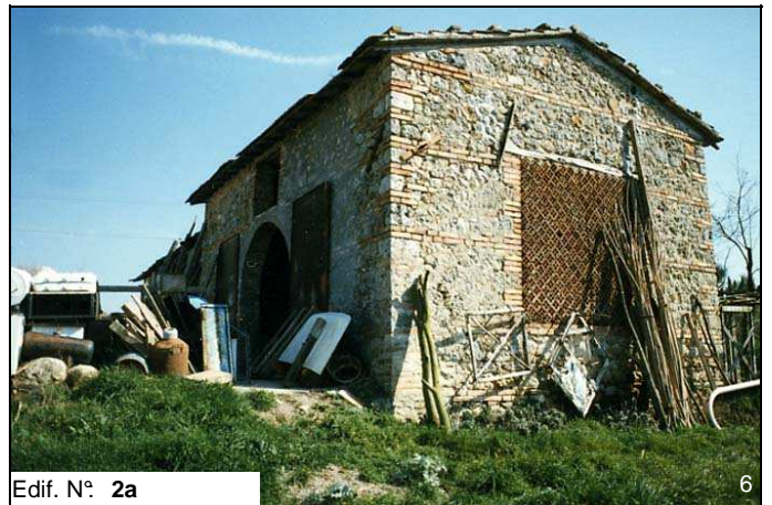
Edif. N° 2a