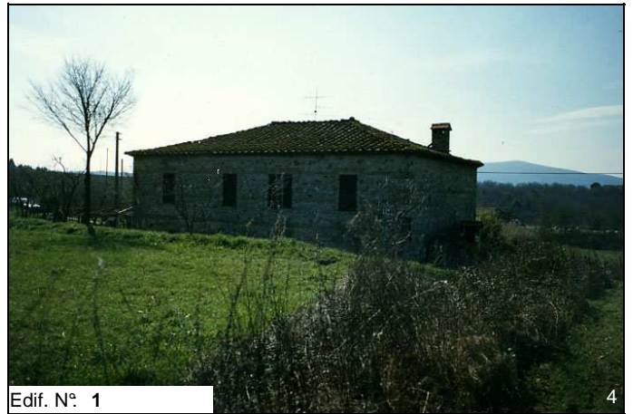
Edif. N° 1