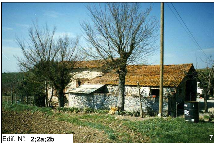
Edif. N° 2;2a;2b