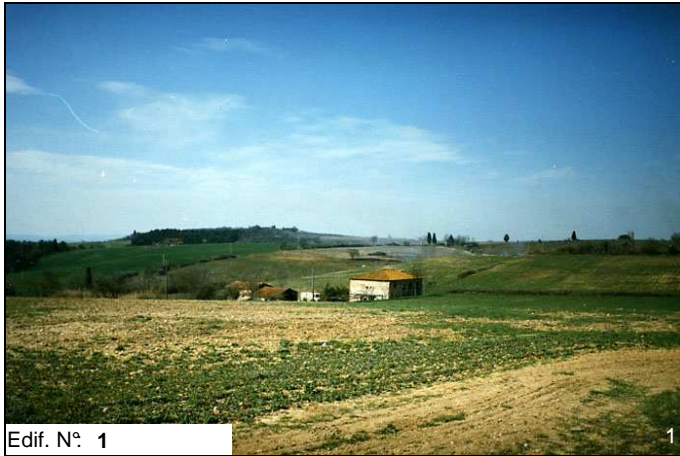
Edif. N° 1