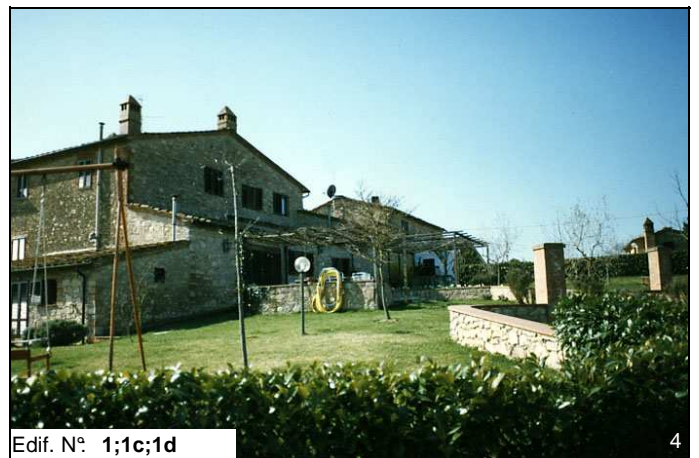
Edif. N° 1;1c;1d