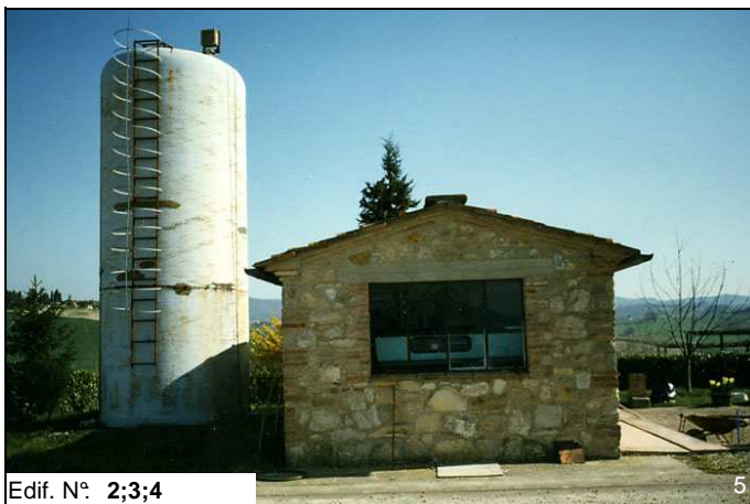
Edif. N° 2;3;4