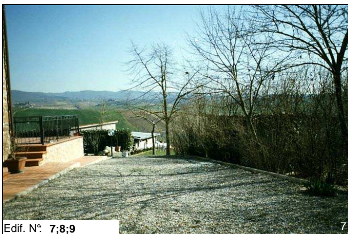
Edif. N° 7;8;9