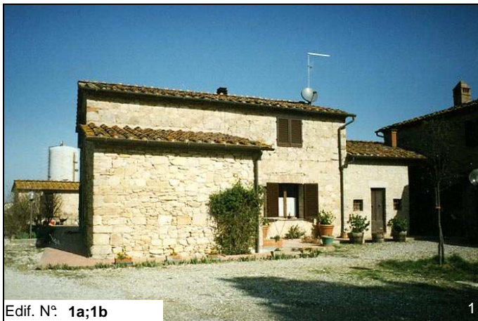
Edif. N° 1a;1b