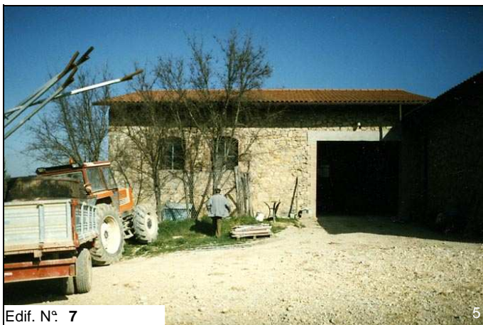
Edif. N° 7