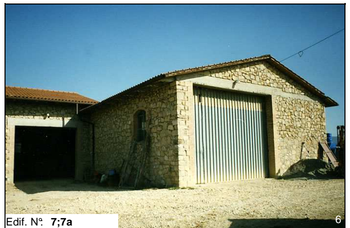
Edif. N° 7;7a