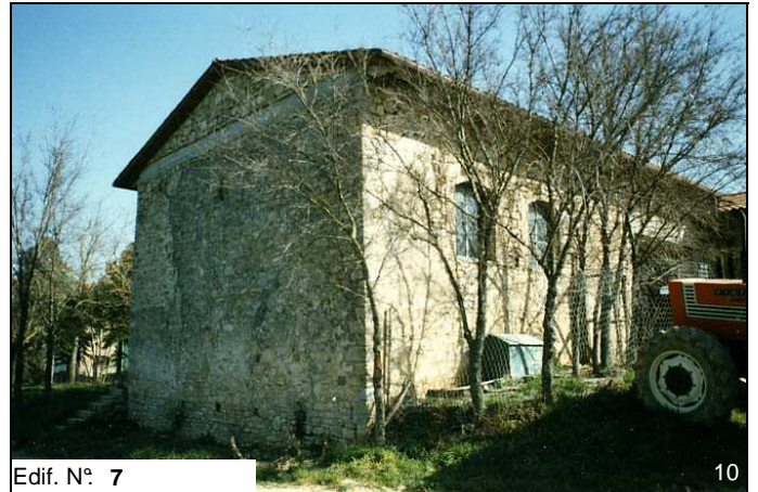
Edif. N° 7