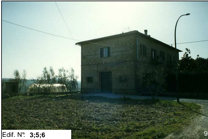
Edif. N° 3;5;6