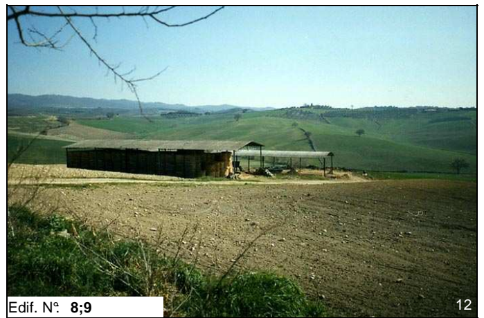
Edif. N° 8;9