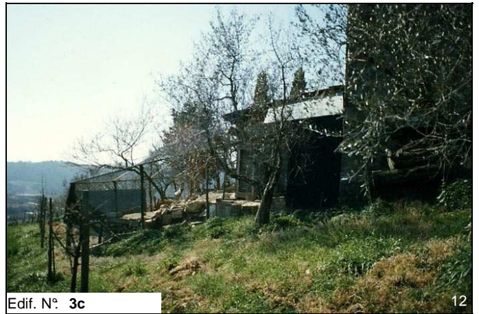
Edif. N° 3c