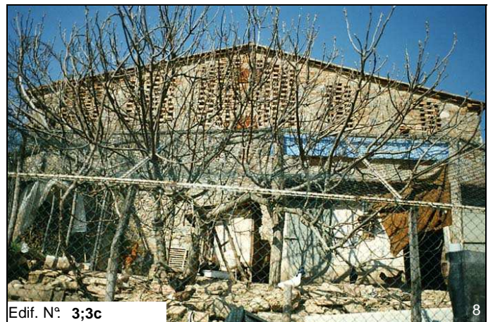
Edif. N° 3;3c