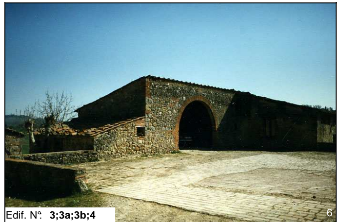
Edif. N° 3;3a;3b;4