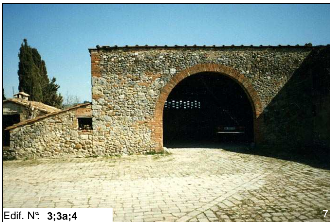
Edif. N° 3;3a;4