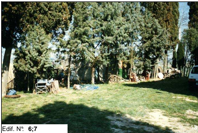
Edif. N° 6;7