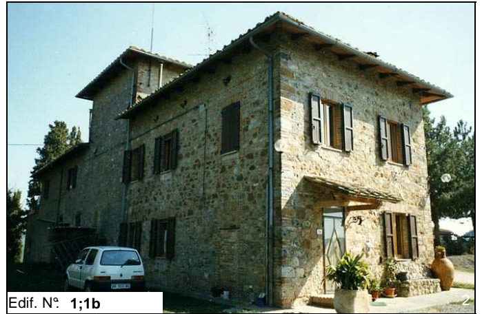
Edif. N° 1;1b