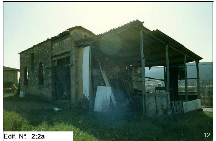
Edif. N° 2;2a