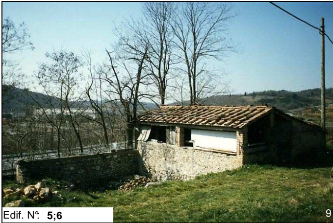
Edif. N° 5;6