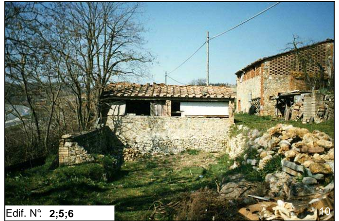
Edif. N° 2;5;6