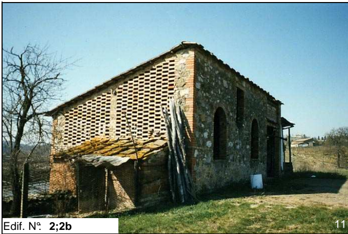
Edif. N° 2;2b