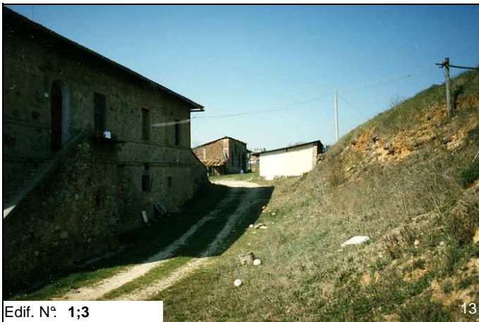
Edif. N° 1;3