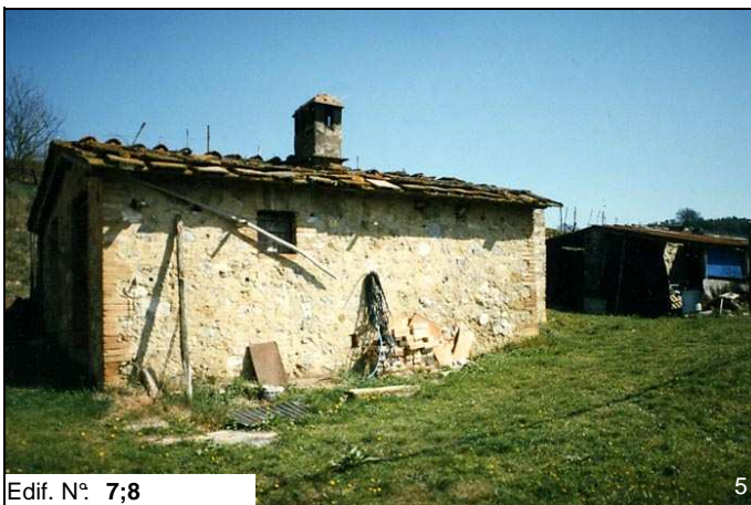
Edif. N° 7;8