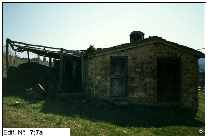
Edif. N° 7;7a