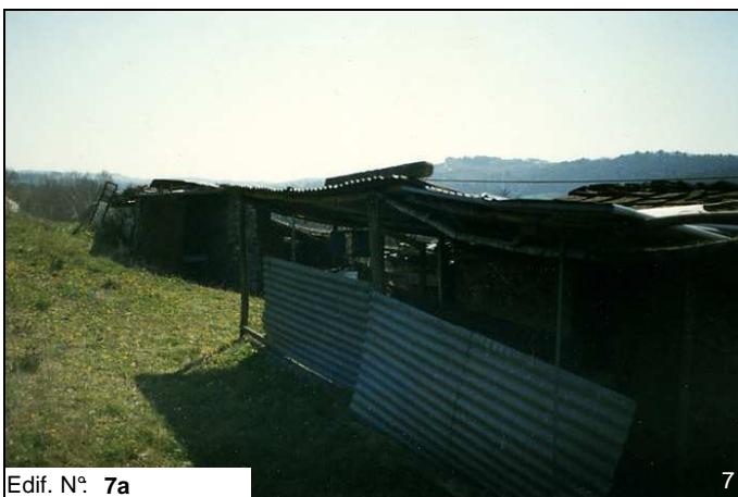
Edif. N° 7a