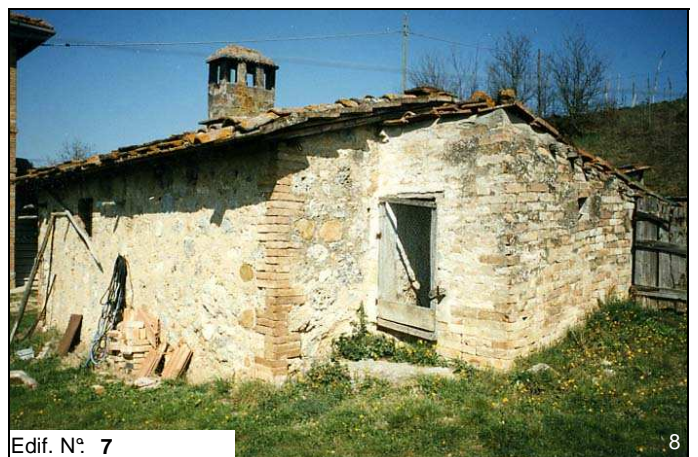
Edif. N° 7