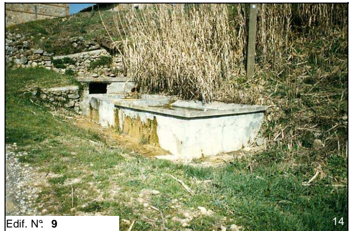
Edif. N° 9