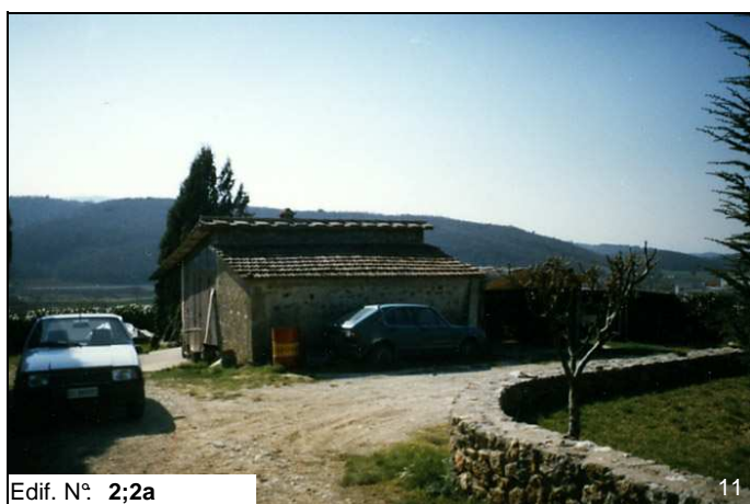
Edif. N° 2;2a