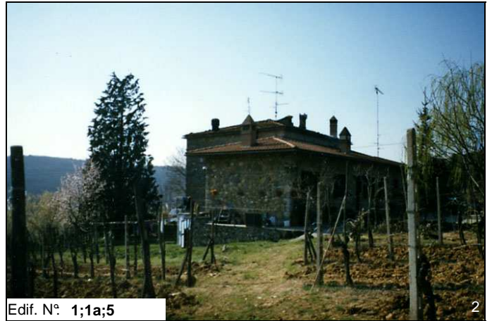
Edif. N° 1;1a;5