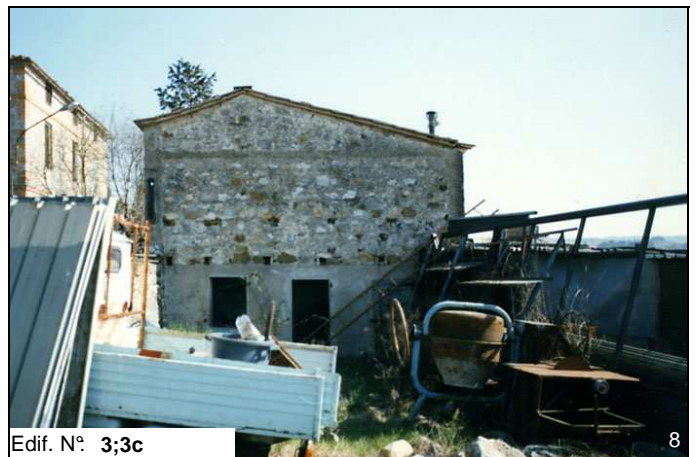
Edif. N° 3;3c