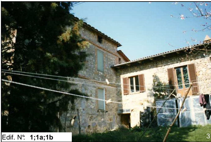
Edif. N° 1;1a;1b