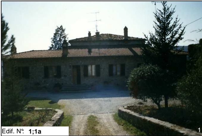
Edif. N° 1;1a