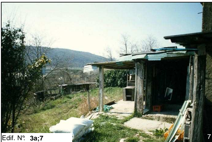
Edif. N° 3a;7