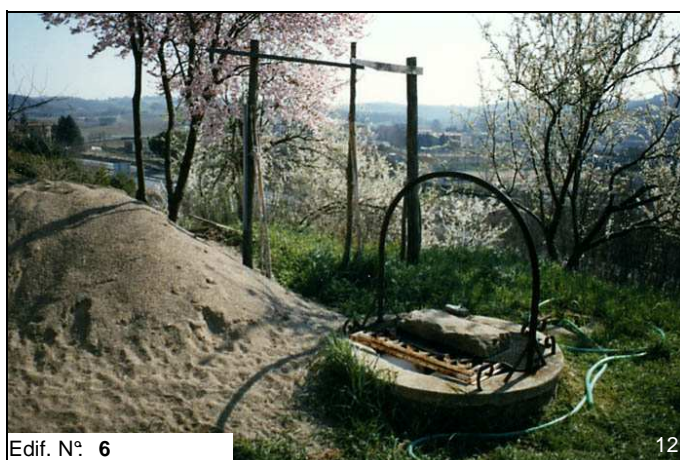
Edif. N° 6