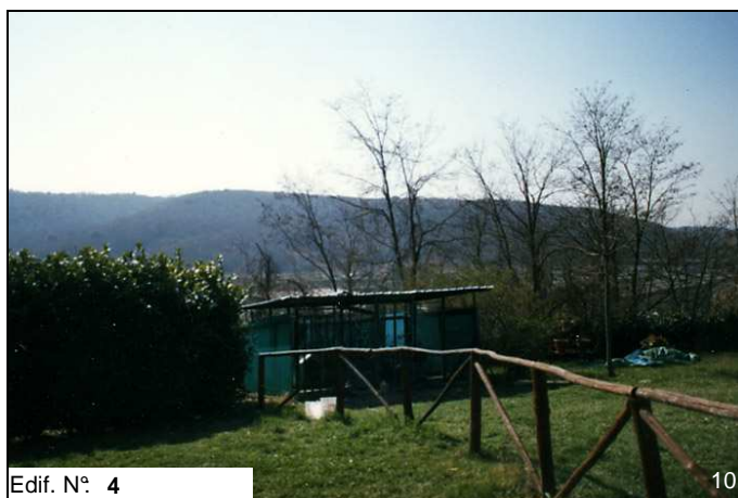
Edif. N° 4