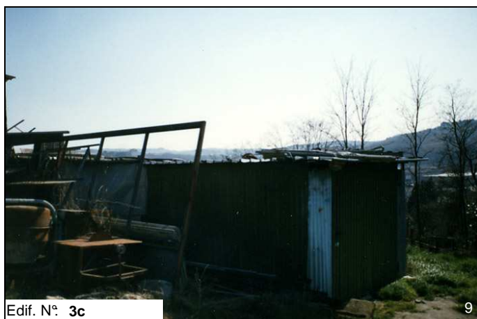
Edif. N° 3c