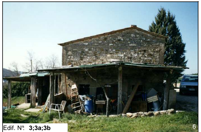
Edif. N° 3;3a;3b