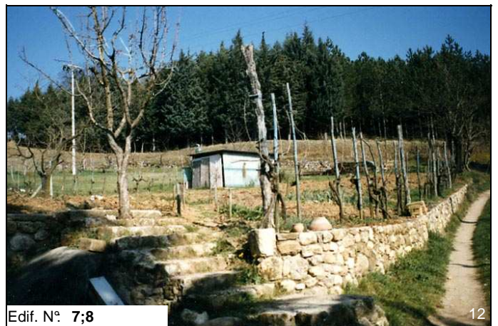
Edif. N° 7;8