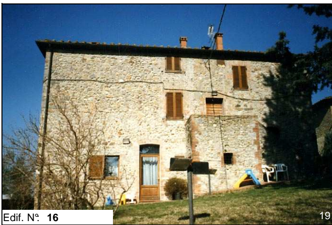
Edif. N° 16