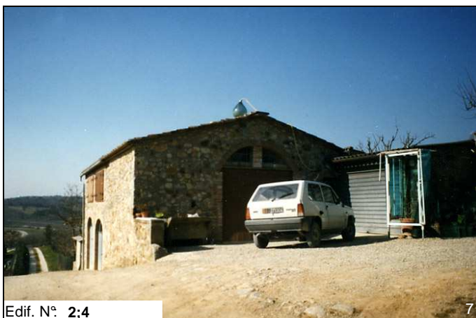
Edif. N° 2;4