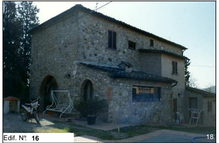
Edif. N° 16