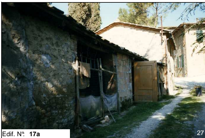
Edif. N° 17a