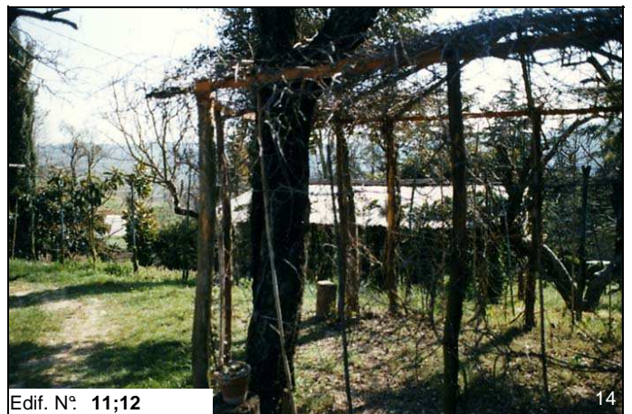
Edif. N° 11;12