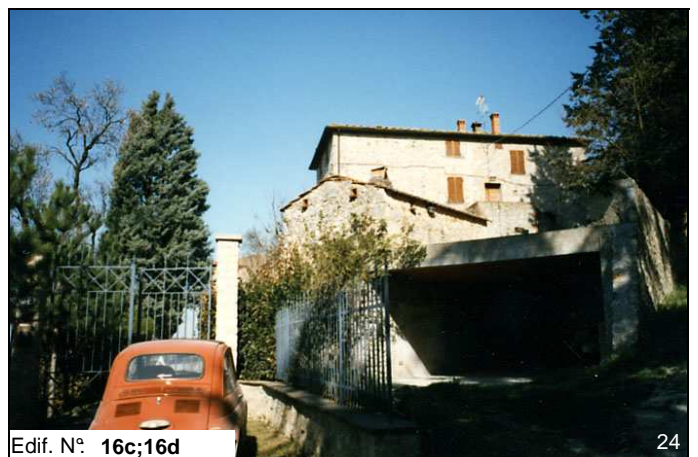
Edif. N° 16c;16d