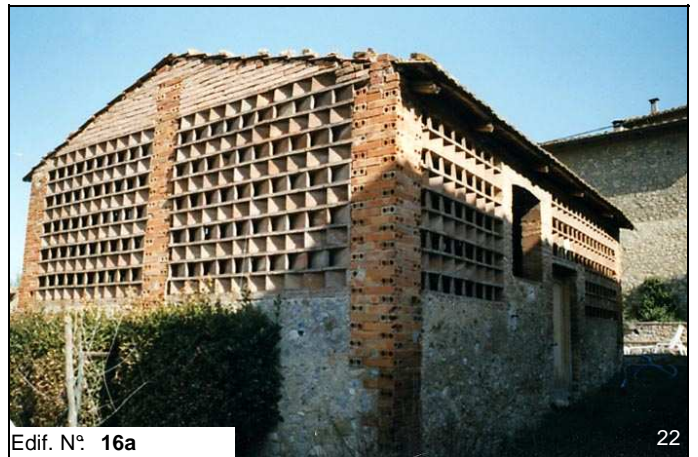
Edif. N° 16a