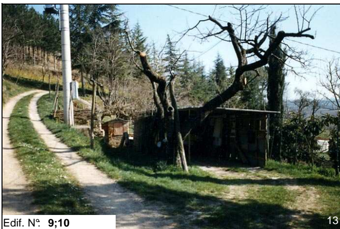
Edif. N° 9;10