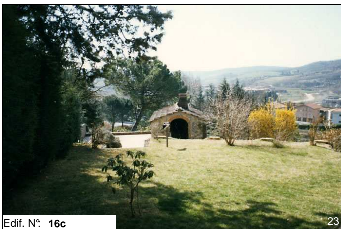
Edif. N° 16c