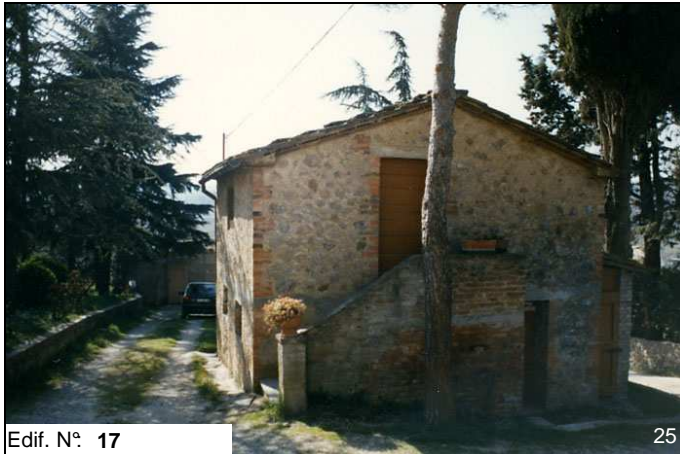
Edif. N° 17