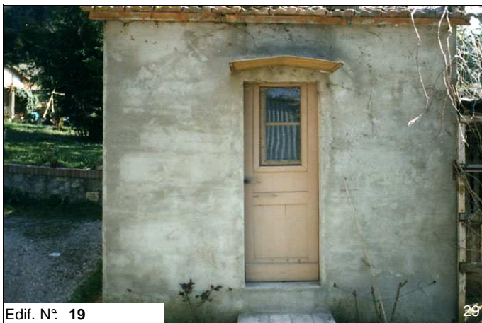
Edif. N° 19