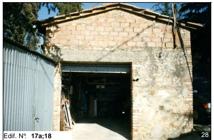
Edif. N° 17a;18