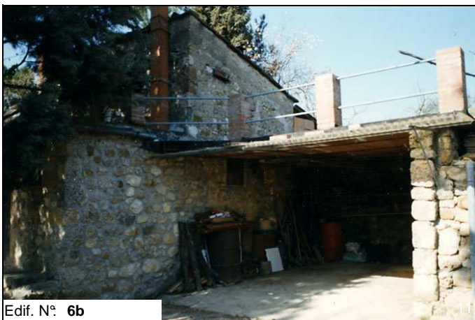
Edif. N° 6b