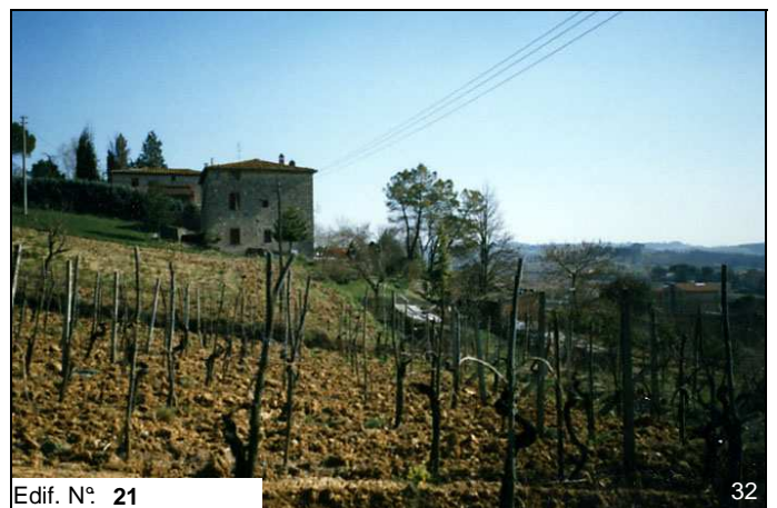
Edif. N° 21