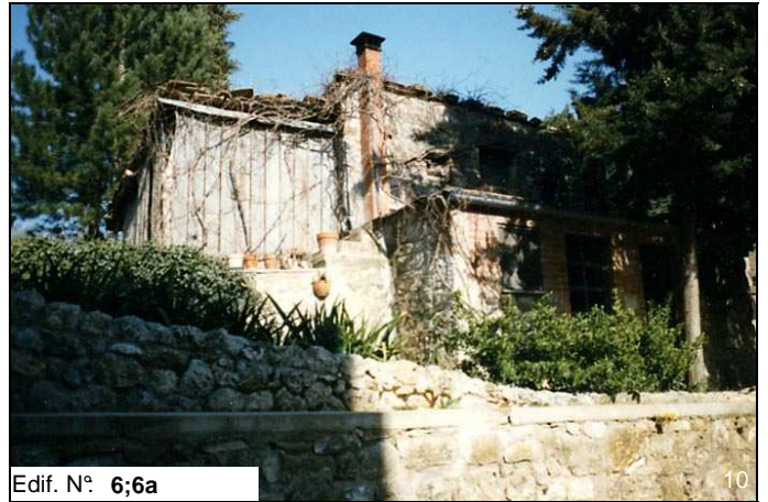
Edif. N° 6;6a