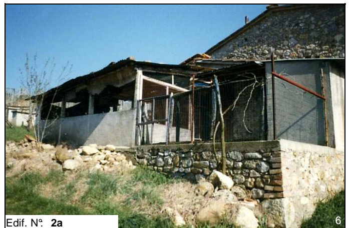
Edif. N° 2a