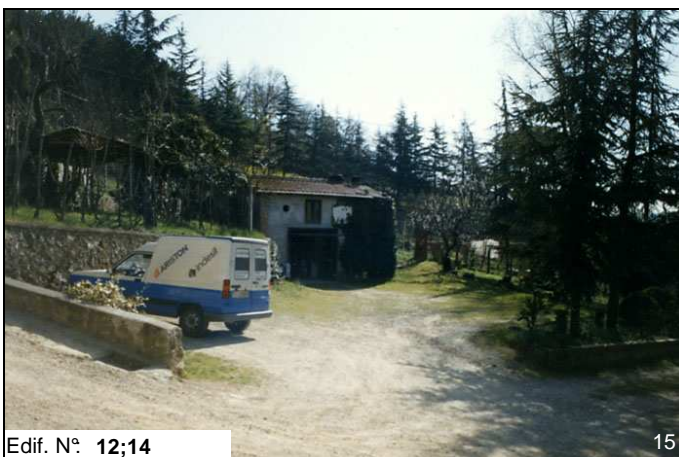
Edif. N° 12;14