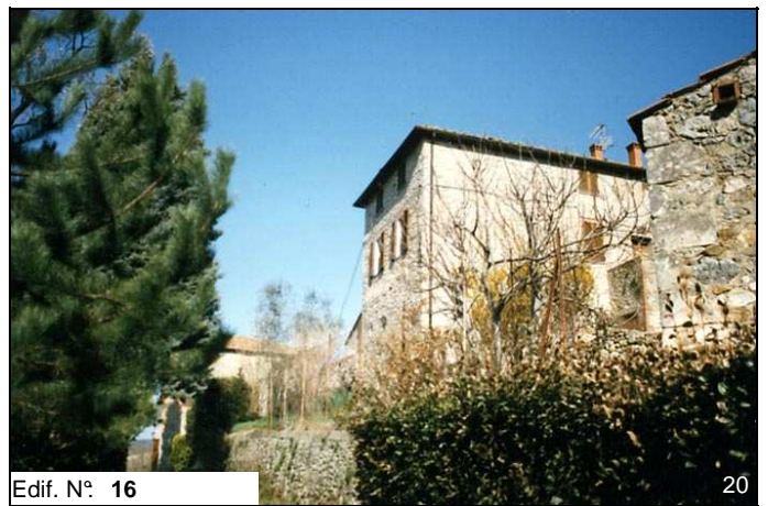
Edif. N° 16