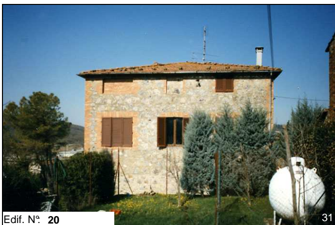
Edif. N° 20