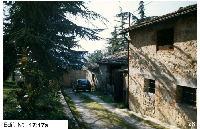
Edif. N° 17;17a