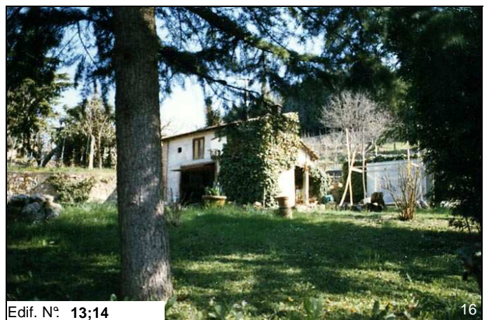
Edif. N° 13;14