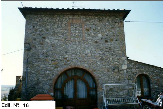
Edif. N° 16