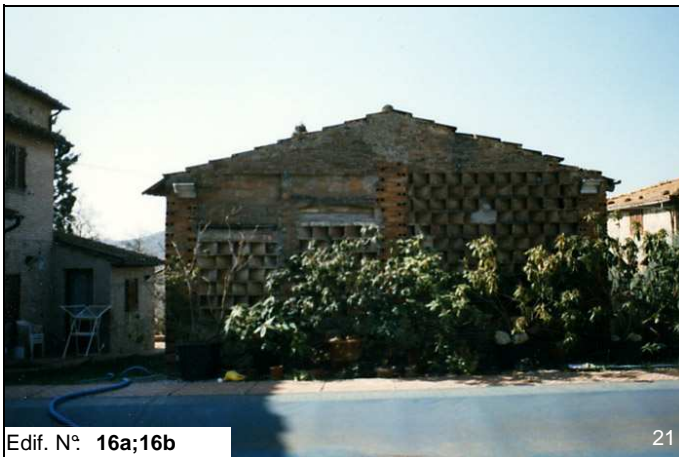
Edif. N° 16a;16b