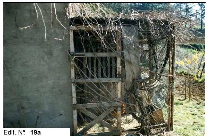
Edif. N° 19a