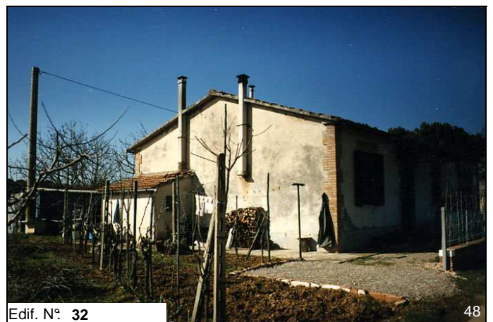
Edif. N° 32