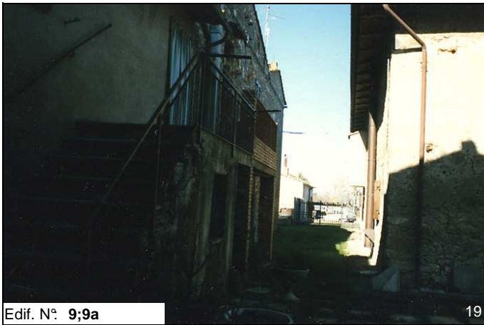
Edif. N° 9;9a