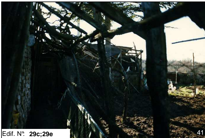
Edif. N° 29c;29e