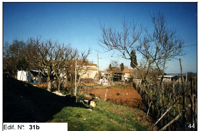
Edif. N° 31b