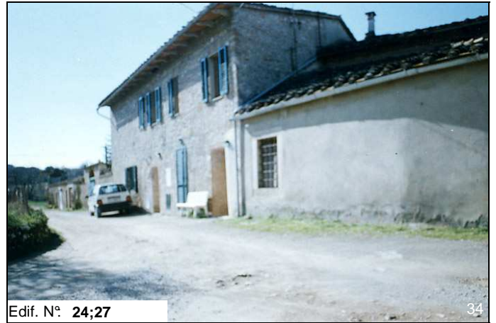
Edif. N° 24;27