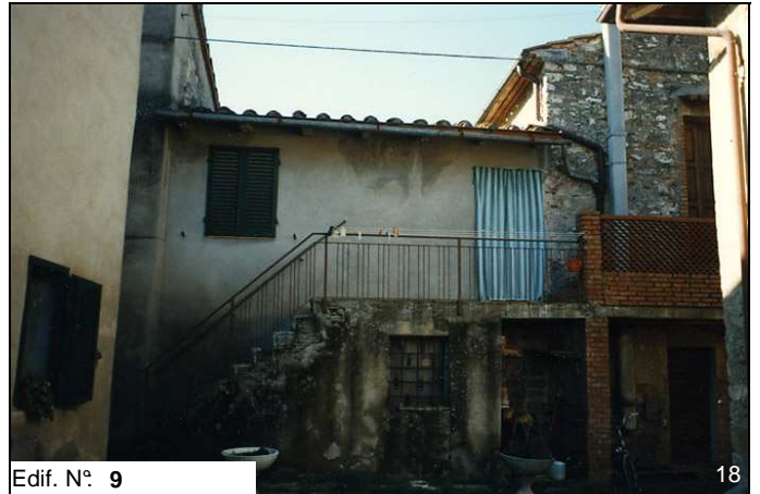
Edif. N° 9