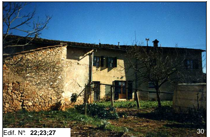
Edif. N° 22;23;27