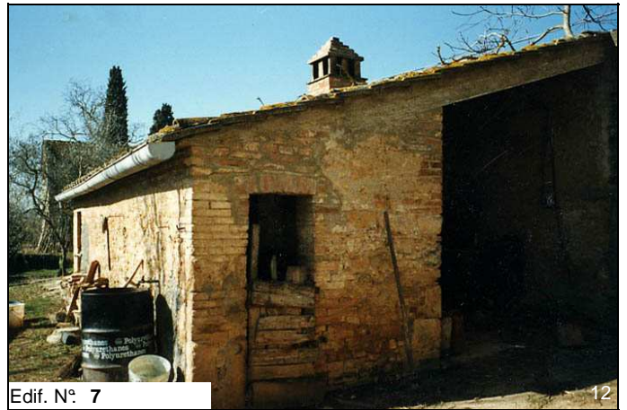
Edif. N° 7