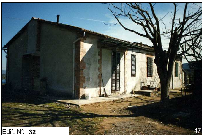
Edif. N° 32