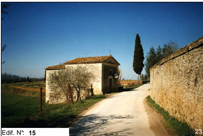
Edif. N° 15