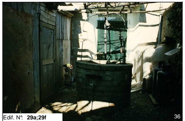
Edif. N° 29a;29f