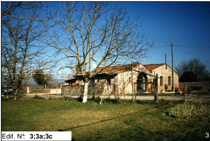
Edif. N° 3;3a;3c