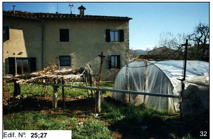
Edif. N° 25;27