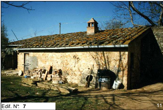
Edif. N° 7