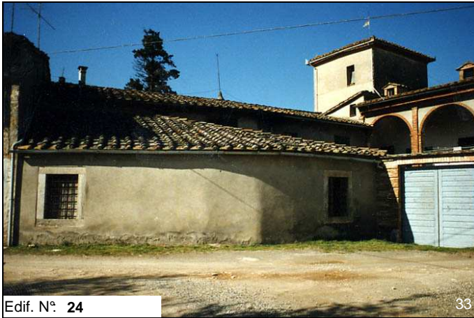
Edif. N° 24