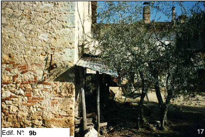
Edif. N° 9b