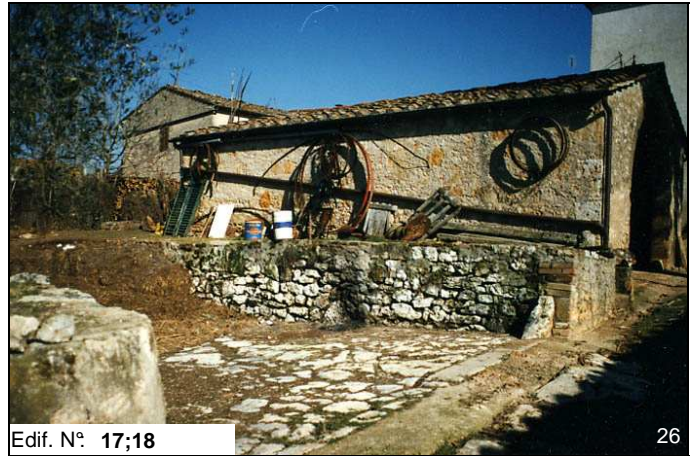
Edif. N° 17;18