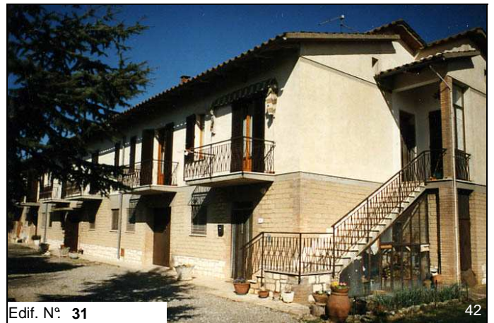
Edif. N° 31