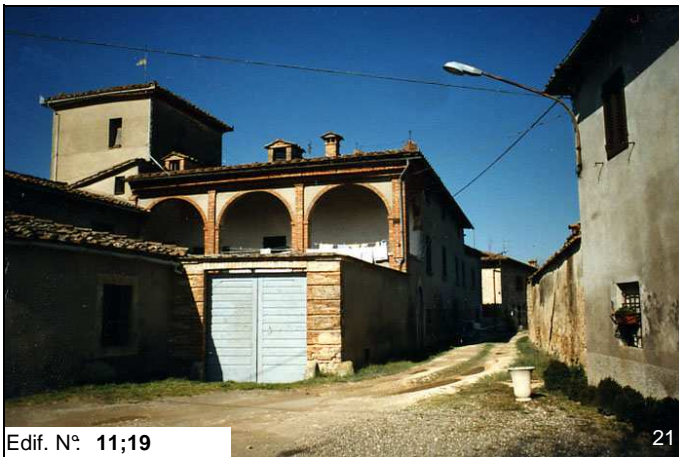
Edif. N° 11;19