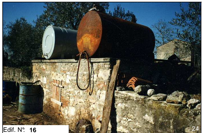
Edif. N° 16