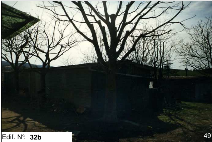
Edif. N° 32b