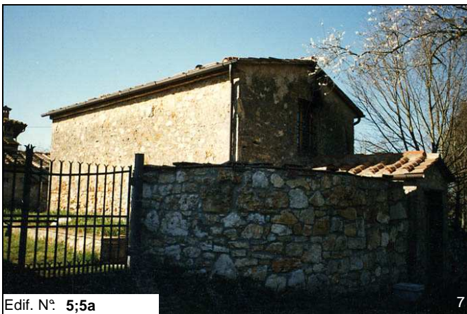
Edif. N° 5;5a