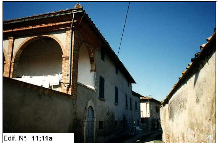
Edif. N° 11;11a