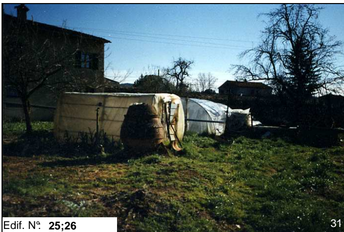
Edif. N° 25;26