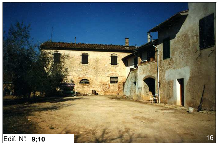
Edif. N° 9;10