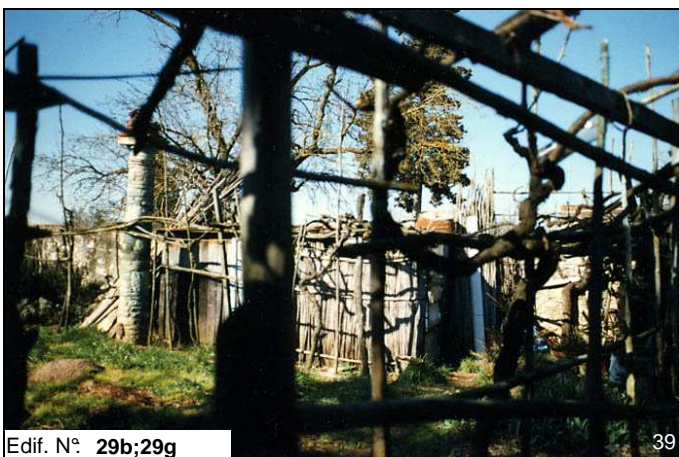
Edif. N° 29b;29g