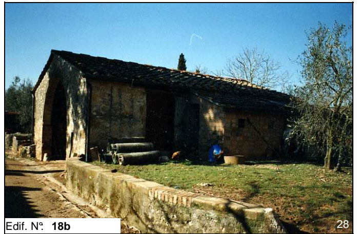
Edif. N° 18b