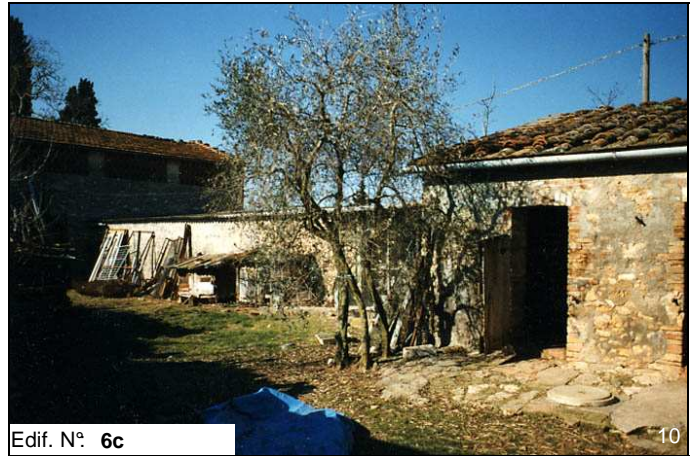
Edif. N° 6c