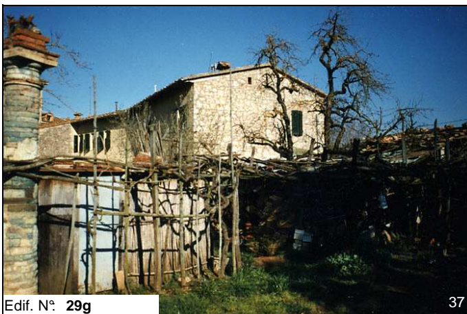
Edif. N° 29g