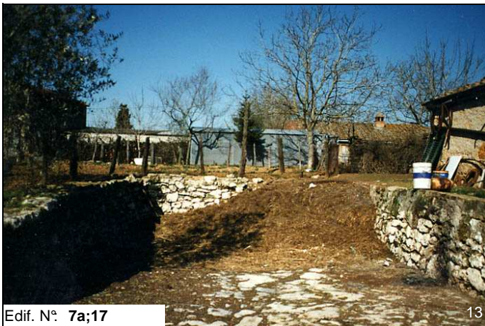
Edif. N° 7a;17