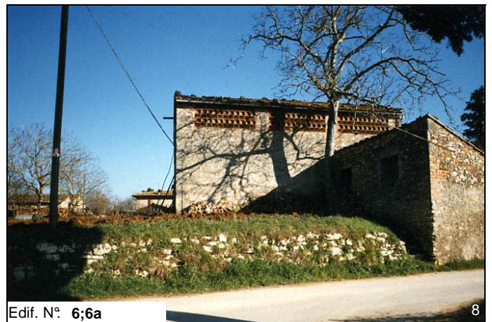
Edif. N° 6;6a