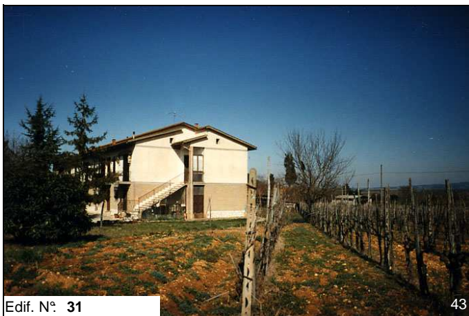
Edif. N° 31