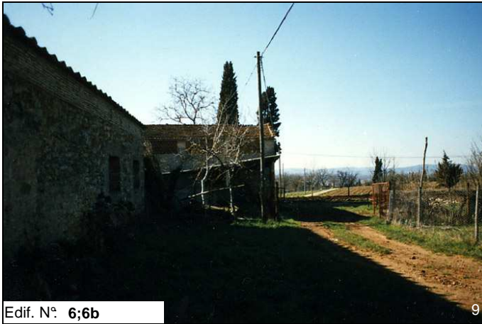
Edif. N° 6;6b