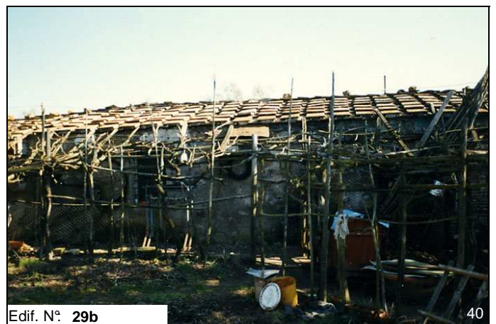
Edif. N° 29b