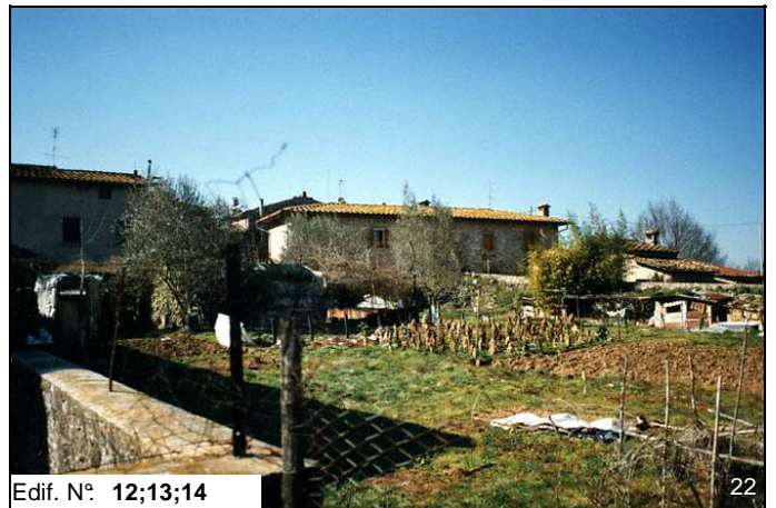
Edif. N° 12;13;14