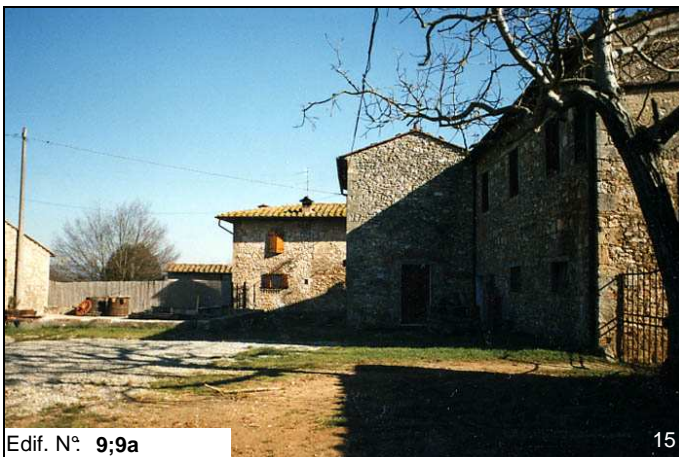
Edif. N° 9;9a