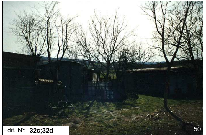
Edif. N° 32c;32d