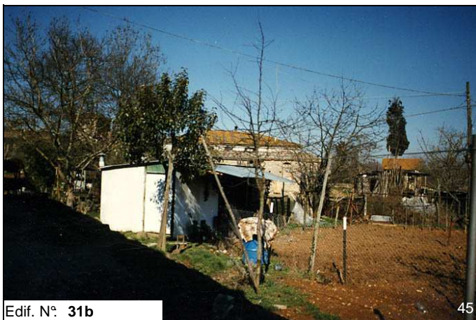
Edif. N° 31b