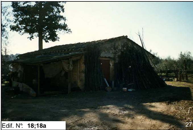
Edif. N° 18;18a