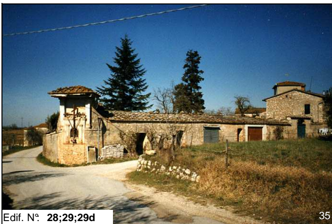
Edif. N° 28;29;29d