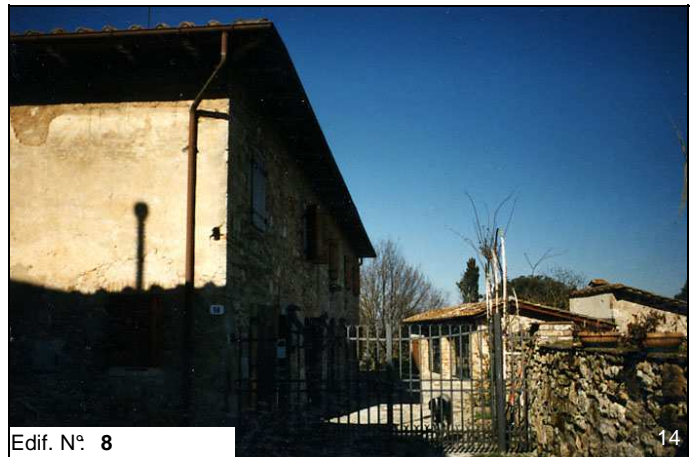
Edif. N° 8