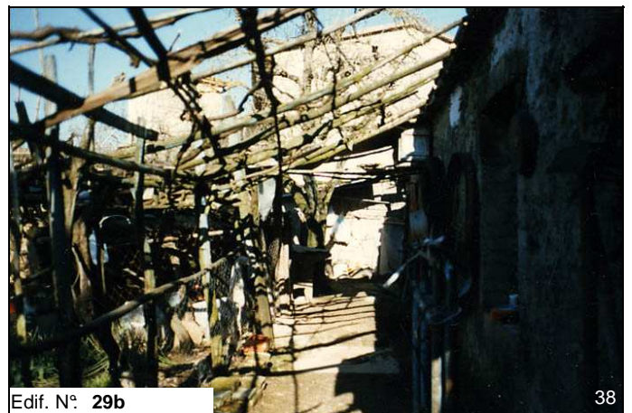
Edif. N° 29b