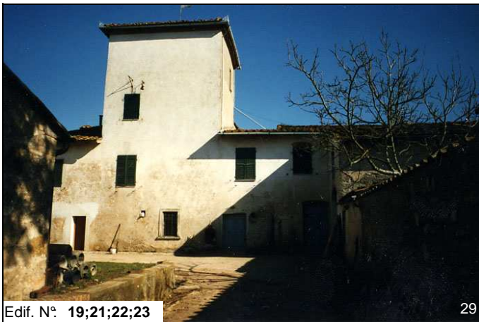
Edif. N° 19;21;22;23