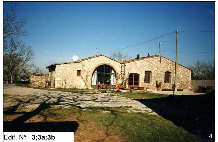
Edif. N° 3;3a;3b