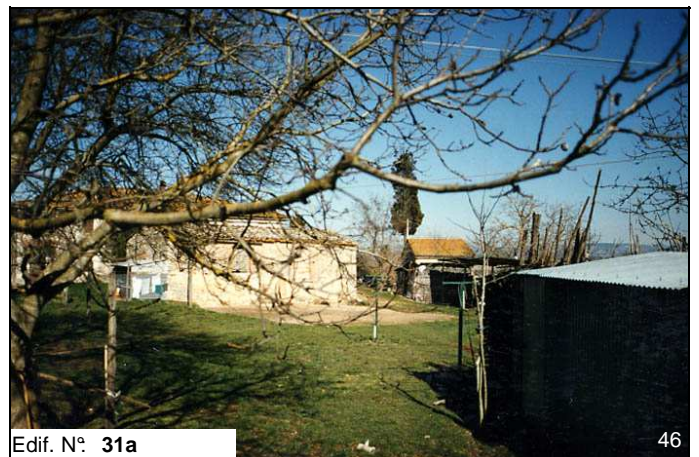
Edif. N° 31a