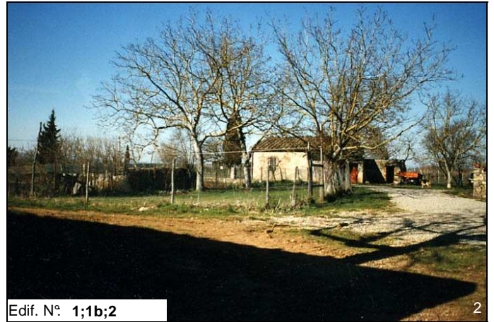
Edif. N° 1;1b;2