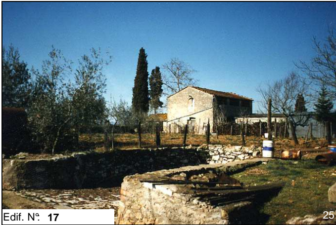
Edif. N° 17