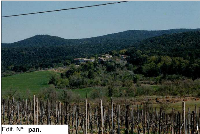
Edif. N° pan.