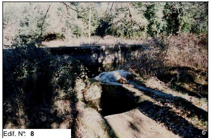
Edif. N° 8