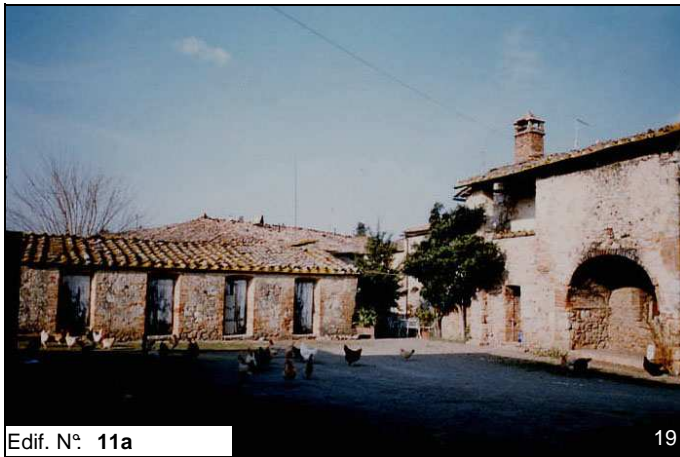
Edif. N° 11a