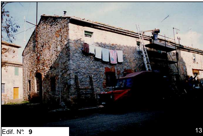
Edif. N° 9