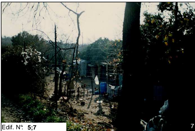
Edif. N° 5;7