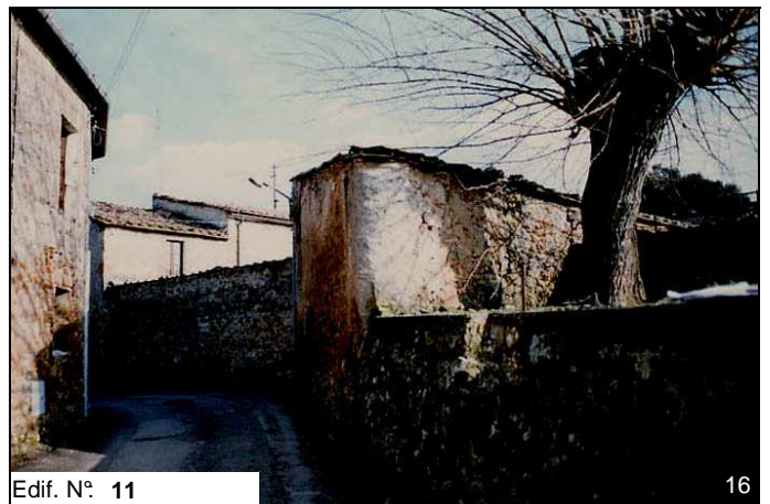
Edif. N° 11