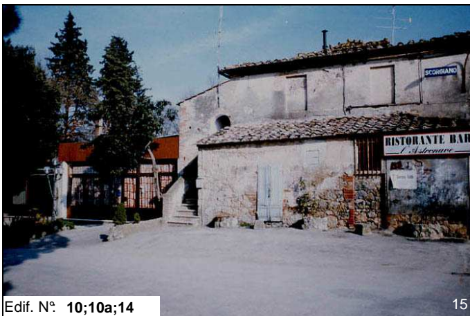
Edif. N° 10;10a;14