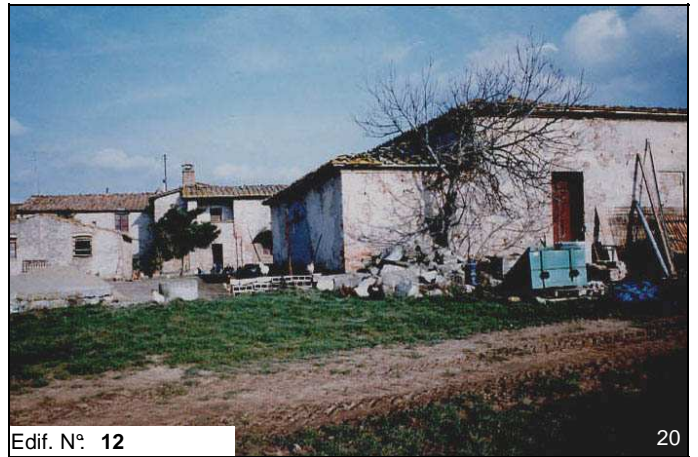
Edif. N° 12