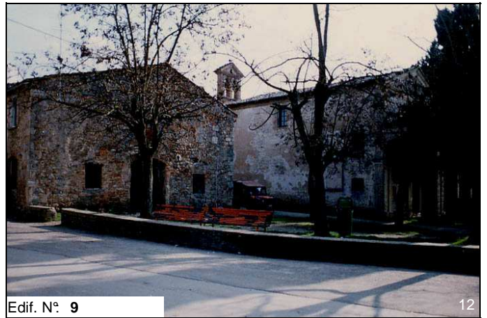
Edif. N° 9