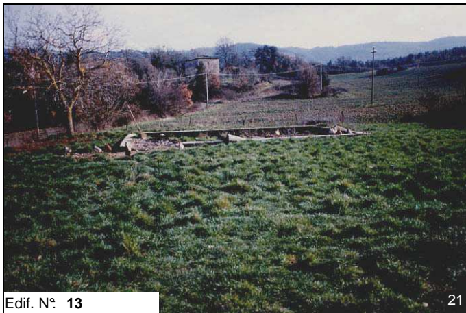
Edif. N° 13