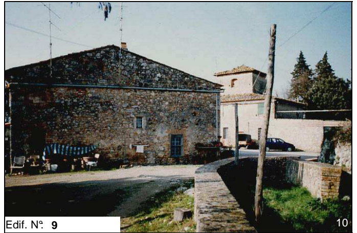
Edif. N° 9