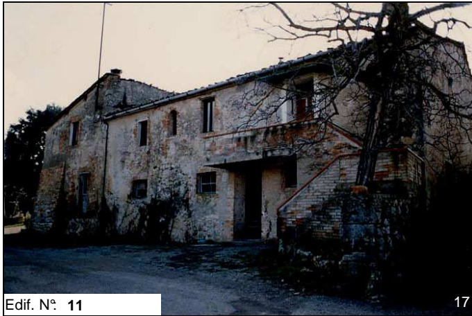
Edif. N° 11