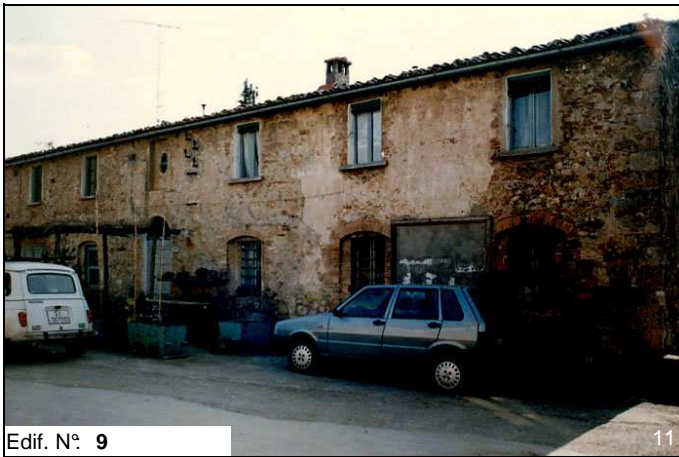
Edif. N° 9