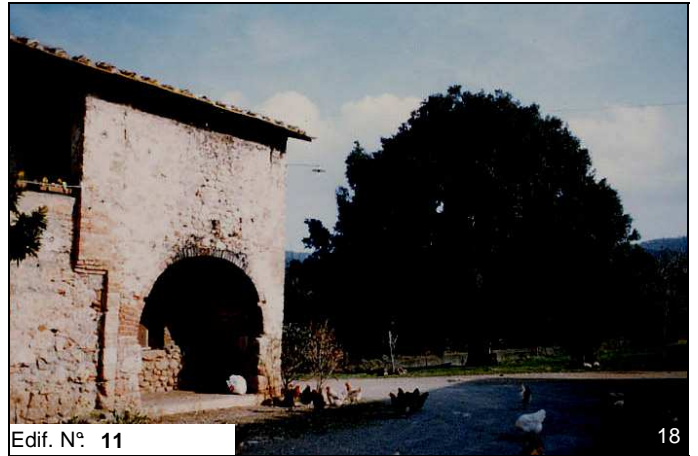
Edif. N° 11