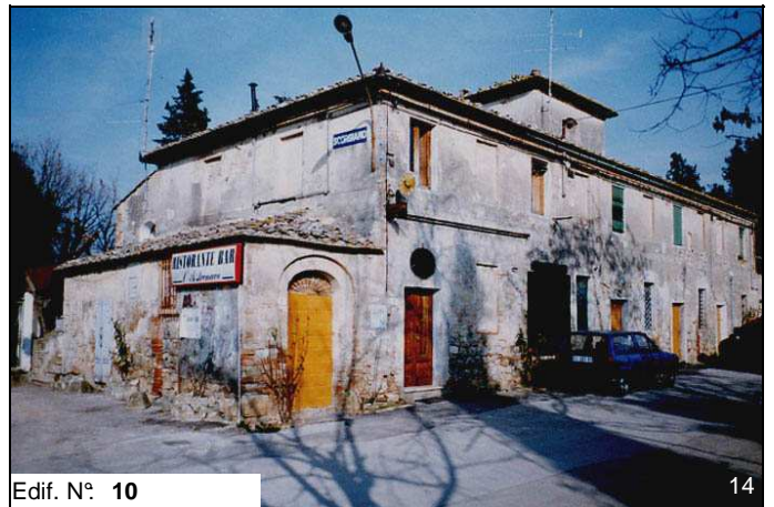
Edif. N° 10