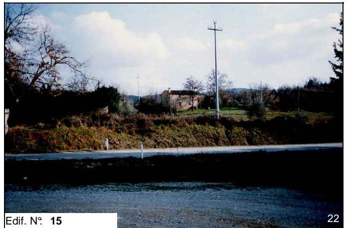
Edif. N° 15