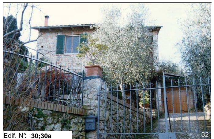
Edif. N° 30;30a