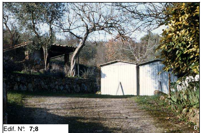
Edif. N° 7;8