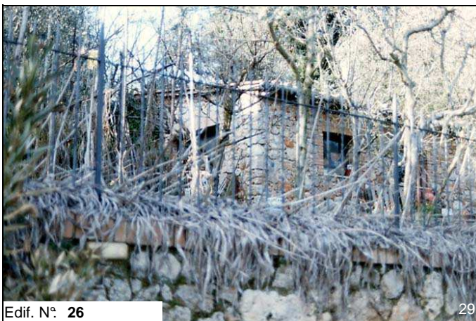
Edif. N° 26