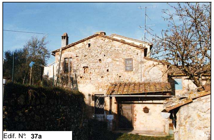
Edif. N° 37a