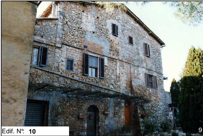
Edif. N° 10