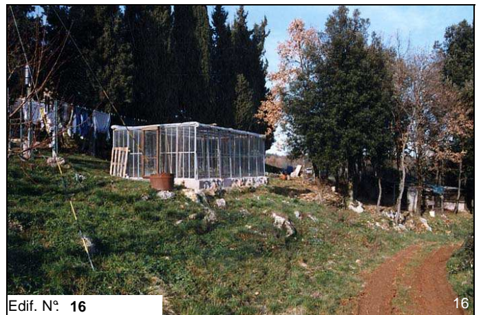
Edif. N° 16