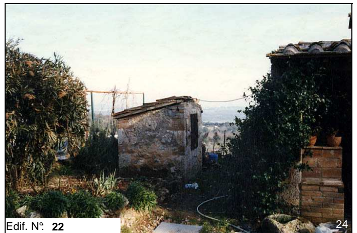
Edif. N° 22