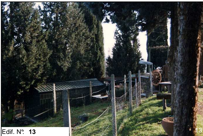
Edif. N° 13