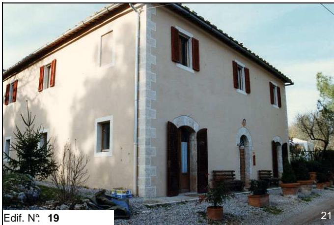
Edif. N° 19