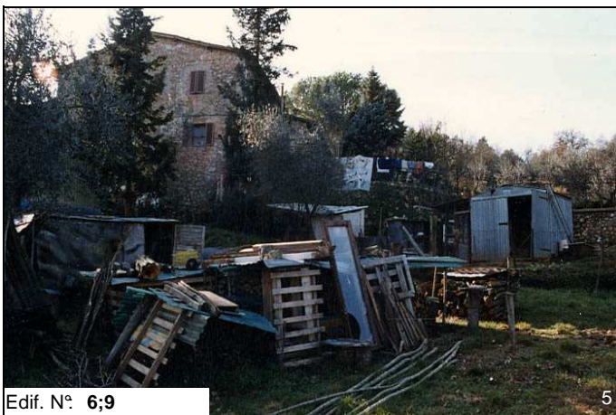
Edif. N° 6;9