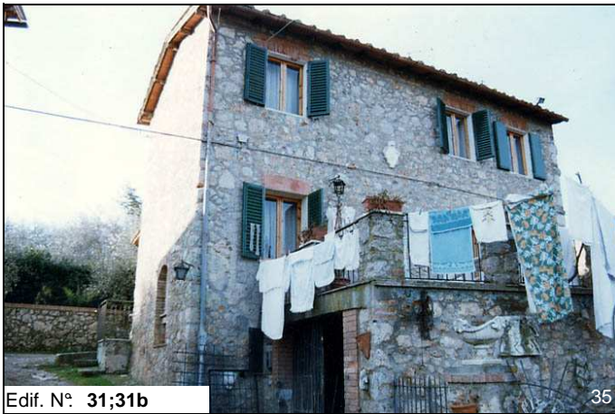
Edif. N° 31;31b