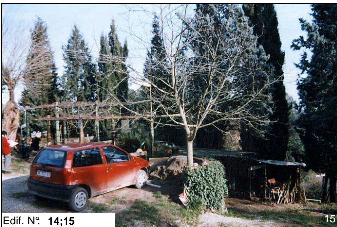
Edif. N° 14;15