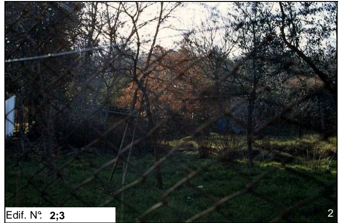
Edif. N° 2;3