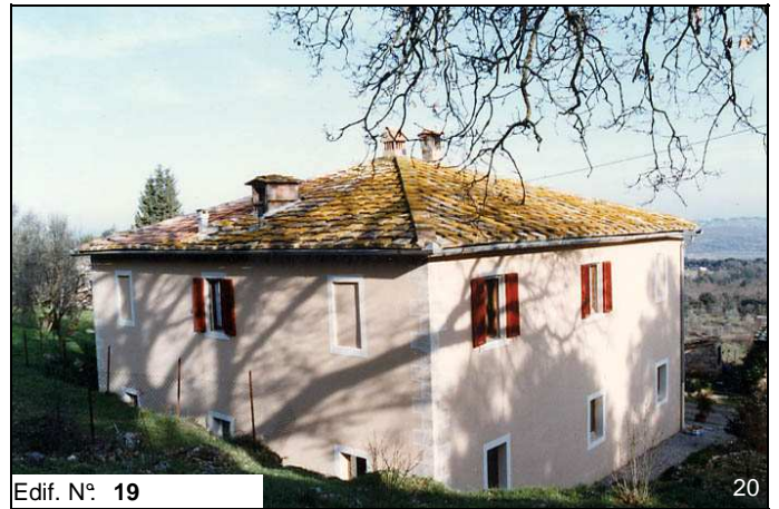
Edif. N° 19