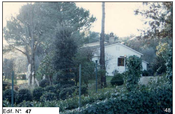
Edif. N° 47