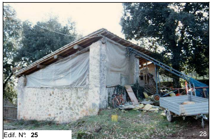
Edif. N° 25