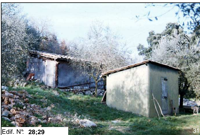
Edif. N° 28;29