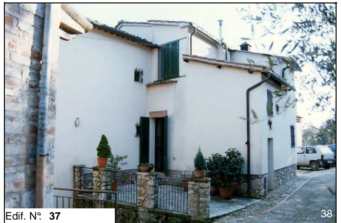
Edif. N° 37