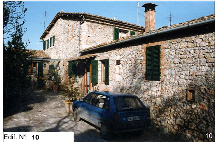
Edif. N° 10