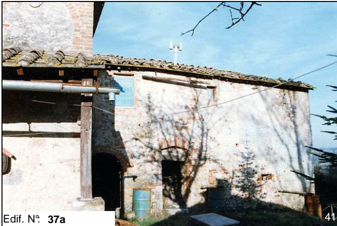
Edif. N° 37a