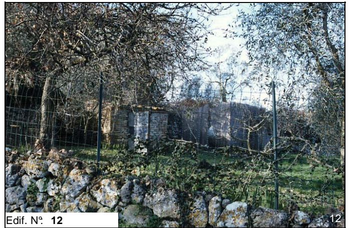
Edif. N° 12