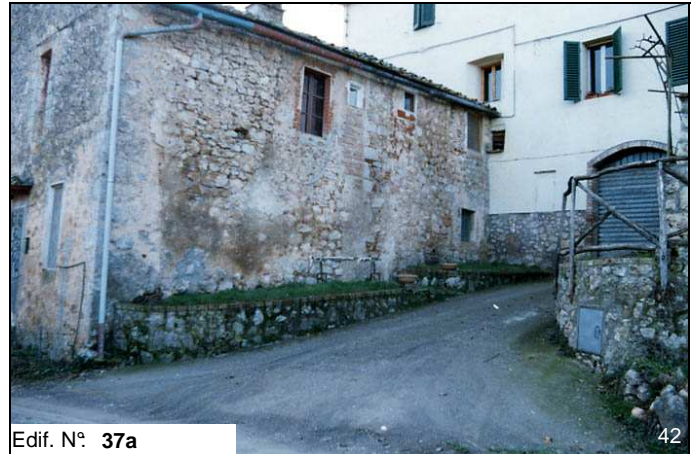
Edif. N° 37a