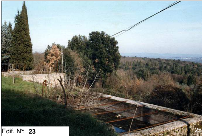
Edif. N° 23