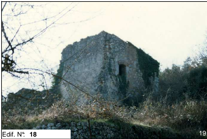
Edif. N° 18