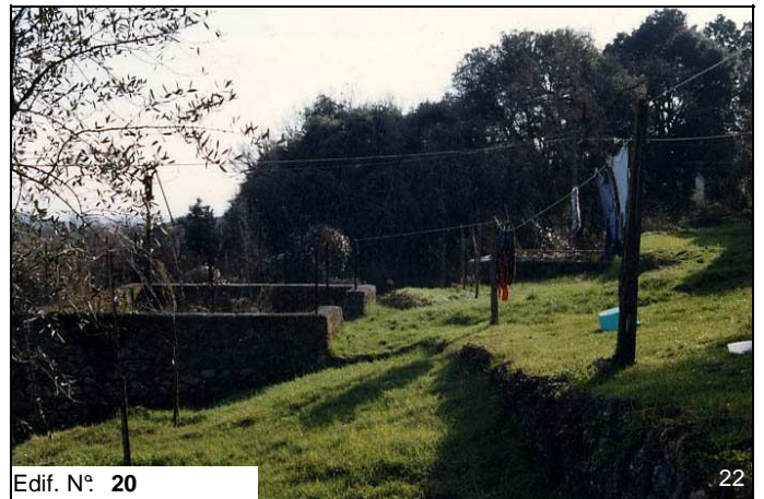
Edif. N° 20