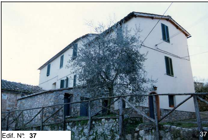
Edif. N° 37