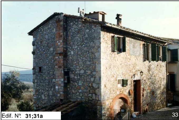
Edif. N° 31;31a