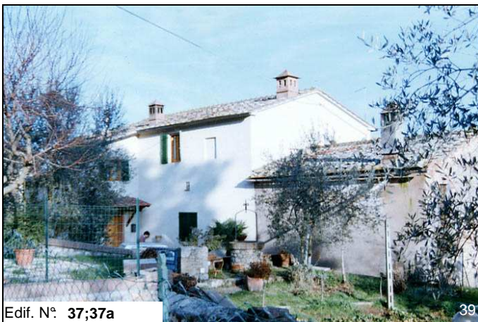
Edif. N° 37;37a