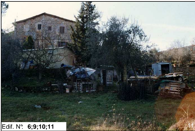
Edif. N° 6;9;10;11