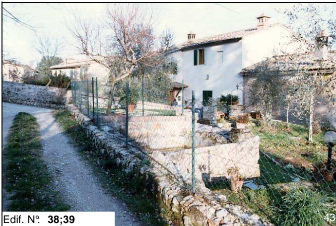
Edif. N° 38;39