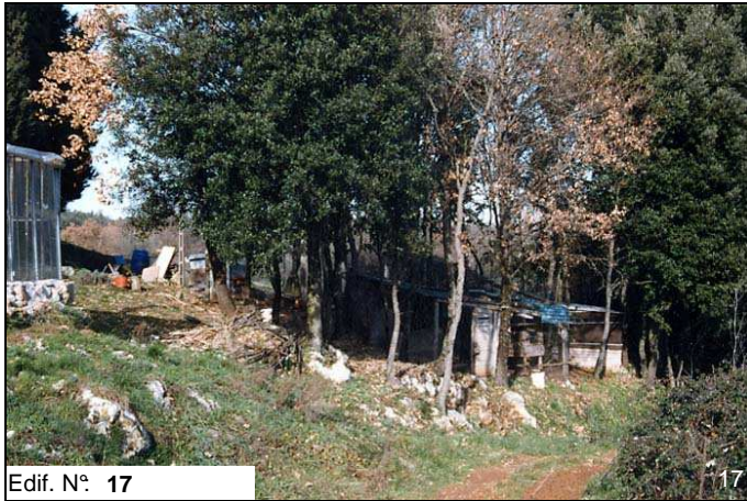
Edif. N° 17