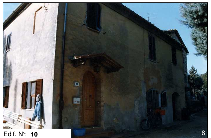
Edif. N° 10