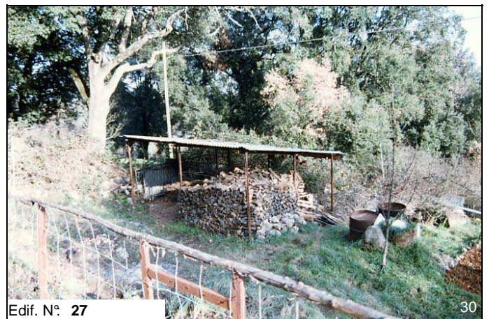
Edif. N° 27