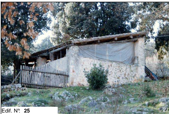
Edif. N° 25