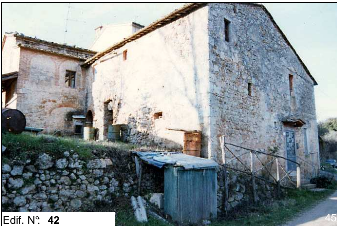
Edif. N° 42