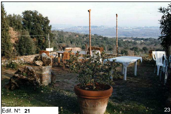
Edif. N° 21