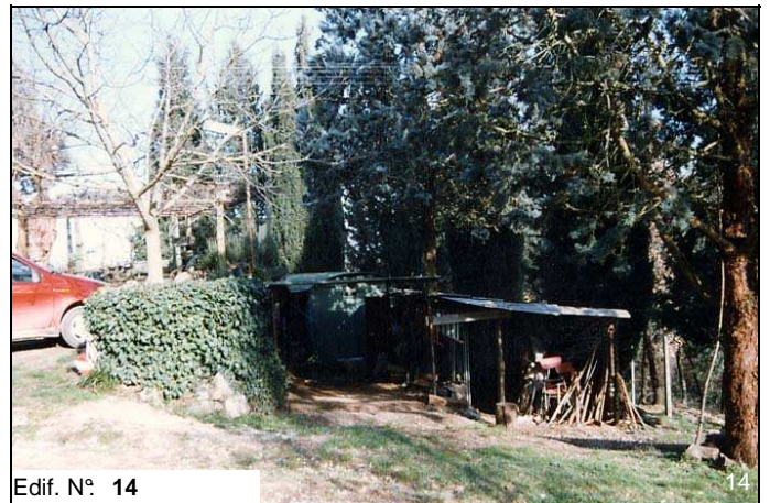
Edif. N° 14