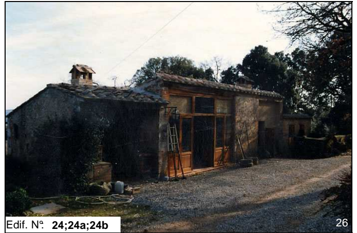
Edif. N° 24;24a;24b