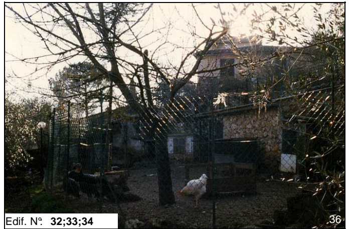
Edif. N° 32;33;34