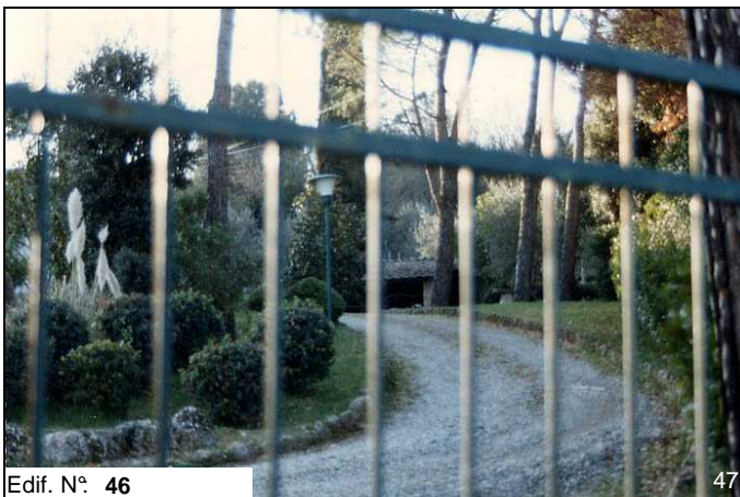
Edif. N° 46