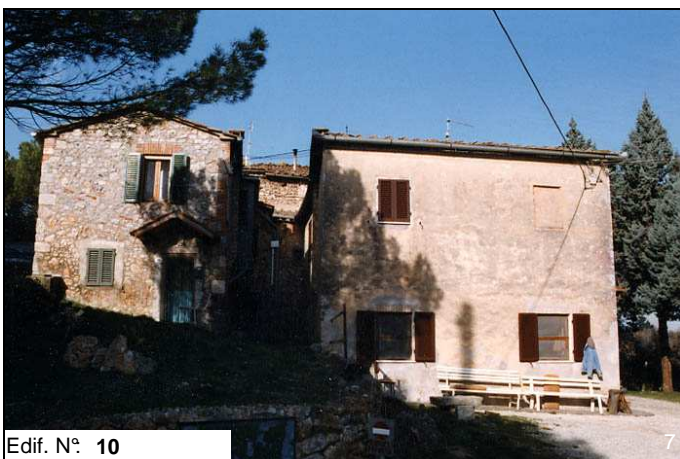
Edif. N° 10