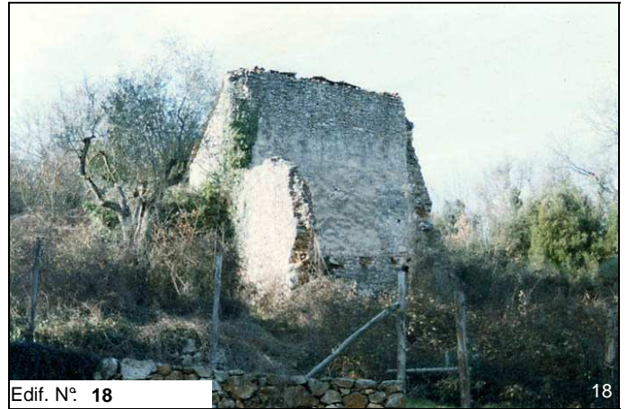
Edif. N° 18