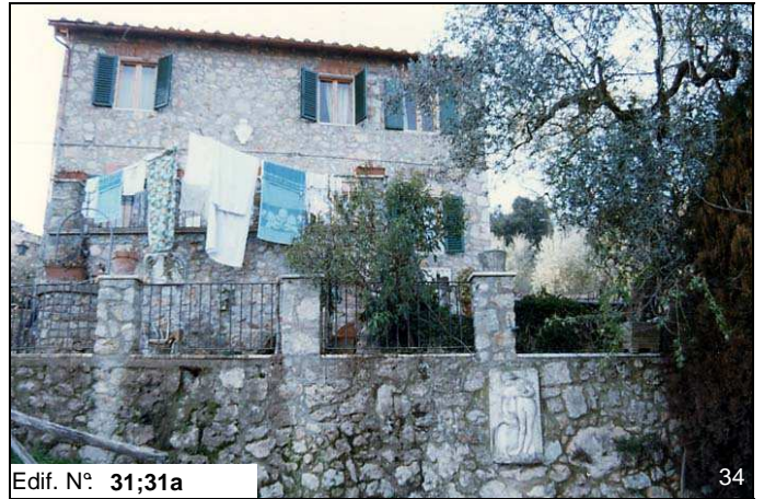
Edif. N° 31;31a