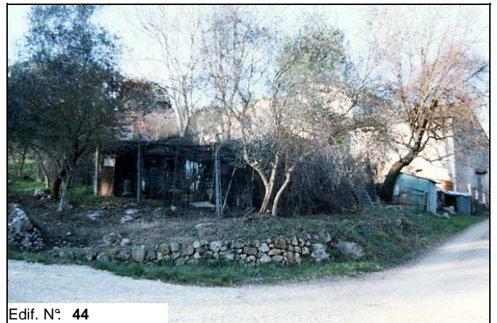
Edif. N° 44