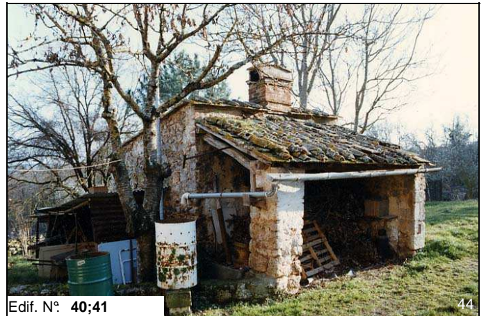
Edif. N° 40;41