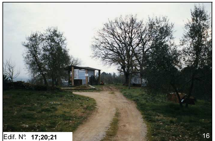
Edif. N° 17;20;21