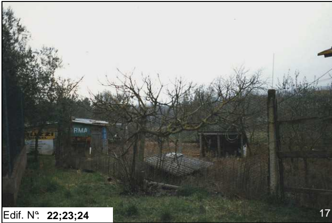
Edif. N° 22;23;24