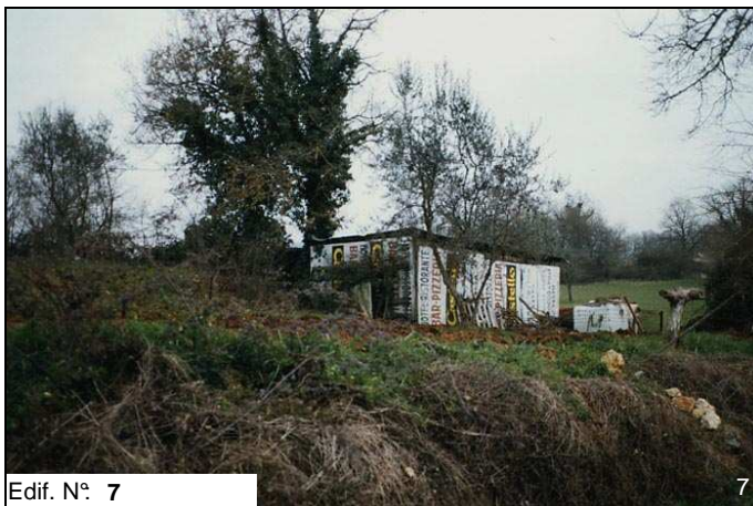
Edif. N° 7