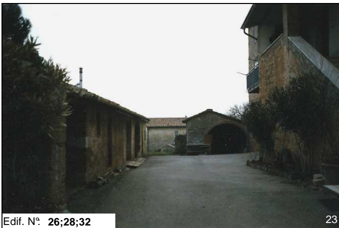
Edif. N° 26;28;32