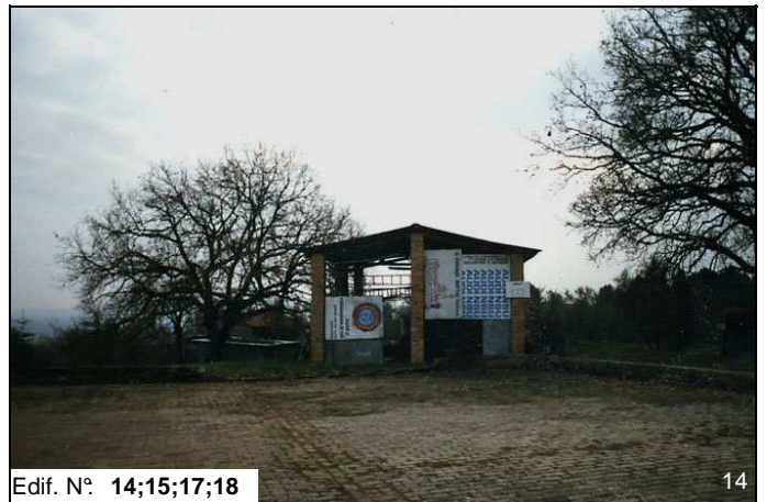
Edif. N° 14;15;17;18