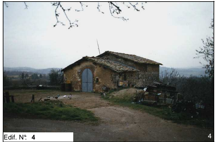
Edif. N° 4