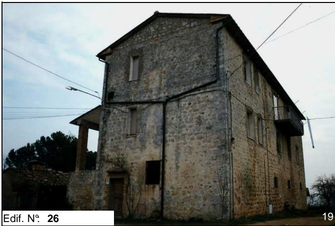
Edif. N° 26