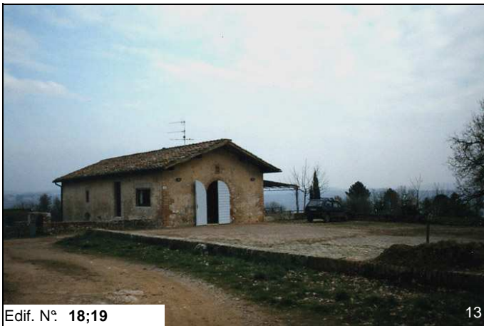
Edif. N° 18;19