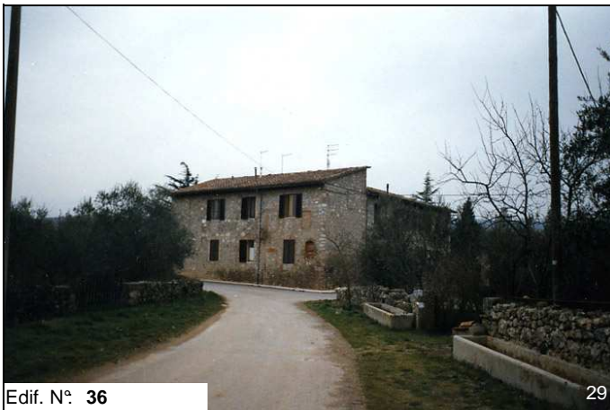
Edif. N° 36