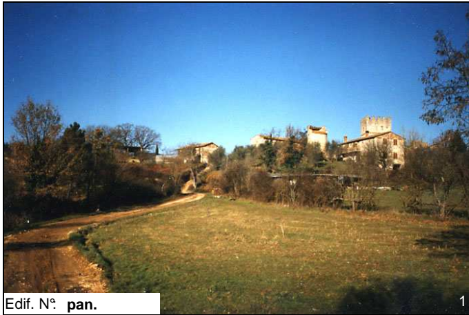
Edif. N° pan.