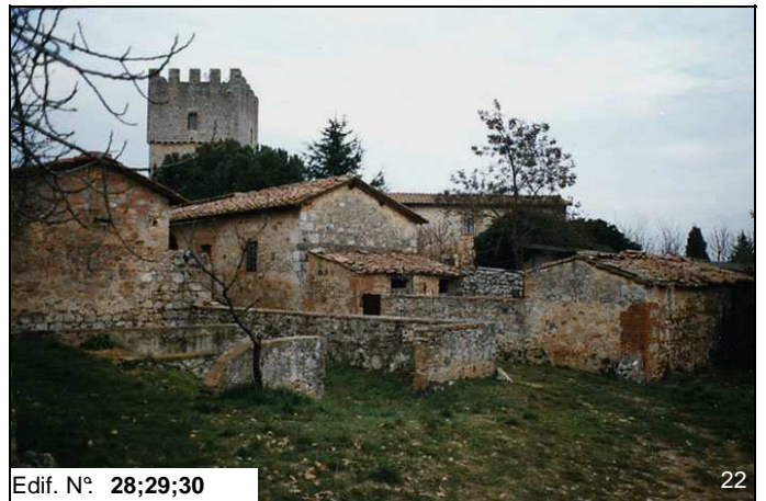
Edif. N° 28;29;30