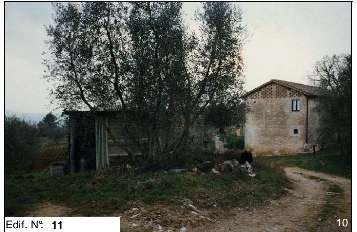
Edif. N° 11