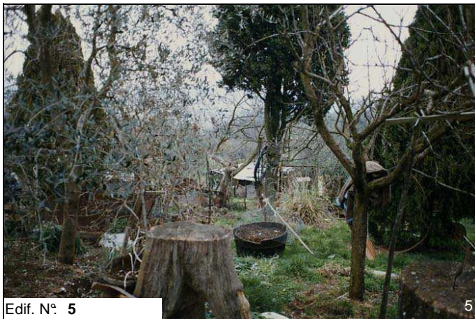
Edif. N° 5