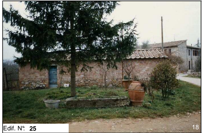
Edif. N° 25