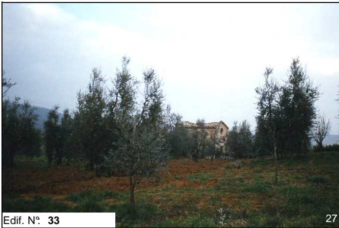
Edif. N° 33