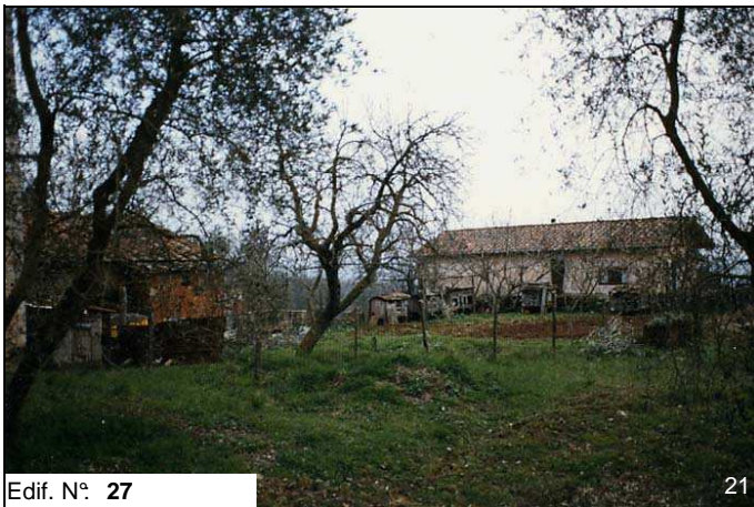
Edif. N° 27