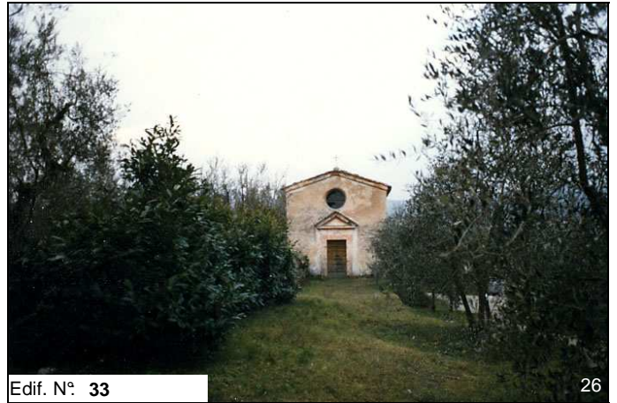
Edif. N° 33