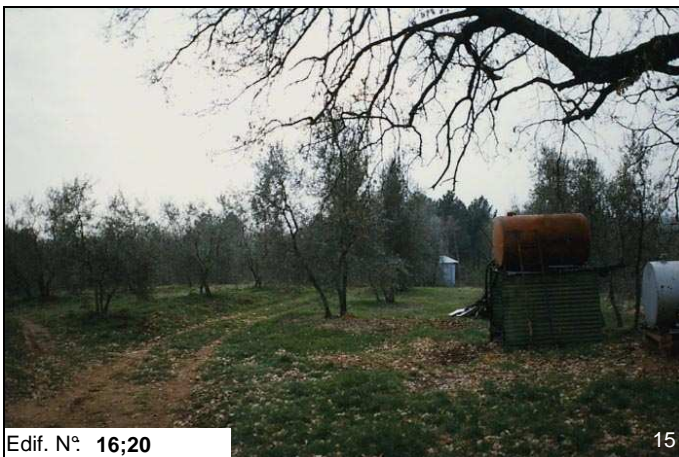
Edif. N° 16;20