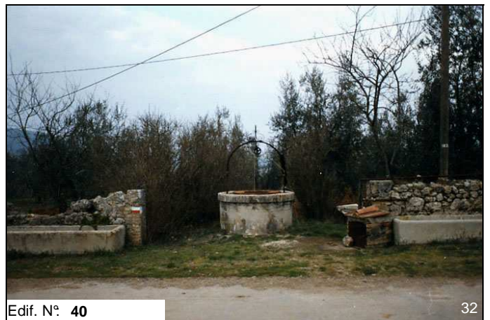
Edif. N° 40