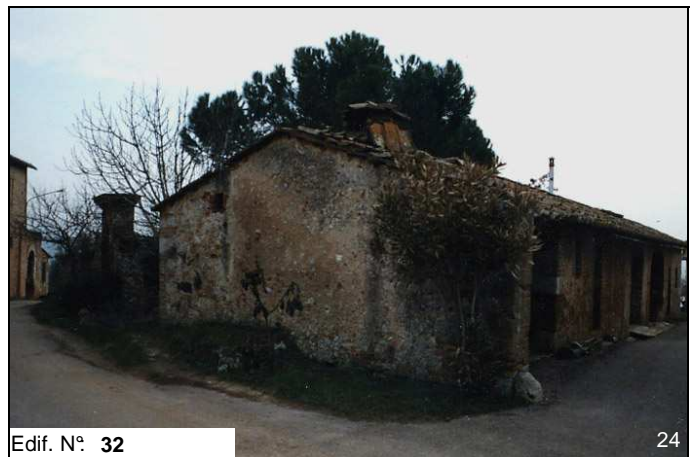
Edif. N° 32