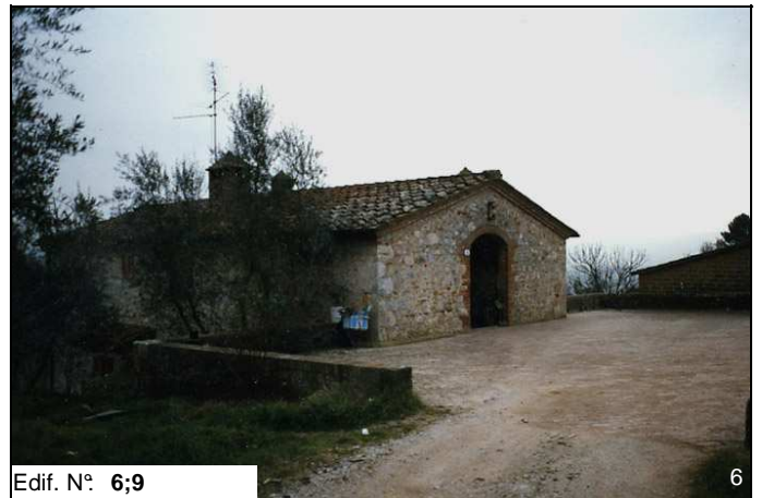
Edif. N° 6;9