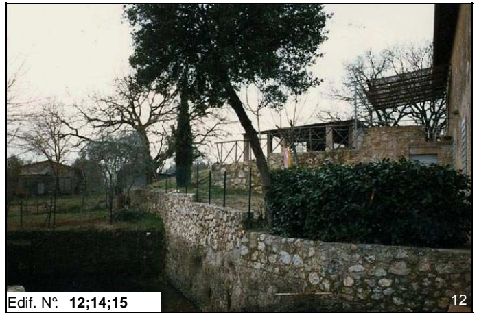
Edif. N° 12;14;15