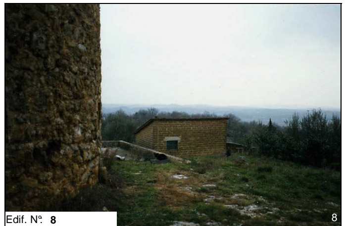
Edif. N° 8