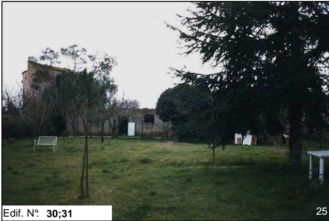
Edif. N° 30;31