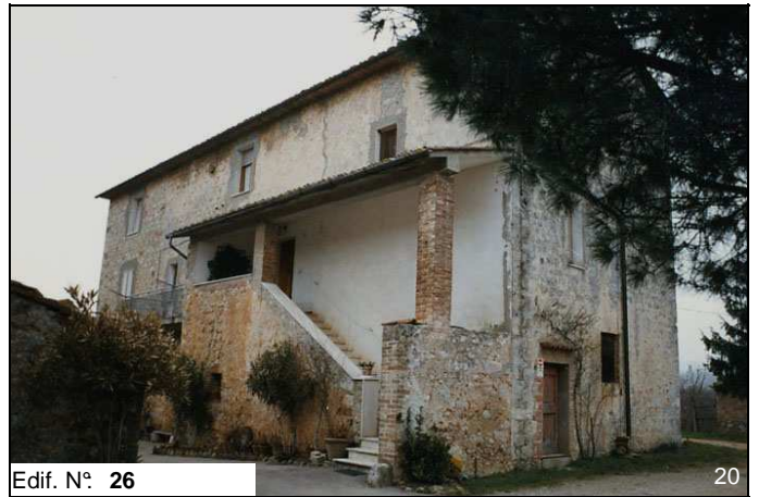
Edif. N° 26