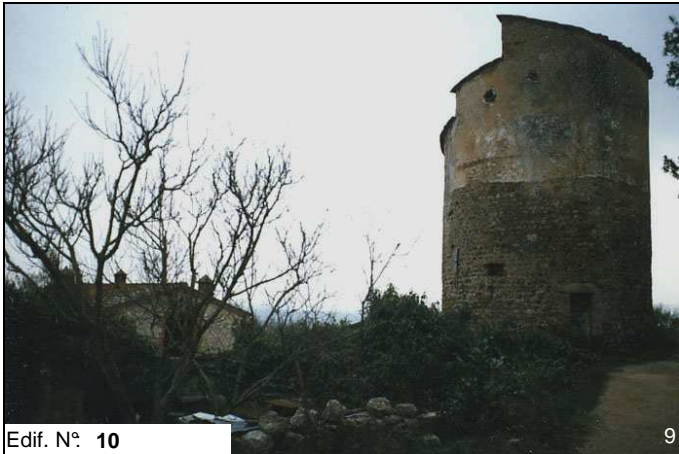
Edif. N° 10