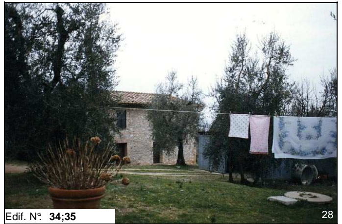
Edif. N° 34;35