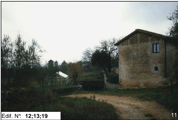
Edif. N° 12;13;19