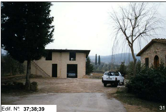
Edif. N° 37;38;39