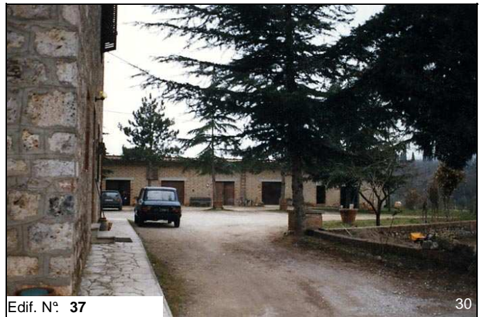
Edif. N° 37