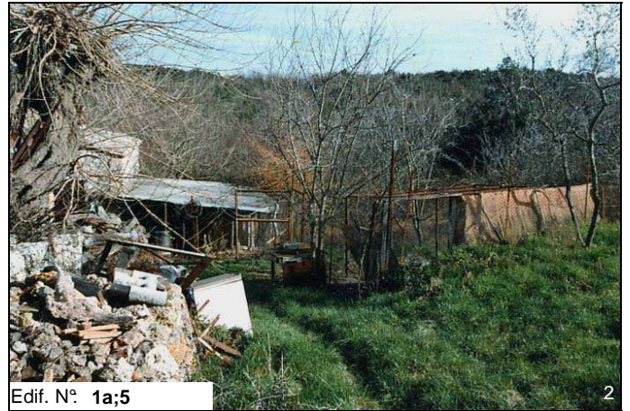
Edif. N° 1a;5