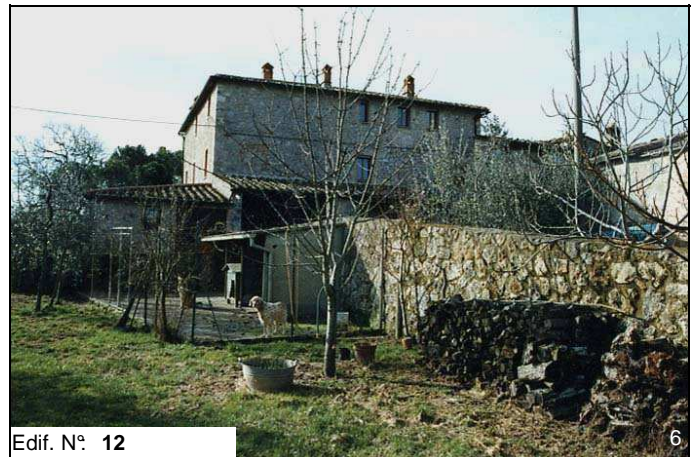
Edif. N° 12