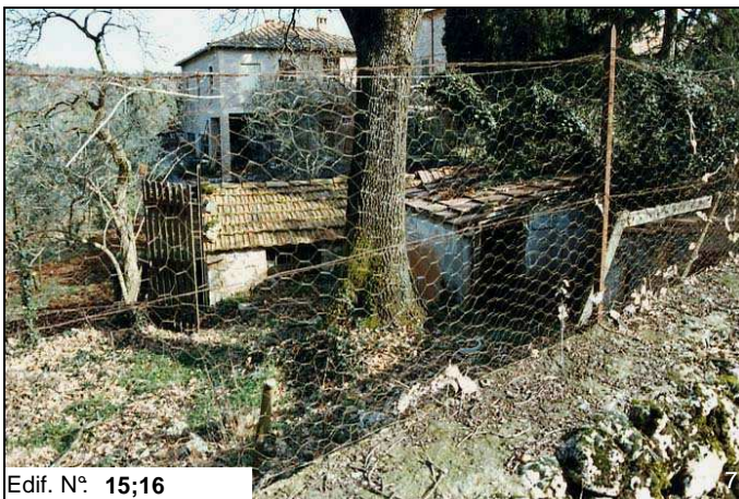
Edif. N° 15;16