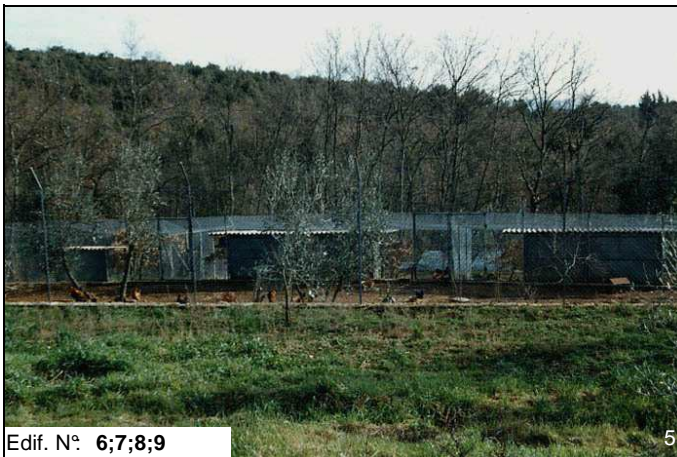
Edif. N° 6;7;8;9