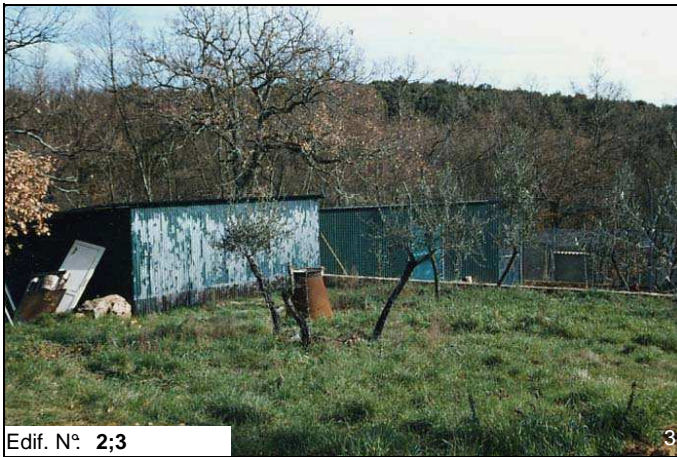
Edif. N° 2;3