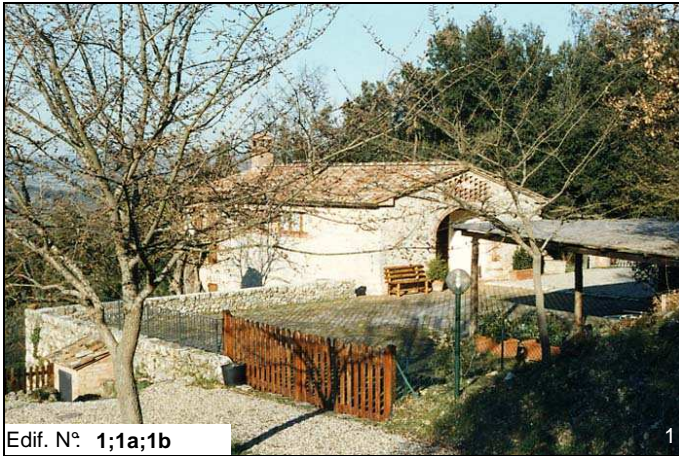
Edif. N° 1;1a;1b