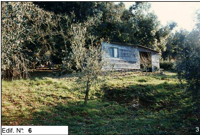
Edif. N° 6