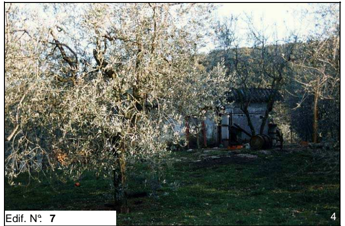
Edif. N° 7