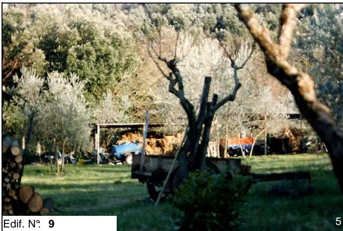
Edif. N° 9