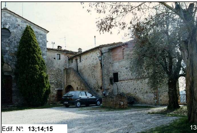
Edif. N° 13;14;15