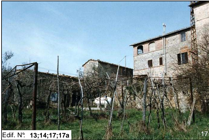
Edif. N° 13;14;17;17a