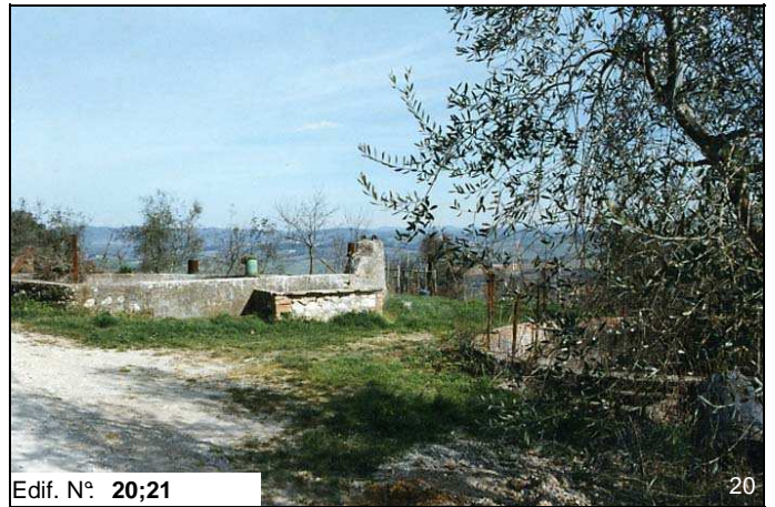
Edif. N° 20;21