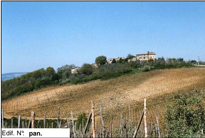
Edif. N° pan.