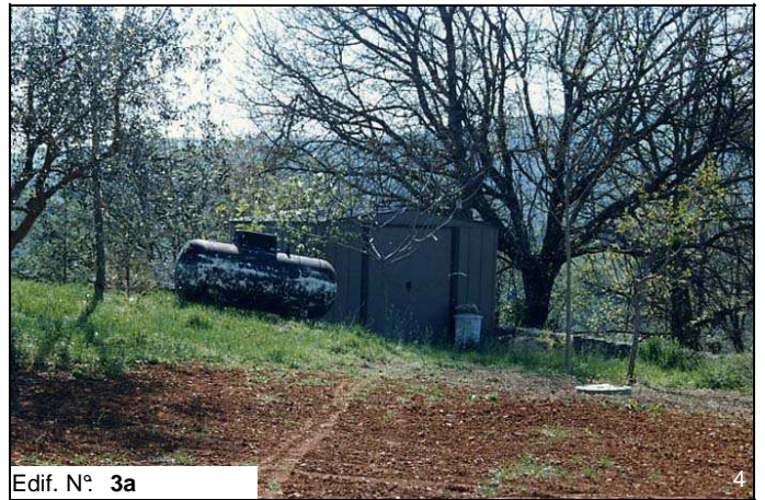
Edif. N° 3a