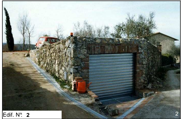
Edif. N° 2