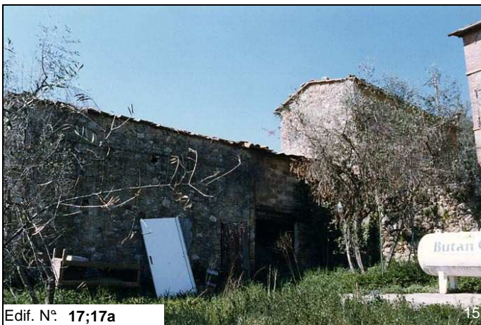
Edif. N° 17;17a