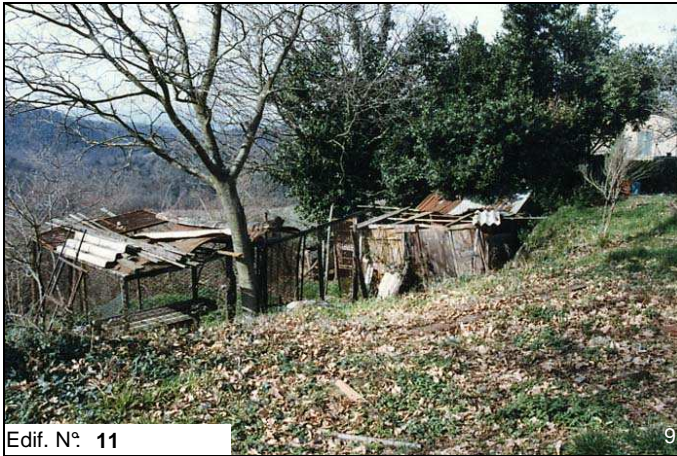
Edif. N° 11