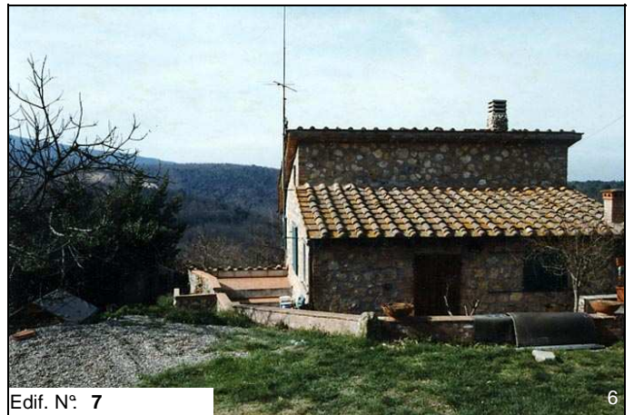
Edif. N° 7