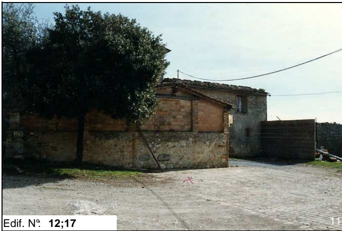
Edif. N° 12;17