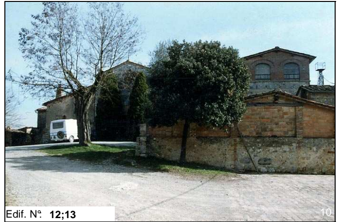
Edif. N° 12;13