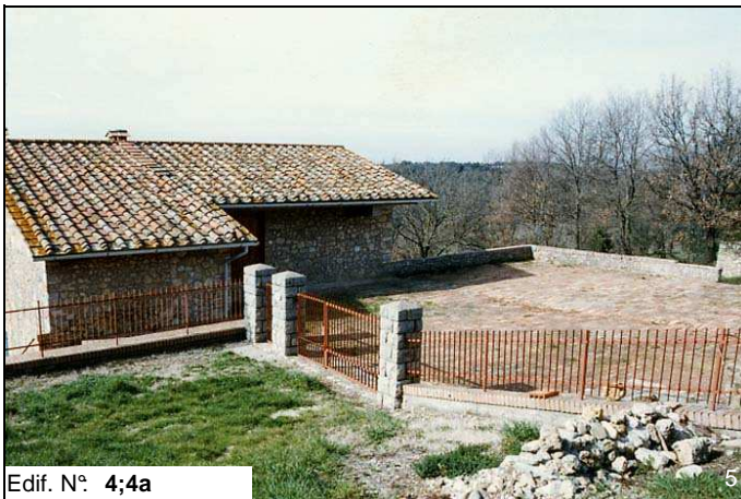
Edif. N° 4;4a