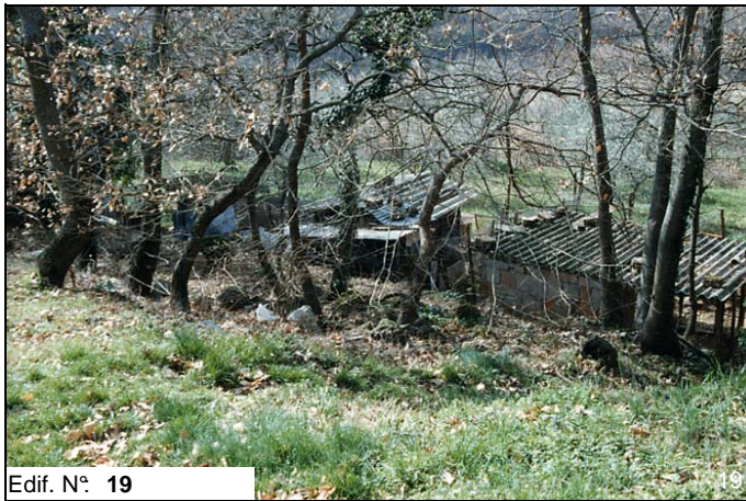
Edif. N° 19