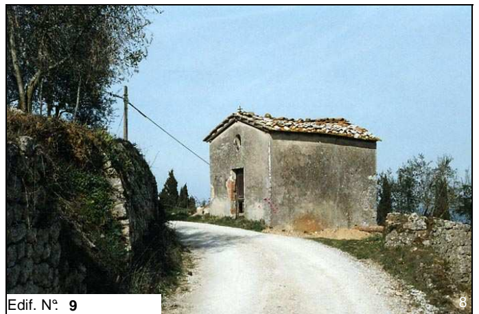
Edif. N° 9