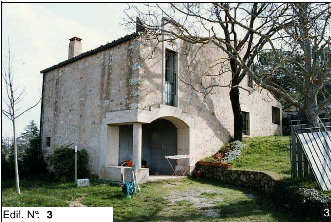
Edif. N° 3