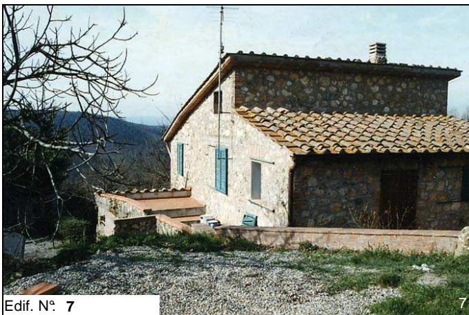
Edif. N° 7