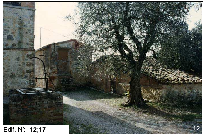
Edif. N° 12;17