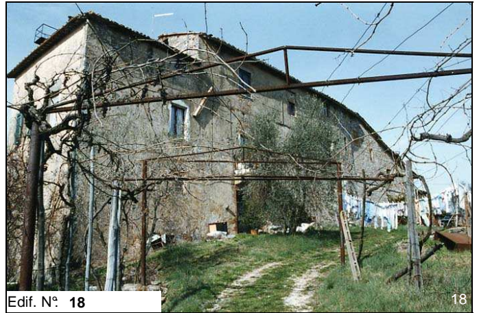
Edif. N° 18