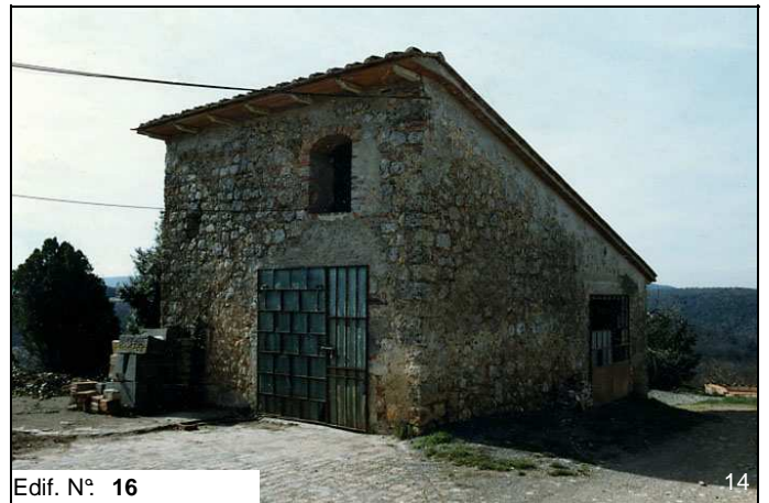
Edif. N° 16