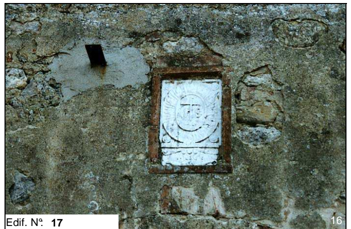
Edif. N° 17