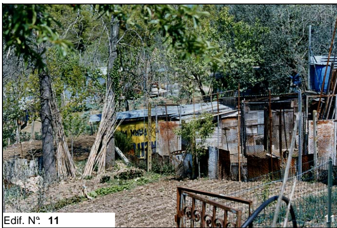
Edif. N° 11