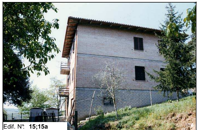
Edif. N° 15;15a