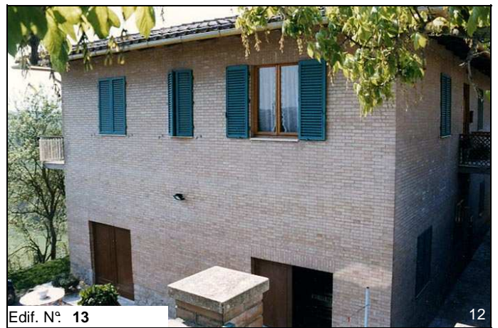
Edif. N° 13