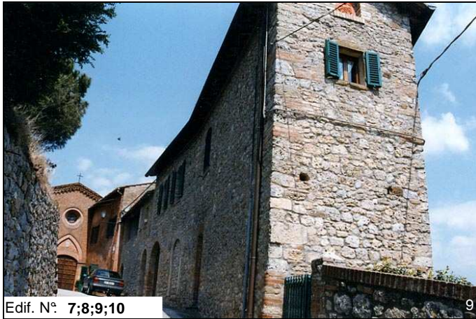
Edif. N° 7;8;9;10