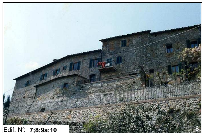
Edif. N° 7;8;9a;10