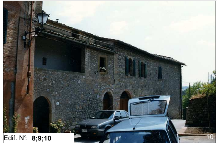
Edif. N° 8;9;10