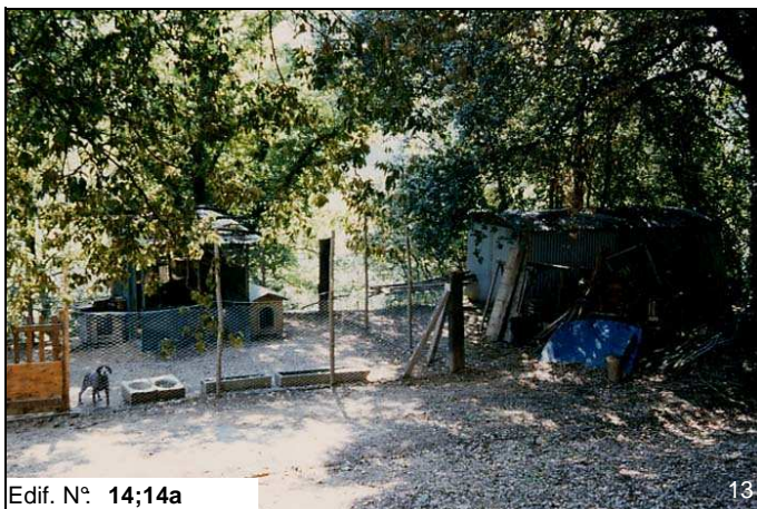
Edif. N° 14;14a