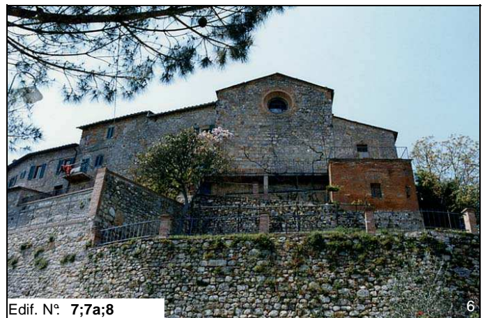
Edif. N° 7;7a;8