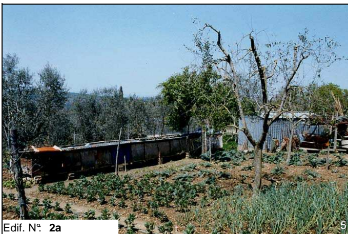
Edif. N° 2a