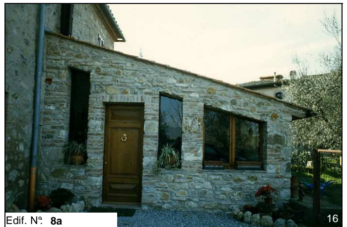
Edif. N° 8a