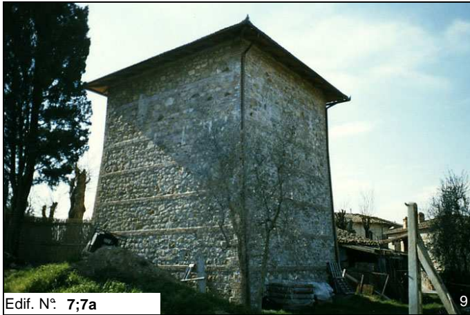
Edif. N° 7;7a