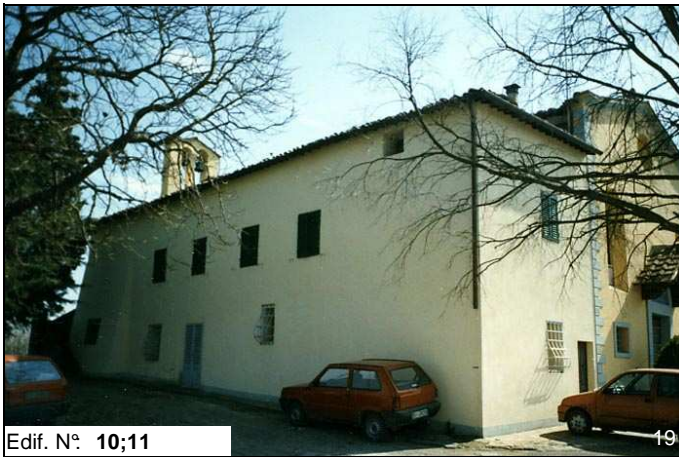
Edif. N° 10;11