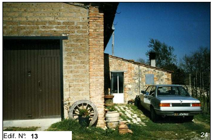
Edif. N° 13