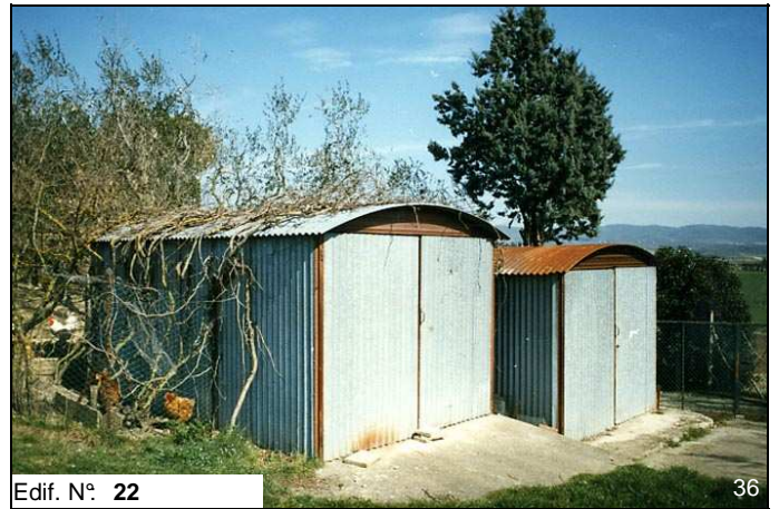
Edif. N° 22