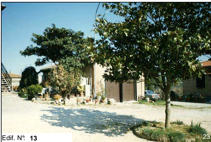
Edif. N° 13