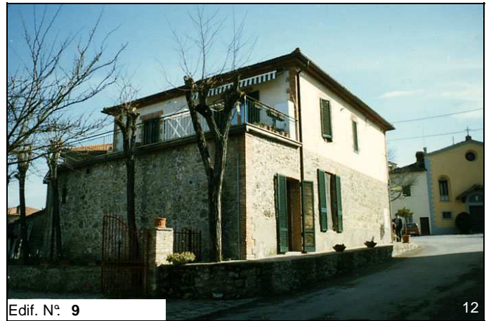
Edif. N° 9