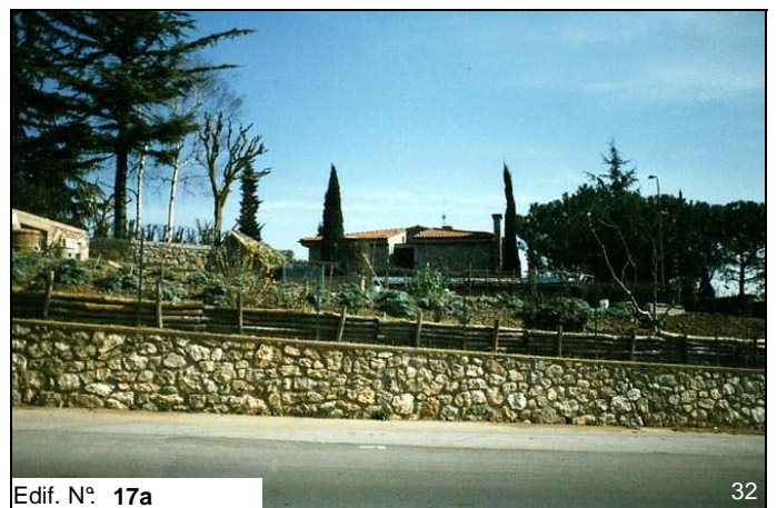
Edif. N° 17a