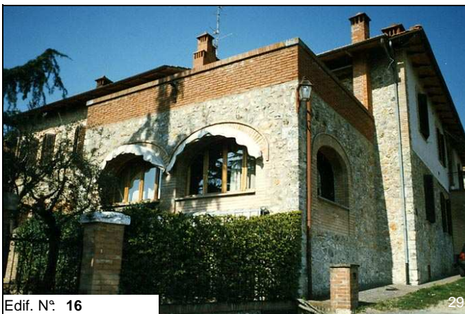
Edif. N° 16