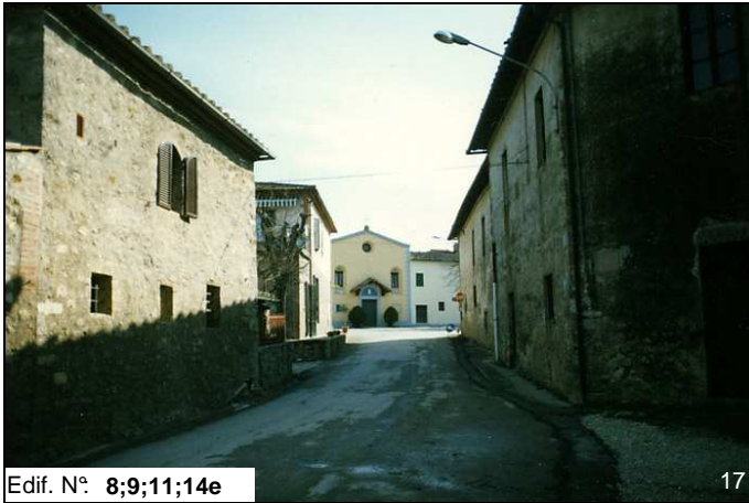
Edif. N° 8;9;11;14e