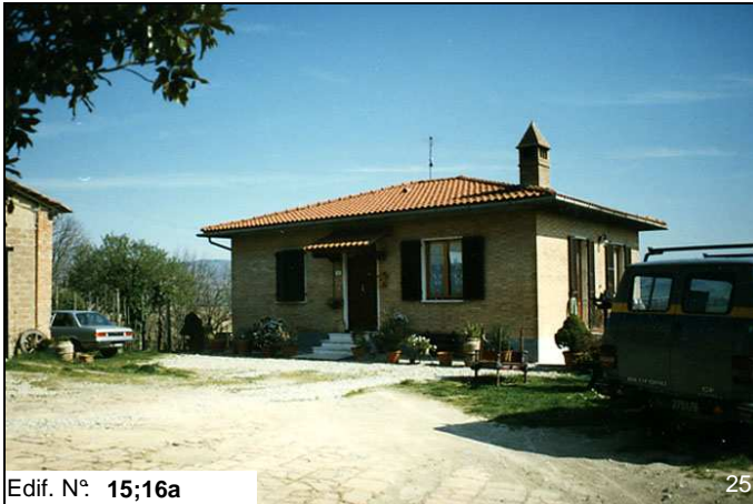
Edif. N° 15;16a