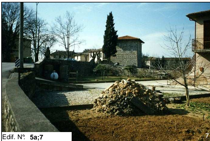
Edif. N° 5a;7