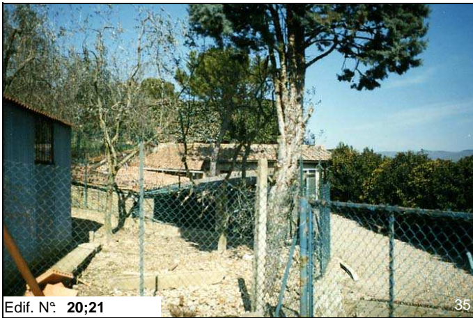
Edif. N° 20;21