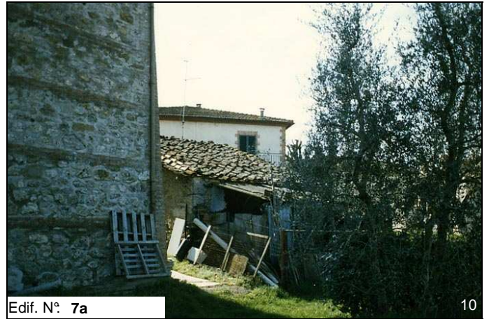
Edif. N° 7a