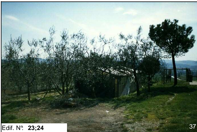
Edif. N° 23;24