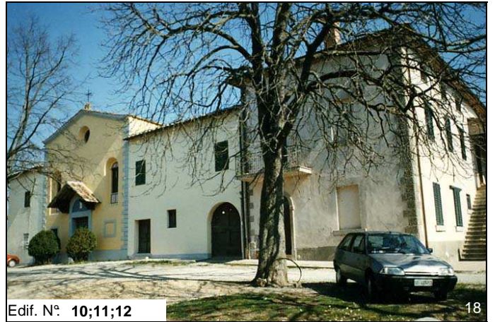
Edif. N° 10;11;12