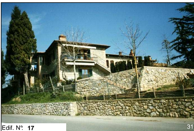
Edif. N° 17