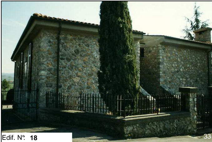
Edif. N° 18