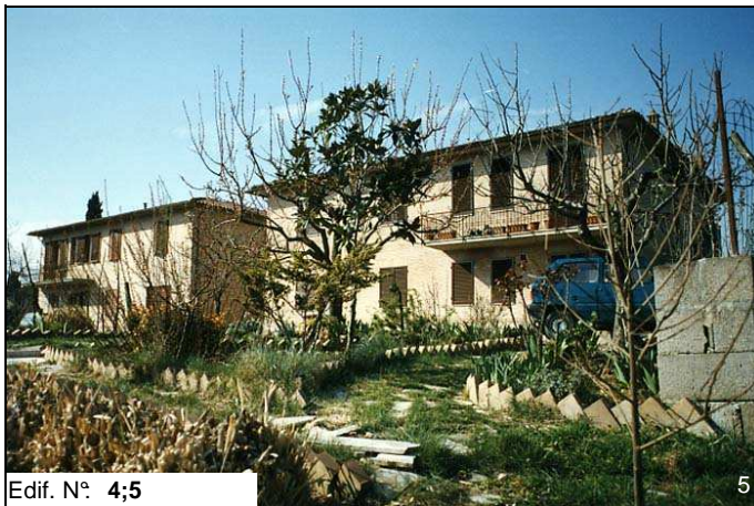
Edif. N° 4;5