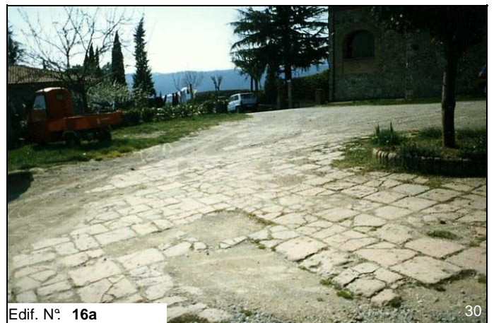
Edif. N° 16a