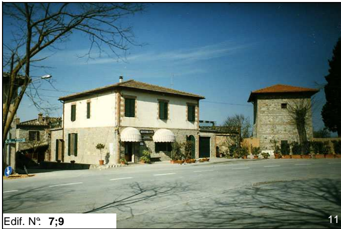
Edif. N° 7;9