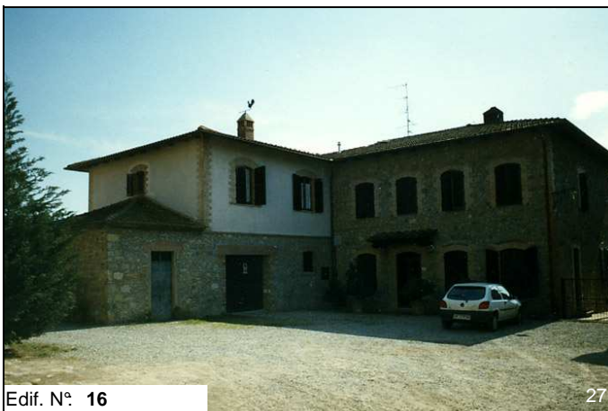
Edif. N° 16