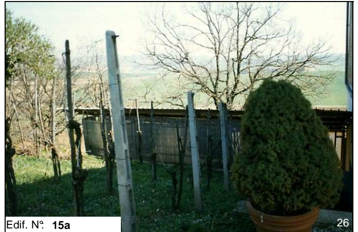
Edif. N° 15a