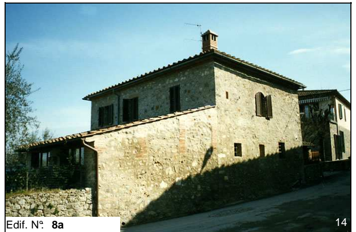
Edif. N° 8a