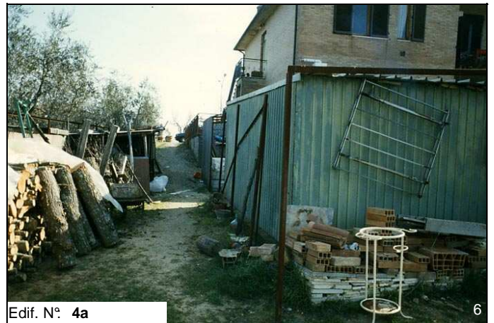
Edif. N° 4a