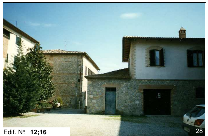
Edif. N° 12;16