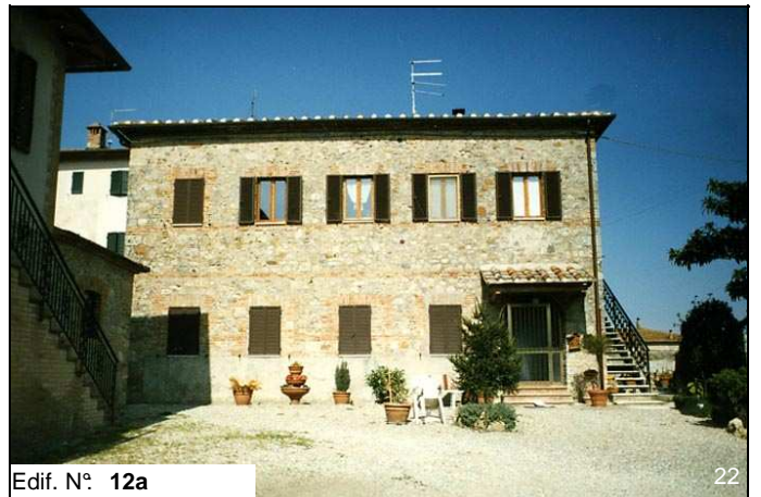
Edif. N° 12a