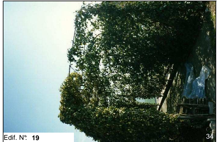
Edif. N° 19