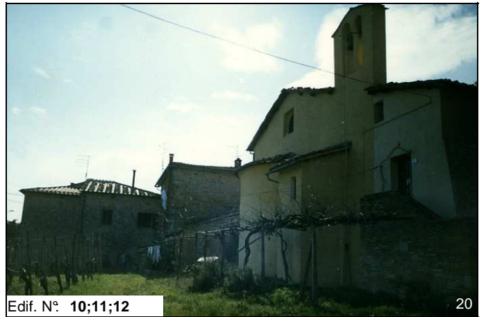
Edif. N° 10;11;12