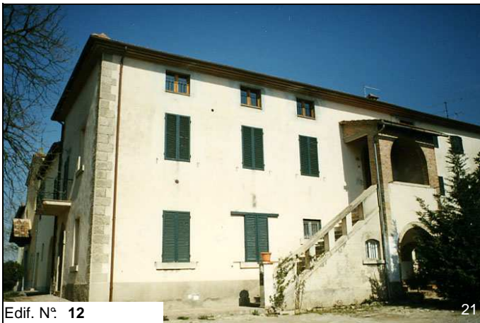
Edif. N° 12