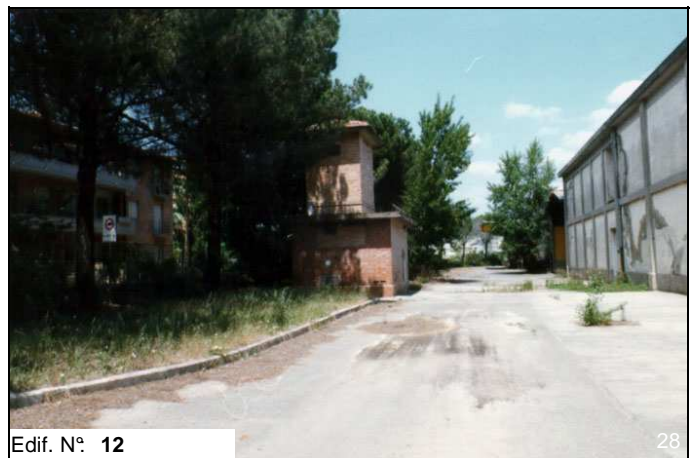
Edif. N° 12