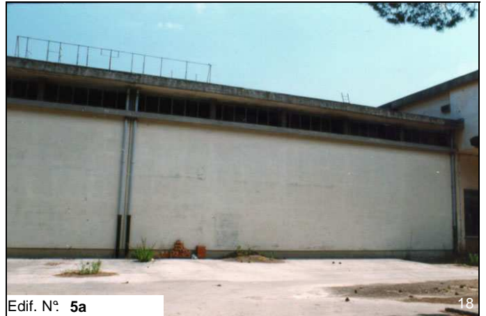
Edif. N° 5a