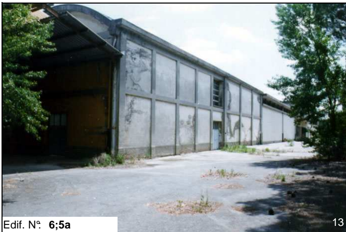
Edif. N° 6;5a