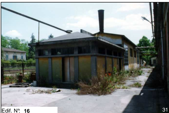
Edif. N° 16