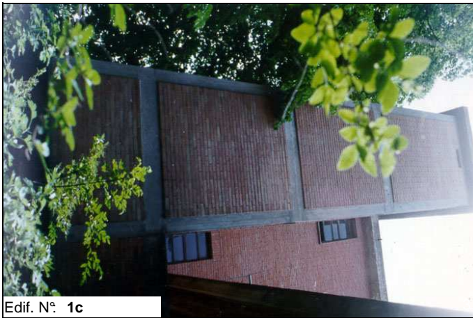
Edif. N° 1c