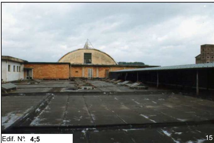
Edif. N° 4;5