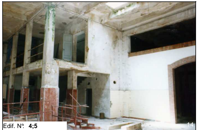
Edif. N° 4;5