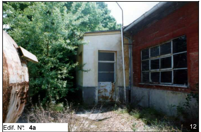
Edif. N° 4a