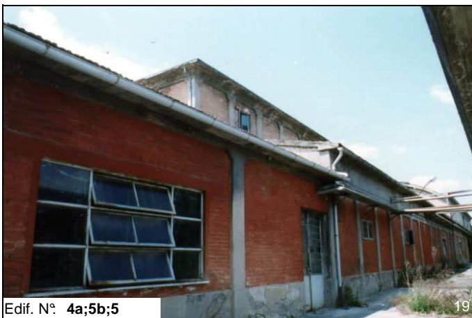
Edif. N° 4a;5b;5