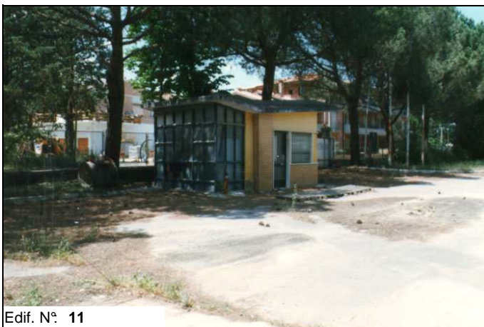
Edif. N° 11