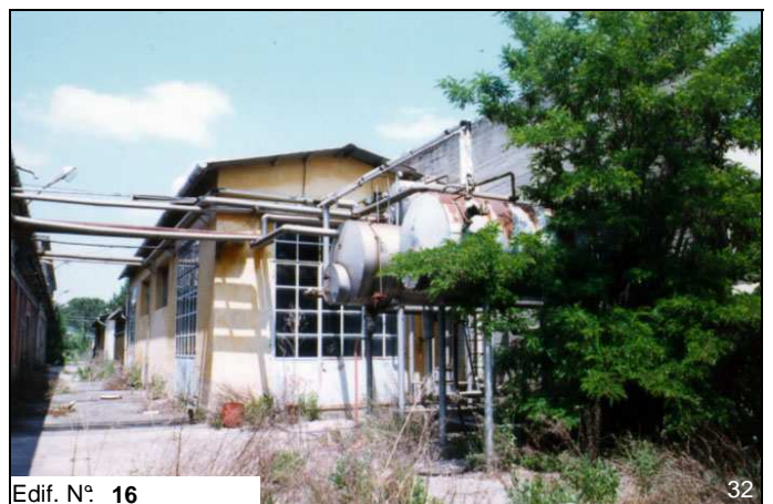
Edif. N° 16