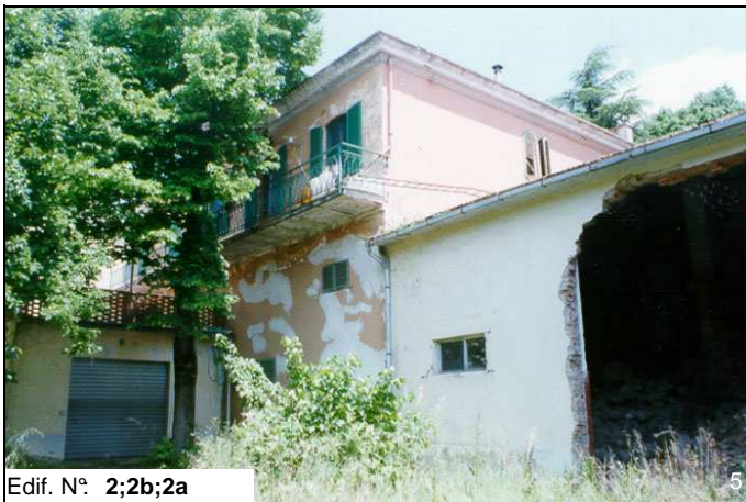
Edif. N° 2;2b;2a