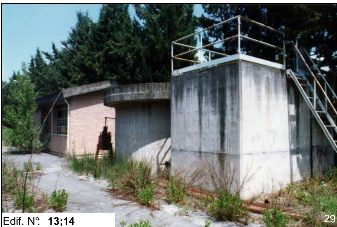
Edif. N° 13;14