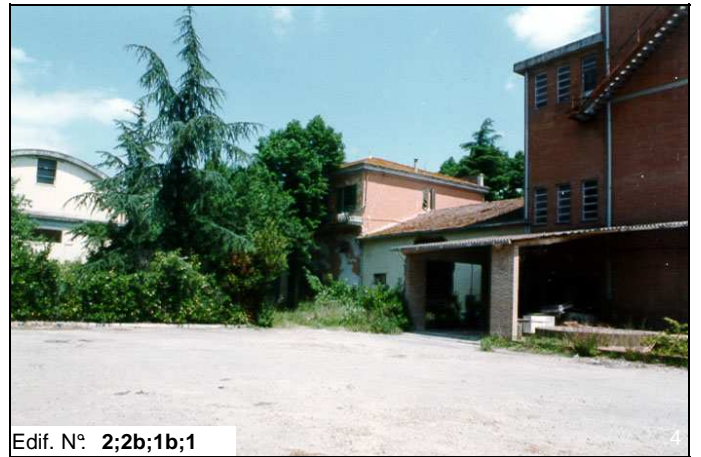
Edif. N° 2;2b;1b;1