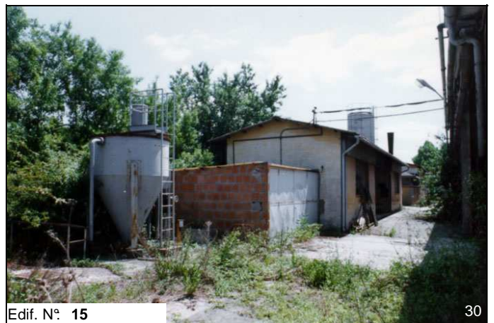
Edif. N° 15