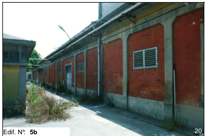
Edif. N° 5b