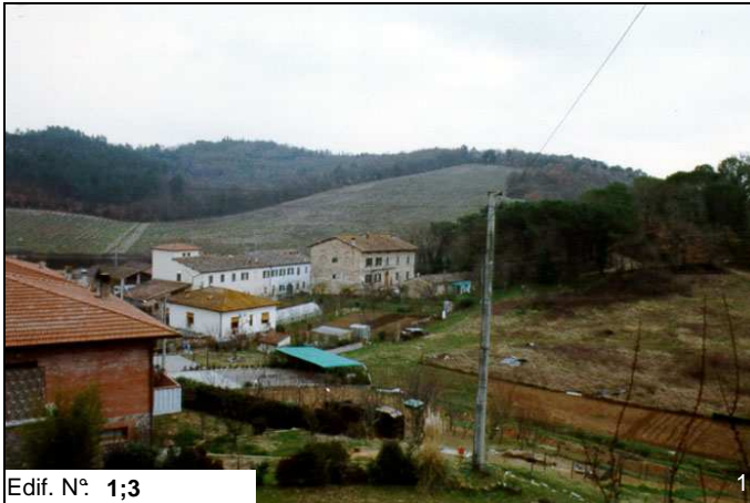
Edif. N° 1;3