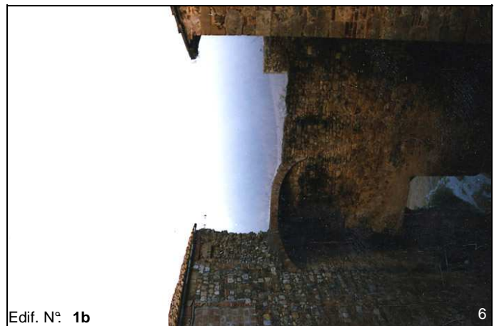
Edif. N° 1b