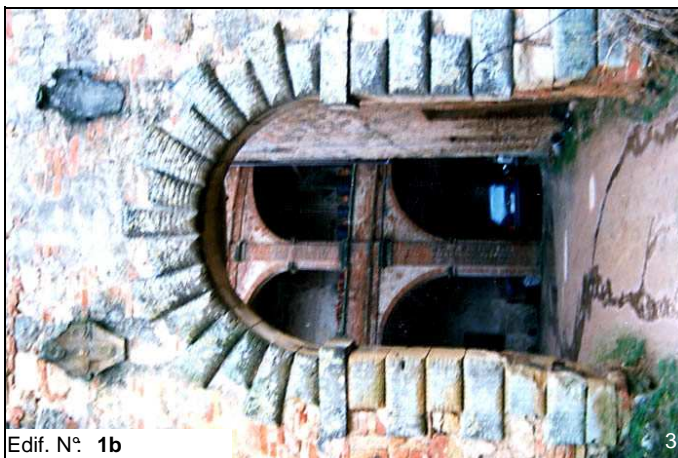
Edif. N° 1b