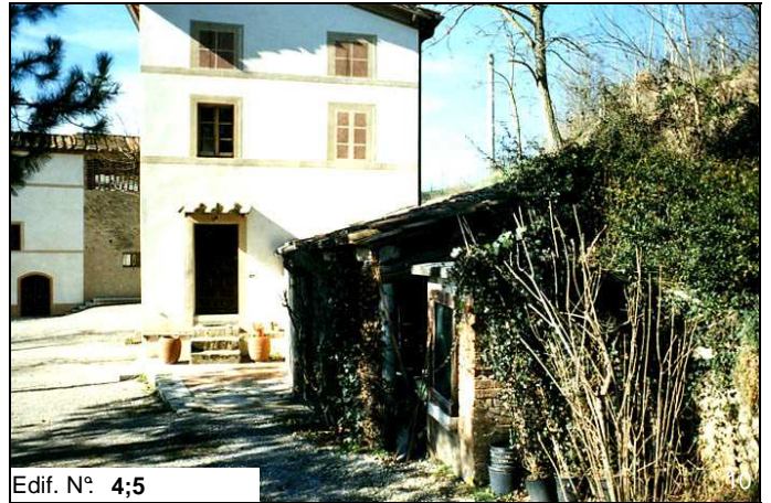
Edif. N° 4;5