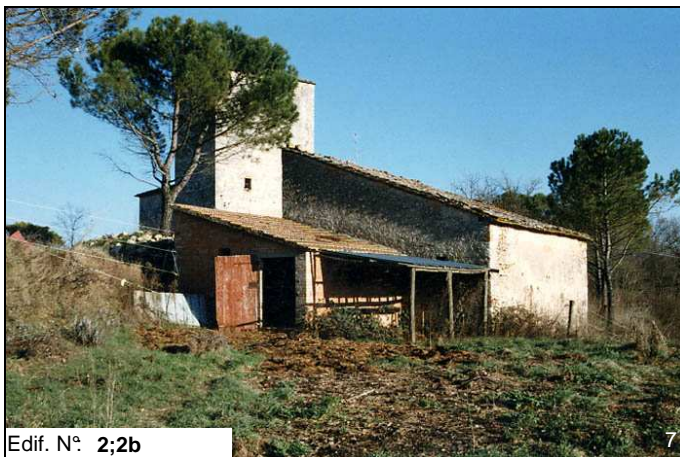
Edif. N° 2;2b