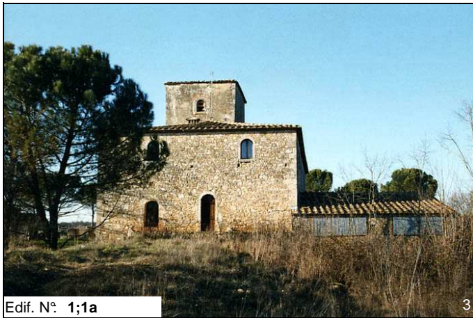
Edif. N° 1;1a