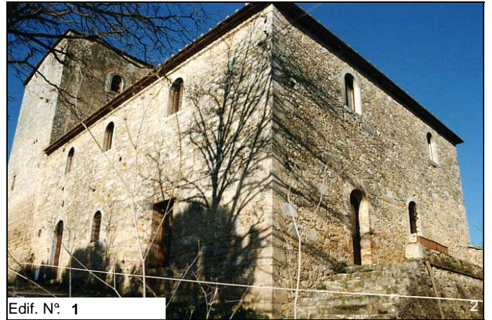
Edif. N° 1