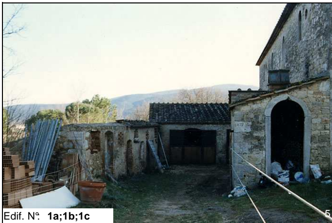
Edif. N° 1a;1b;1c