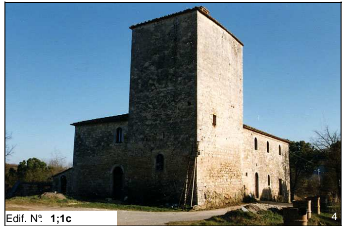
Edif. N° 1;1c