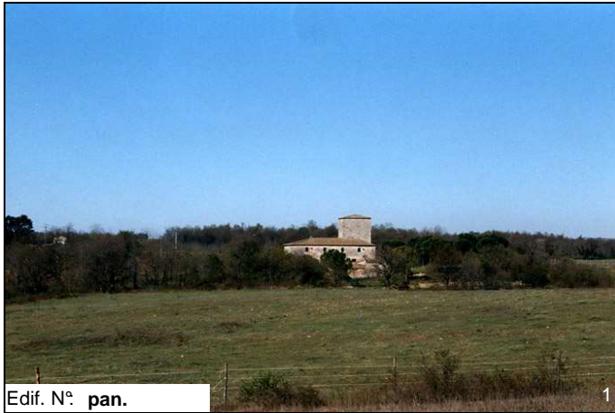
Edif. N° pan.