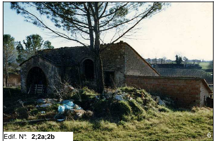
Edif. N° 2;2a;2b