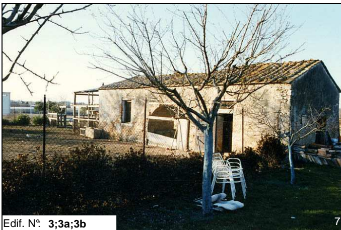
Edif. N° 3;3a;3b