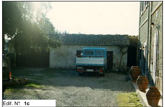
Edif. N° 1c