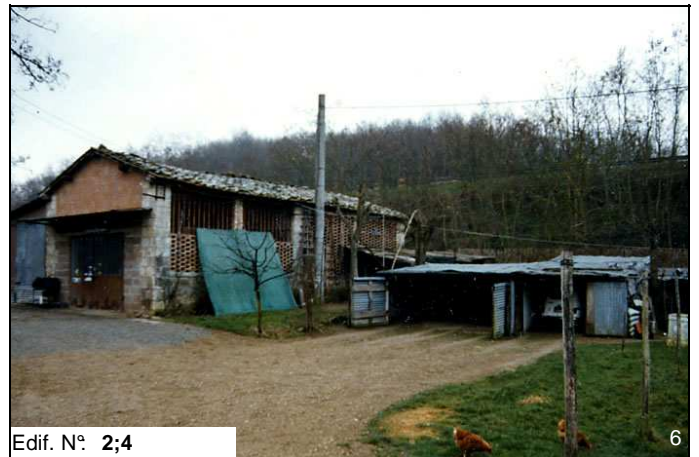
Edif. N° 2;4