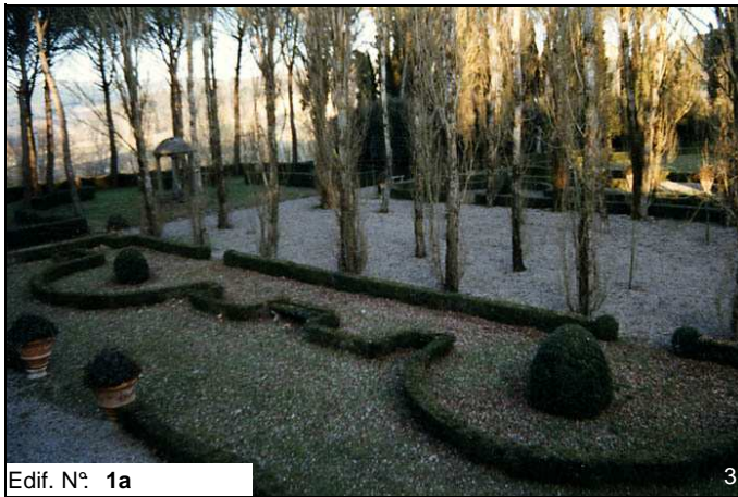
Edif. N° 1a