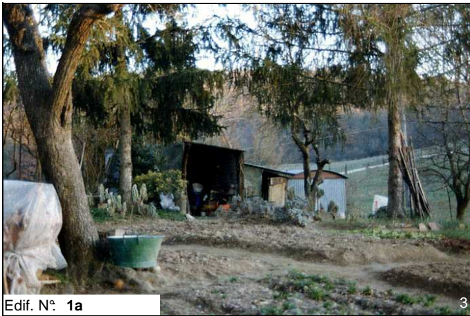
Edif. N° 1a