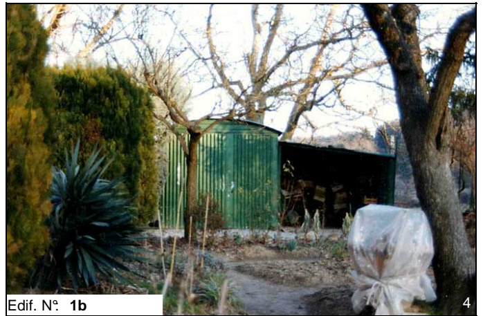
Edif. N° 1b