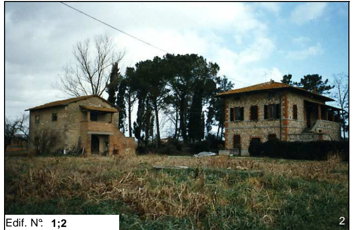
Edif. N° 1;2