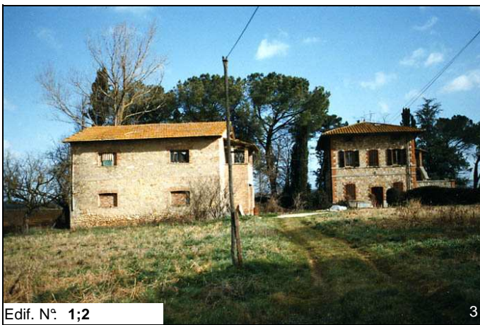
Edif. N° 1;2