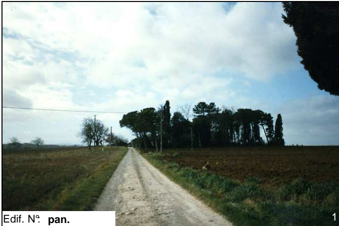
Edif. N° pan.