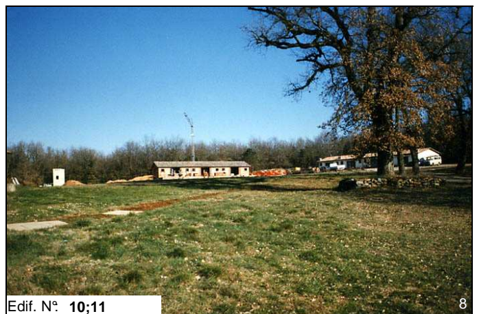
Edif. N° 10;11