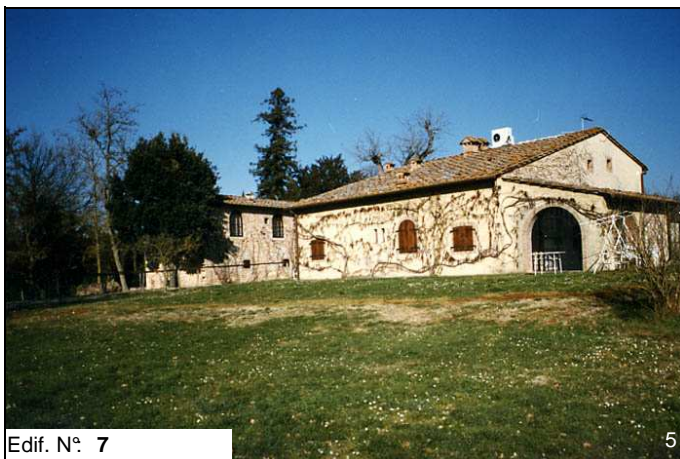
Edif. N° 7