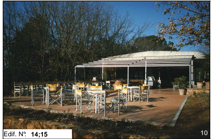
Edif. N° 14;15