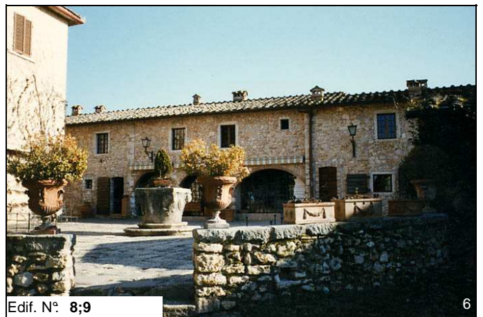
Edif. N° 8;9