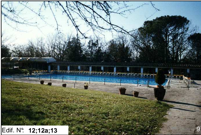
Edif. N° 12;12a;13