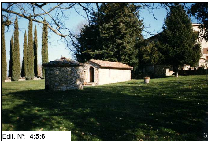
Edif. N° 4;5;6