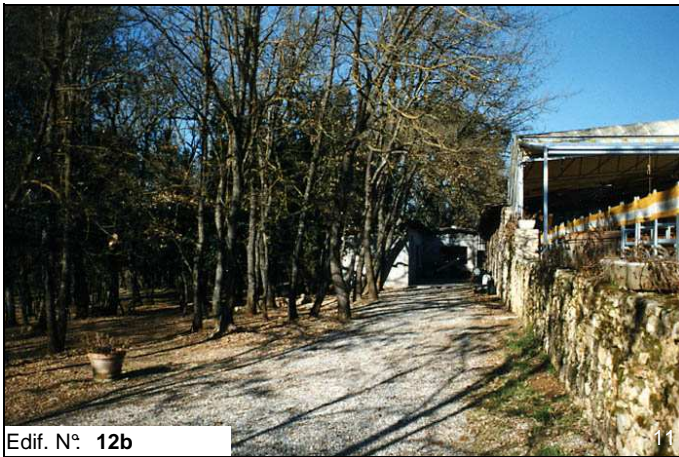
Edif. N° 12b