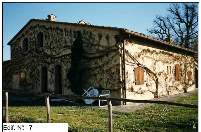
Edif. N° 7