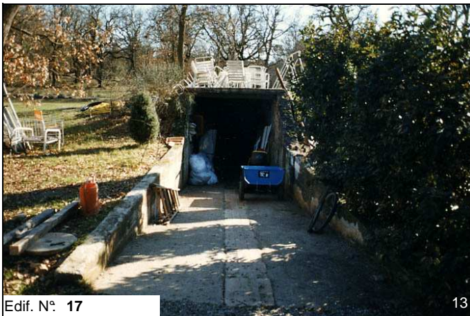
Edif. N° 17