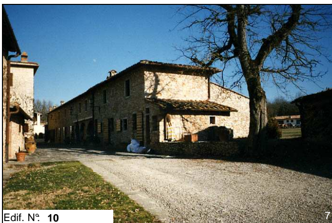
Edif. N° 10