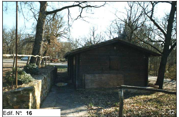
Edif. N° 16