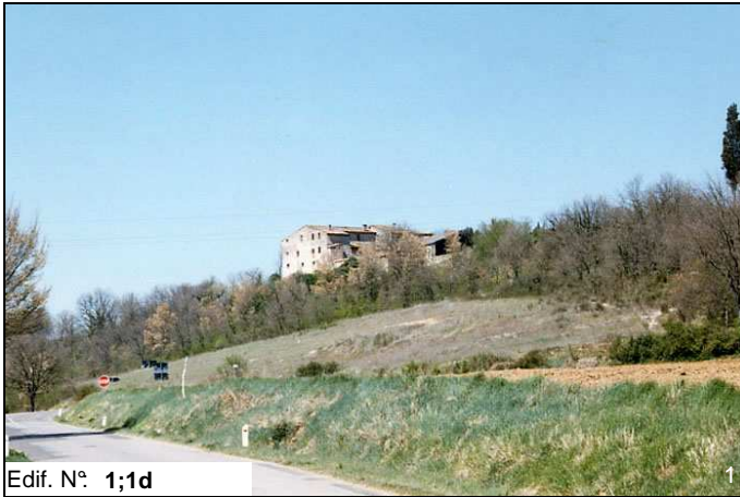
Edif. N° 1;1d