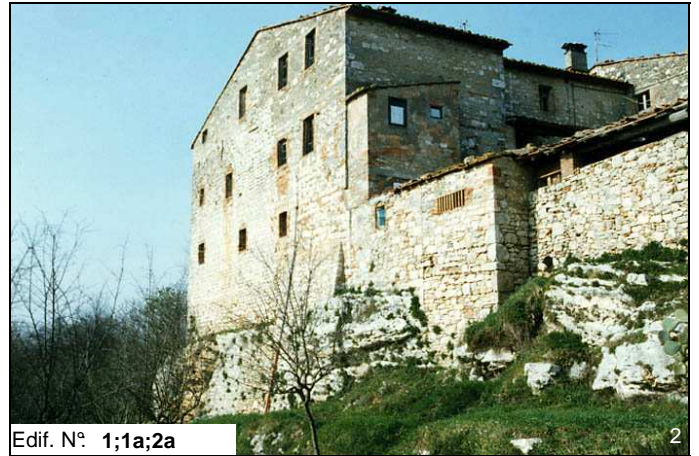
Edif. N° 1;1a;2a