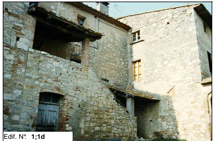
Edif. N° 1;1d