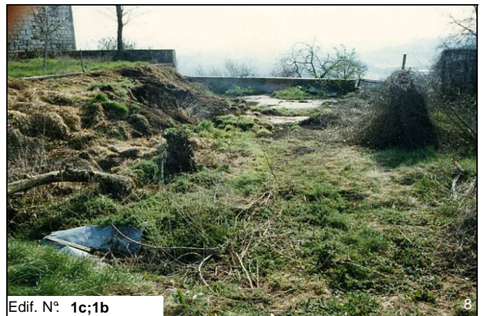
Edif. N° 1c;1b