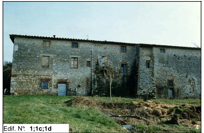
Edif. N° 1;1c;1d