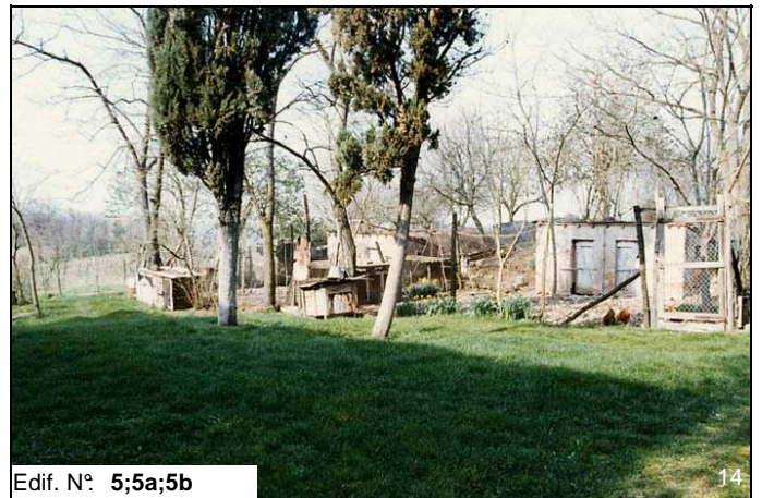
Edif. N° 5;5a;5b