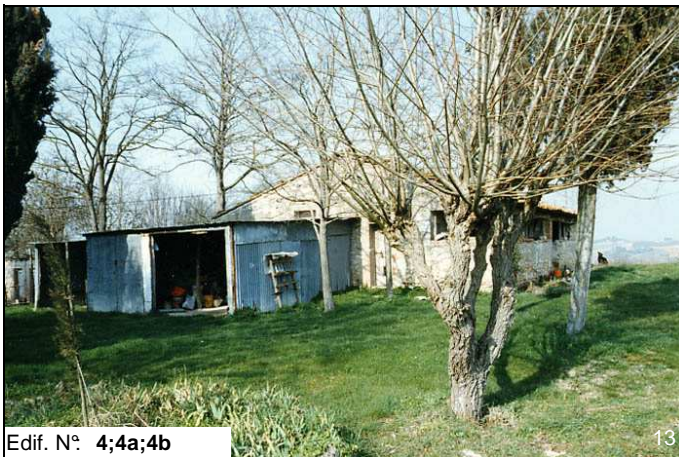
Edif. N° 4;4a;4b