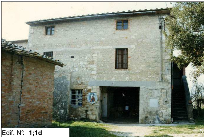
Edif. N° 1;1d