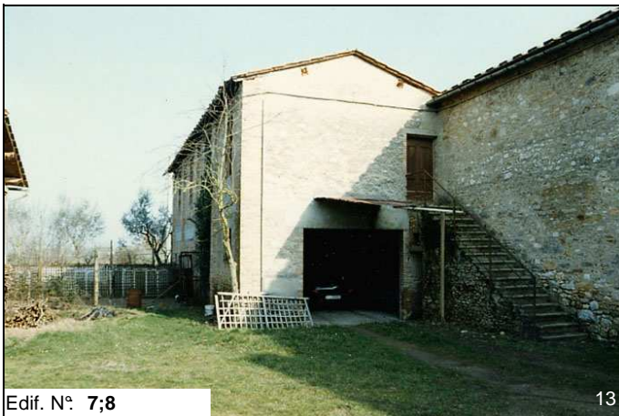
Edif. N° 7;8