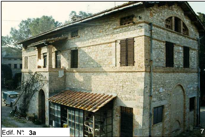
Edif. N° 3a