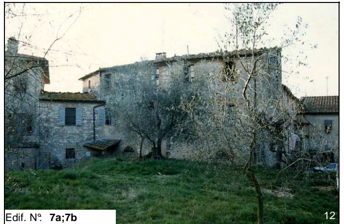
Edif. N° 7a;7b