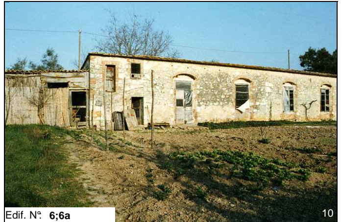
Edif. N° 6;6a