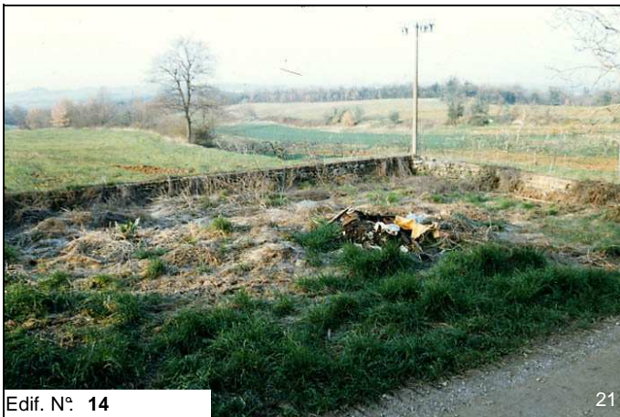
Edif. N° 14