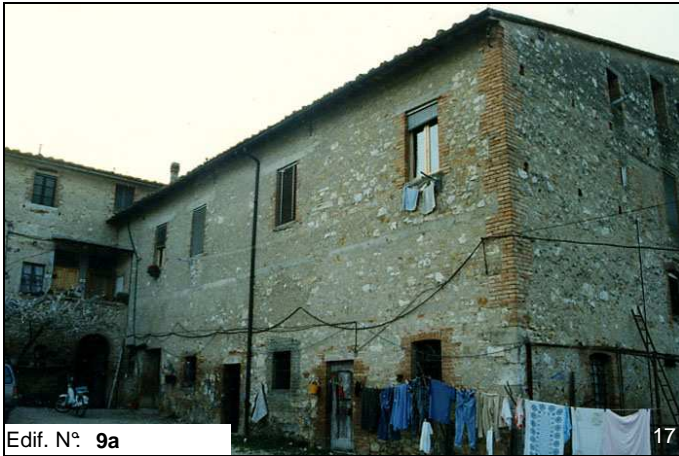
Edif. N° 9a