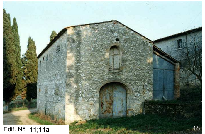
Edif. N° 11;11a