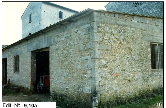
Edif. N° 9;10a