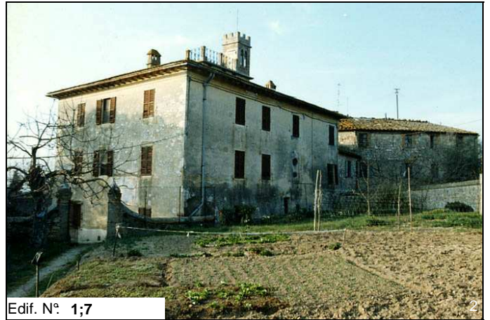
Edif. N° 1;7