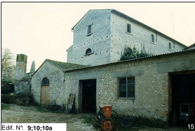
Edif. N° 9;10;10a