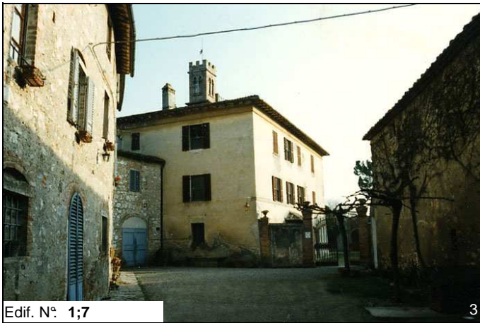
Edif. N° 1;7