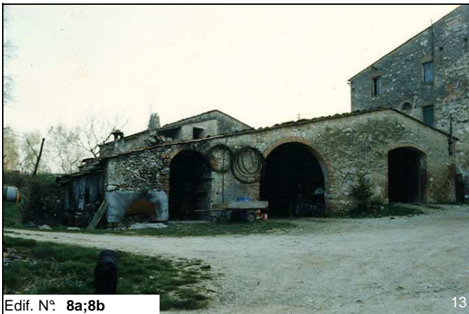
Edif. N° 8a;8b