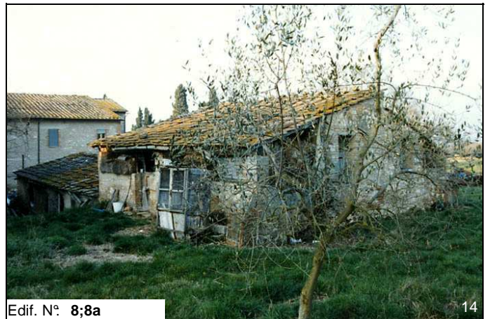
Edif. N° 8;8a