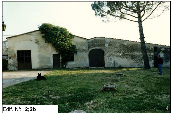
Edif. N° 2;2b