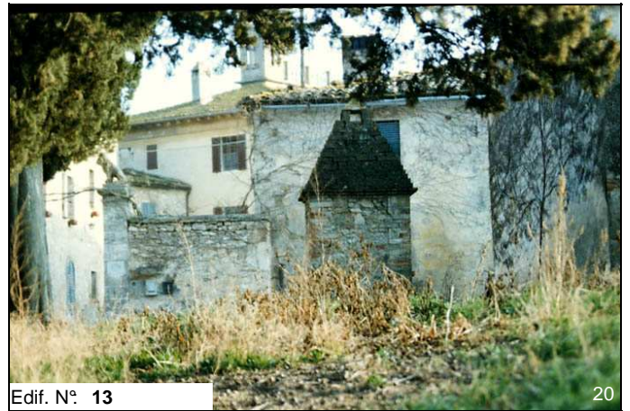
Edif. N° 13