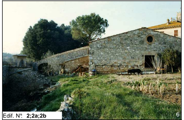
Edif. N° 2;2a;2b