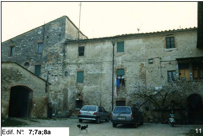
Edif. N° 7;7a;8a