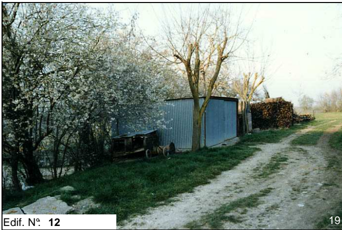
Edif. N° 12