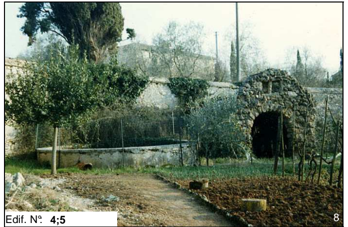
Edif. N° 4;5