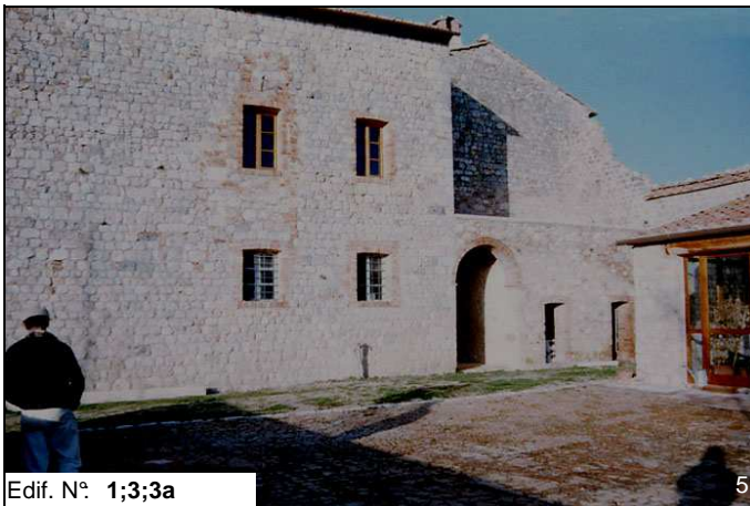
Edif. N° 1;3;3a