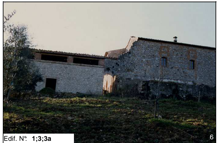
Edif. N° 1;3;3a