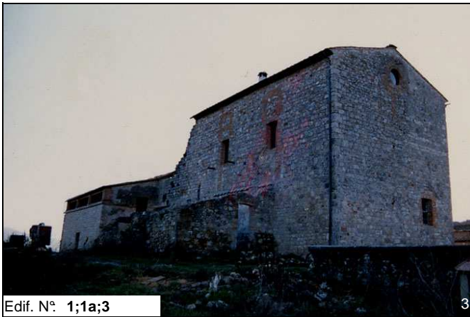
Edif. N° 1;1a;3